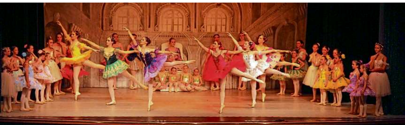
70 Ballerinnen waren in Westerburg beteiligt. Das Entrée der Feen war sehr beeindruckend.