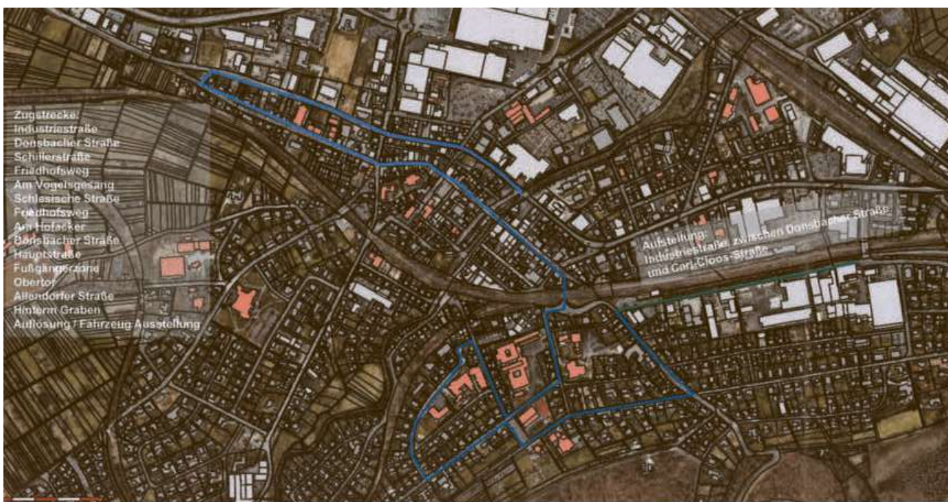
Von der Industriestraße bis „Hinterm Graben“ - die blaue Linie stellt den Streckenverlauf dar.

Der Streckenverlauf in diesem Jahr: Aufstellung Industriestraße (beginnend an der Einmündung Donsbacher Straße), Donsbacher Straße, Schillerstraße, Friedhofsweg, Am Vogelsang, Schlesische Straße, Friedhofsweg, Am Vogelsang, Am Hofacker, Donsbacher Straße, Hauptstraße, Fußgängerweg, Obertor, Allendorfer Straße, Hinterm Graben, Auflösung / Fahrzeug-Ausstellung