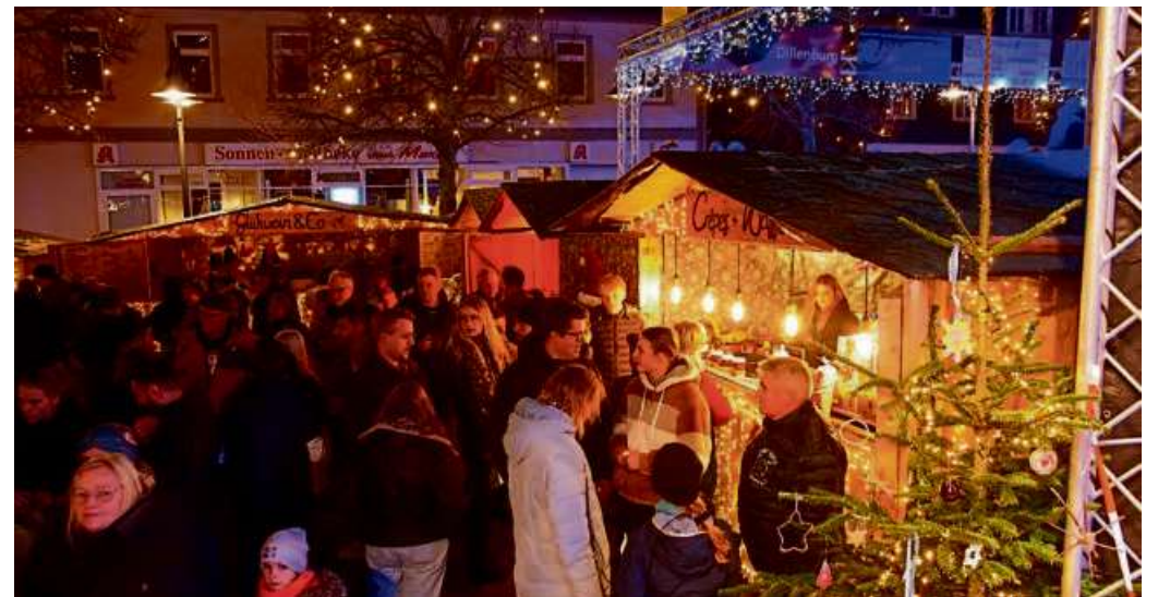
An den Hütten des Marktes herrschte reger Betrieb.