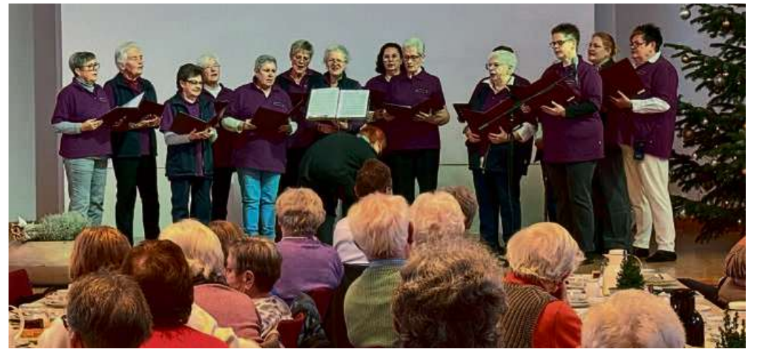
Der Aar-Gesangverein unterhielt die Besucher.

he es darum, diese Liebe anzunehmen – darum müsse es gerade in der Weihnachtszeit gehen.