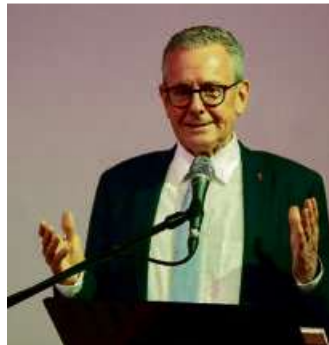
Bürgermeister Schramm hielt seine letzte Rede bei einer städtischen Weihnachtsfeier.

Feier, Sportfest, Konzert oder Basar: Vereine, Kirchengemeinden und weitere Gruppen können gerne Berichte für die Veröffentlichung in „Haiger heute“ einsenden. Die Texte können an die Mailadresse presse@haiger.de geschickt werden. Bitte beachten: Redaktionsschluss ist montags um 12 Uhr. Bei Fragen hilft die städtische Pressestelle unter 02773/811-333. Veröffentlichungen sind für Vereine und andere Gruppen kostenlos. Wichtig: In der neuen Haiger-App können Vereine ihre Termine eigenständig im Kalender eintragen. Kostenlose App-Registrierung: Mail an presse@haiger.de .