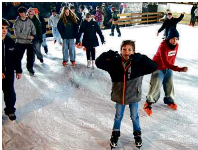
Wenn das Wetter gut ist, kann es auf der Eisbahn schon mal eng werden.