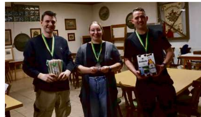
Siegerehrung mit originellen Preisen.

ten Gutscheine des moviestar-Kinos in Dillenburg.