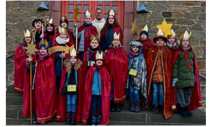
Die Sternsinger sind wieder unterwegs.

HAIGER (Jra) – Auch 2026 sind die Sternsinger wieder in Haiger und den Stadtteilen unterwegs. Die Sternsinger sind Kinder, die sich für andere Kinder stark machen. Jedes Jahr gibt es einen Schwerpunkt, für den die Sänger zu den Menschen kommen, die einen Besuch wünschen. Neben einem vorgetragenen Text der Kinder wird auch ein Segen an die Haustüre angebracht, der den Menschen in diesem Haus und allen Besuchern des Hauses gelten soll.