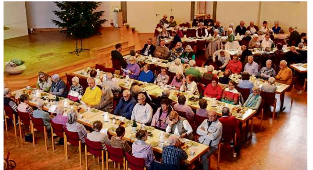
Rund 200 Gäste waren zum Seniorennachmittag gekommen.