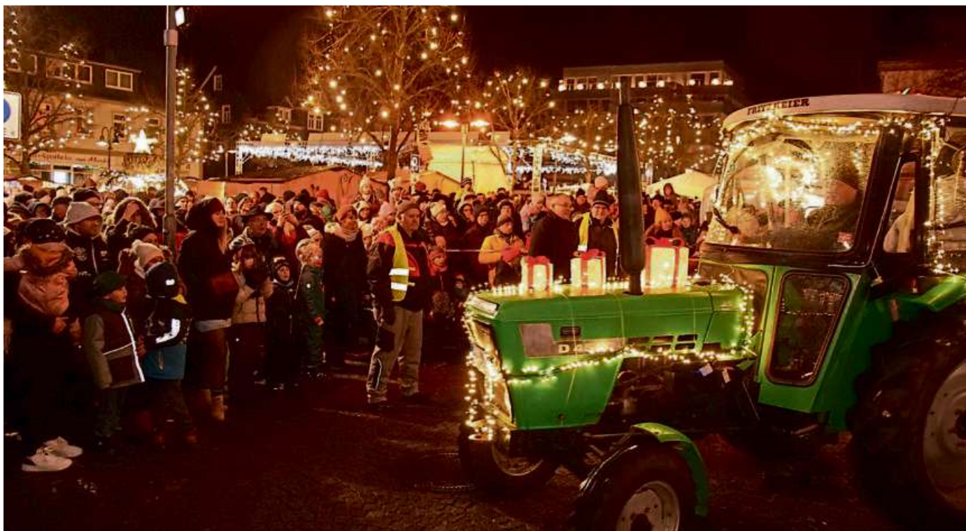
Mehrere tausend Besucher genossen im vergangenen Jahren die Lichterfahrt der Traktoren und Landmaschinen. In der Hauptstraße und rund um den Marktplatz (Foto) herrschte großer Betrieb.

HAIGER (öah/rst) – Auf diesen Termin haben sich viele Haigerer gefreut: Am kommenden Samstag (13. Dezember) findet die dritte Haigerer Lichterfahrt mit Traktoren und Landmaschinen statt. Von 17 bis etwa 21 Uhr wird die Innenstadt von den bunt geschmückten Fahrzeugen dominiert – ein echtes Erlebnis für jeden Besucher. Der Startschuss erfolgt um 17 Uhr am Ende der Industriestraße. Im vergangenen Jahr kamen mehrere tausend Besucher, um sich dieses Erlebnis nicht entgehen zu lassen. In der Innenstadt herrschte eine wunderbar festliche Atmosphäre.