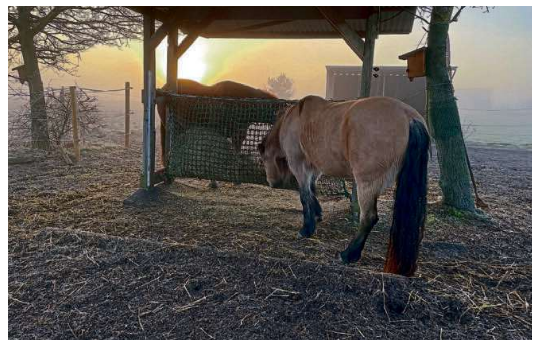
Um Verschlämmung zu vermeiden, kann der Bereich um die Futterstelle der Tiere befestigt werden.

Wichtig sei auch, dass die Weidefläche weitläufig genug ist, damit die Tiere besonders verschlammten Stellen ausweichen können. Je matschiger die Fläche ist, desto größer ist die Gefahr, dass die Tiere tief einsinken, das Fell nass und schmutzig wird und damit nicht mehr ausreichend isolieren kann. Um das an häufig genutzten Stellen, etwa rund um die Fressstelle, zu verhindern, hilft eine Befestigung um die Raufe herum oder ein regelmäßiges Versetzen derselben.