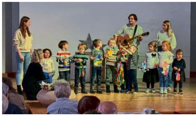
Der Kindergarten aus der Bitzenstraße sang Lieder zum Thema „Licht“.

200 Besucher kommen zur städtischen Weihnachtsfeier – Musikalisches Programm