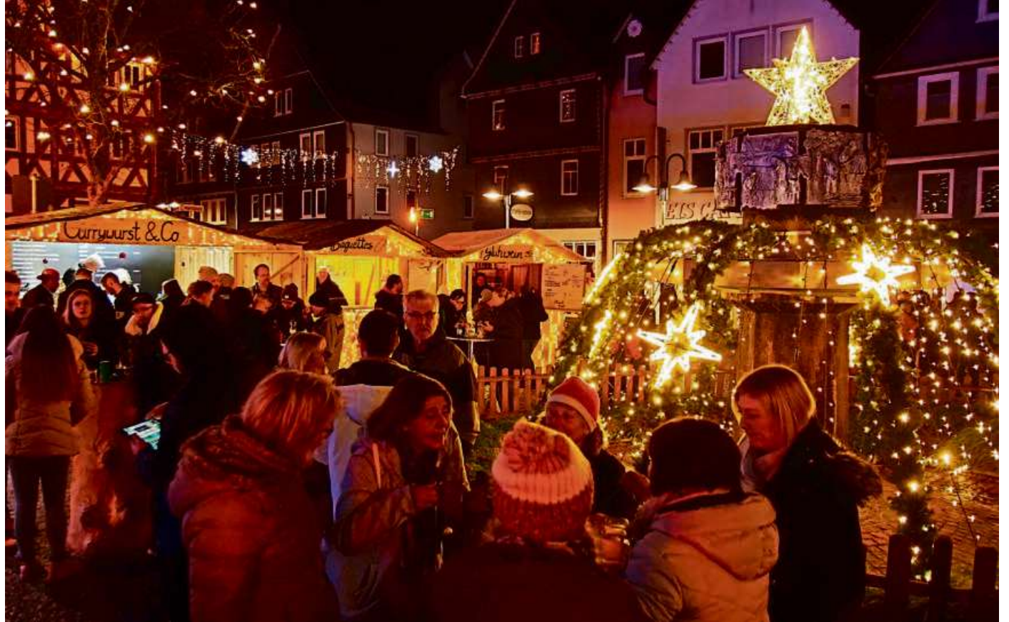
Tolle Atmosphäre: Der Weihnachtsmarkt war am ersten Adventswochenende gut besucht. Viele Gäste genossen einen Glühwein oder eine Feuerzangenbowle im schön beleuchteten Ambiente.

Am Sonntag (7. Dezember) ab 16.30 Uhr bestimmt der Kinderchor „Sonnenstrahlen für Jesus“ das Geschehen im Stadtzentrum. Über 40 Kinder sowie eine sechsköpfige Band singen bekannte und neue Lieder. Der vor 25 Jahren gegründete Chor steht seit 1998 unter der Leitung von Torsten Enseroth. Die jungen Musi-