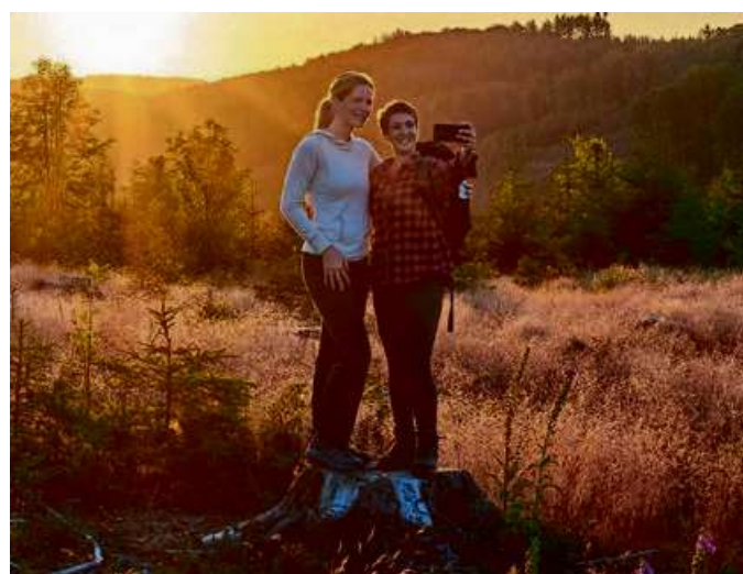
Wanderer unterwegs auf dem Rothaarsteig. Der „Weg der Sinne“ ist jetzt bei der Wahl zu „Deutschlands schönstem Wanderweg“ nominiert.