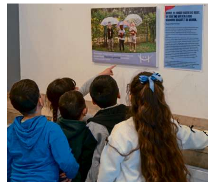
Die Kita Bahnhofstraße stellte das Recht „Im Krieg und auf der Flucht besonders geschützt zu werden“ bildlich dar.

Der Bürgermeister erklärte den Kindern, dass der Bürger im Rathaus Rat bekommt, wenn er Fragen hat und dass der Rathauschef für die Einhaltung von Recht und Ordnung in der Kommune sorgt. Passend dazu schenkte er den Kindern kleine bunte Bilderbücher mit dem Titel „Was macht meine Gemeinde?“, die sie mit ihren Eltern durchlesen können. Darin geht es auch um die Aufgaben eines Bürgermeisters. Die Kids wollten ebenfalls wissen, welche Bedeutung die „Schilder“ im Sitzungssaal haben und erfuhren, dass es sich um die Wappen von Haiger und der 13 Stadtteile handelt. Schramm nutzte die Gelegenheit, den Kindern das Wappen der Stadt Haiger zu erklären und auf das Haigerer Geschichtsbuch „Abenteuer Zeitreise - Mit Eduard und Isabella“ hinzuweisen, in dem kindgerecht und mit schönen Comics geschichtsträchtige Orte und Ereignisse in Haiger erklärt werden - und auch das Haigerer Wappen zum Thema wird.