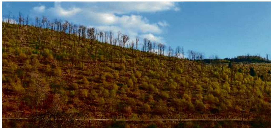
Blick auf den sechsjährigen Hauberg.

Birken kommen im Haubergsland in zwei Arten vor – als Hängebirke ( Betula pendula ) und als Moorbirke ( Betula pubescens ). Beides sind schnellwachsende Baumarten und können rund 25 bis 30 Meter hoch und etwa 80 bis 100 Jahre alt werden. Die beiden Arten benötigen unterschiedliche Standorte. Etwas später als die Birken fangen auch Rot- und Hainbuche, Bergahorn, Faulbaum und Eberesche