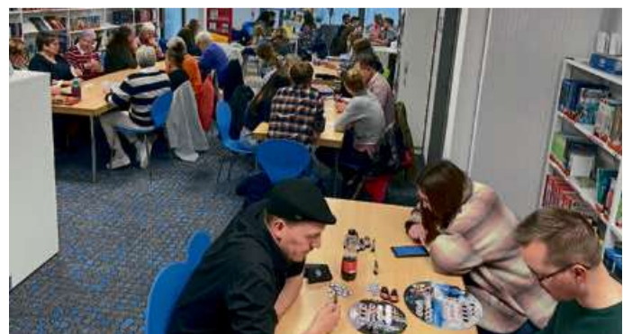
Erfreut sich großer Beliebtheit: der Spieleabend in der Stadtbücherei.

In den Räumlichkeiten der Touristinfo führt der Geschichtszähler ab 19 Uhr wieder durch ein paar Runden des Großgruppenspiels „Blood on the Clocktower“. Angeboten werden parallel zwei Runden mit Plätzen für bis zu 15 Spielern. Für die Teilnahme ist keine vorherige Anmeldung erforderlich.