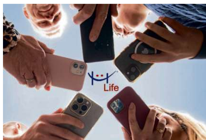
Erfreut sich großer Beliebtheit: die Stadtapp „HaigerLife“.