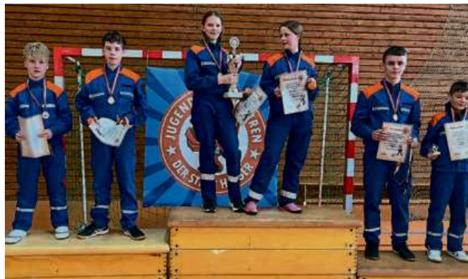
Die Sieger freuten sich über Medaillen und den Wanderpokal.

Bei der Veranstaltung mussten die Jugendfeuerwehren ihre Schnelligkeit und Geschicklichkeit rund um das Feuerwehrgeschehen in einem Parcours unter Beweis stellen. Alle Teilnehmer erhielten eine Urkunde und ein kleines Präsent, die Sieger wurden mit einer Medaille und die