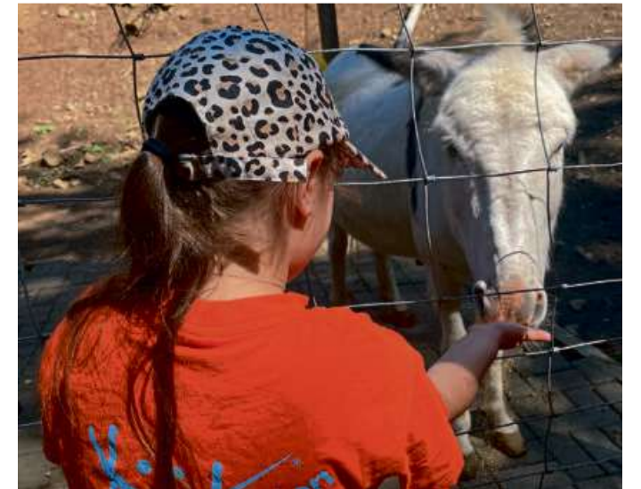
Der Tierparkbesuch erfreut sich großer Beliebtheit.

Die Stadt Haiger bedankt sich bei allen teilnehmenden Vereinen, Privatpersonen und Unternehmen für ihr Engagement und die kreativen Ideen, die die Sommerferien der Kinder aus Haiger und den Stadtteilen unvergesslich machen. Das Programm wird finanziell von der Sparkasse Dillenburg unterstützt.