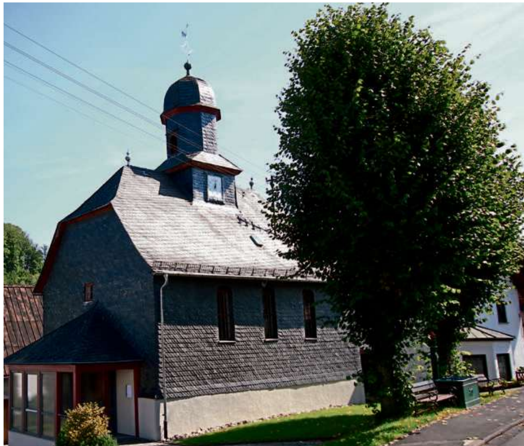
Die evangelische Kirche in Dillbrecht.

Ev. Kirche Langenaubach und Flammersbach Gottesdienste: Sonntag, 26.4.: