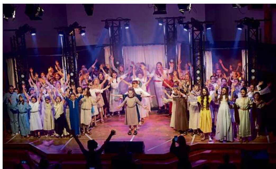
Die Freude, mit der die Darsteller die Musicals auf die Bühne brachten, übertrug sich spürbar auf die Zuschauer.