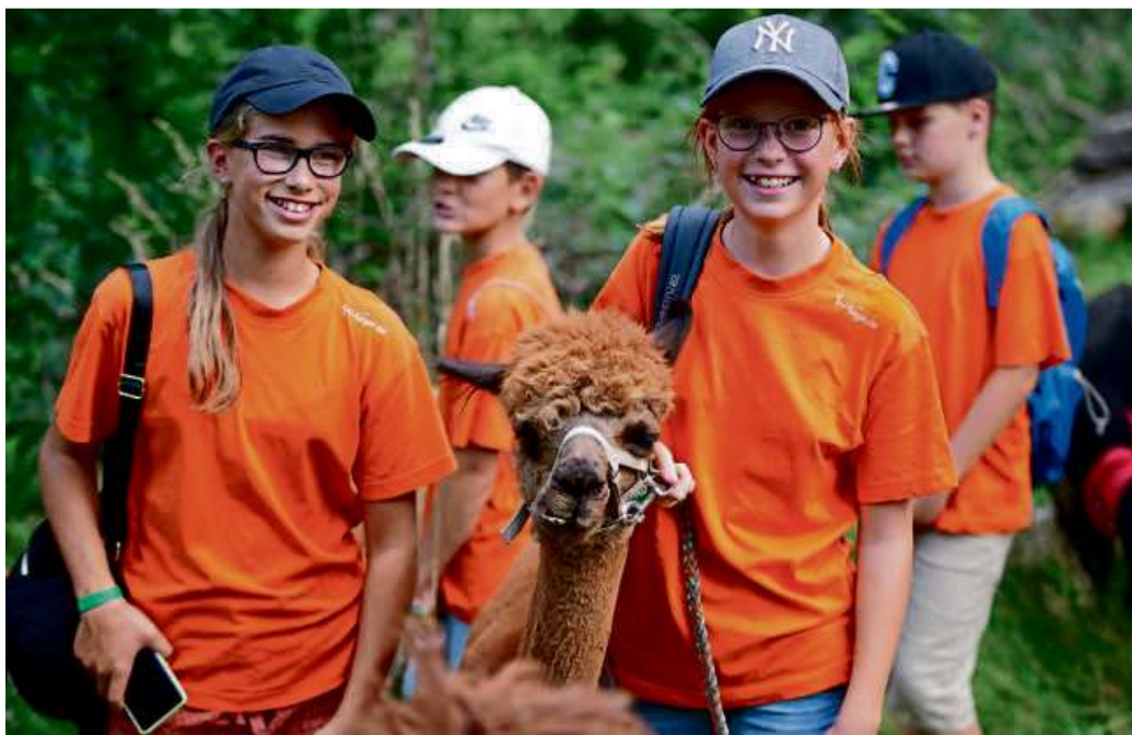
Vom 29. Juni bis zum 9. August gibt es ein buntes Ferienpassprogramm. In diesem Jahr erneut dabei: eine Tour mit den Haigertal-Alpakas

HAIGER (öah/lea) – Wieso ist das Polizei-Blaulicht blau? Eis herstellen wie ein waschechter „Gelatiere“ oder beim Taekwondo die schnellsten Kicks lernen? Beim Ferienpass der Stadt Haiger gibt es in diesem Jahr über 100 spannende Aktivitäten, die jede Menge Spaß in den Sommerferien versprechen. Vom 29. Juni bis zum 9. August wird sechs Wochen lang ein buntes Programm für die Altersgruppen 6 Monate bis 18 Jahre geboten – da kommt keine Langeweile auf! Anmeldungen für den traditionellen Ferienpass der Stadtverwaltung sind ab dem 4. Mai (Montag, 12 Uhr) über die städtische Internetseite www.haiger.de (Freizeit & Tourismus-Ferienprogramm) – möglich.