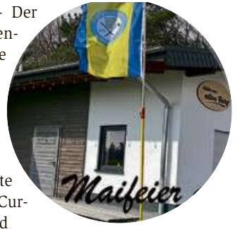
Start ist um 11 Uhr.

Am Freitag ab 11 Uhr ist die Hütte geöffnet, zu Mittag gibt es Burger, Currywurst mit Brötchen, kalte und warme Getränke und am Nachmittag ab etwa 14 Uhr Kaffee und Kuchen und Waffeln.