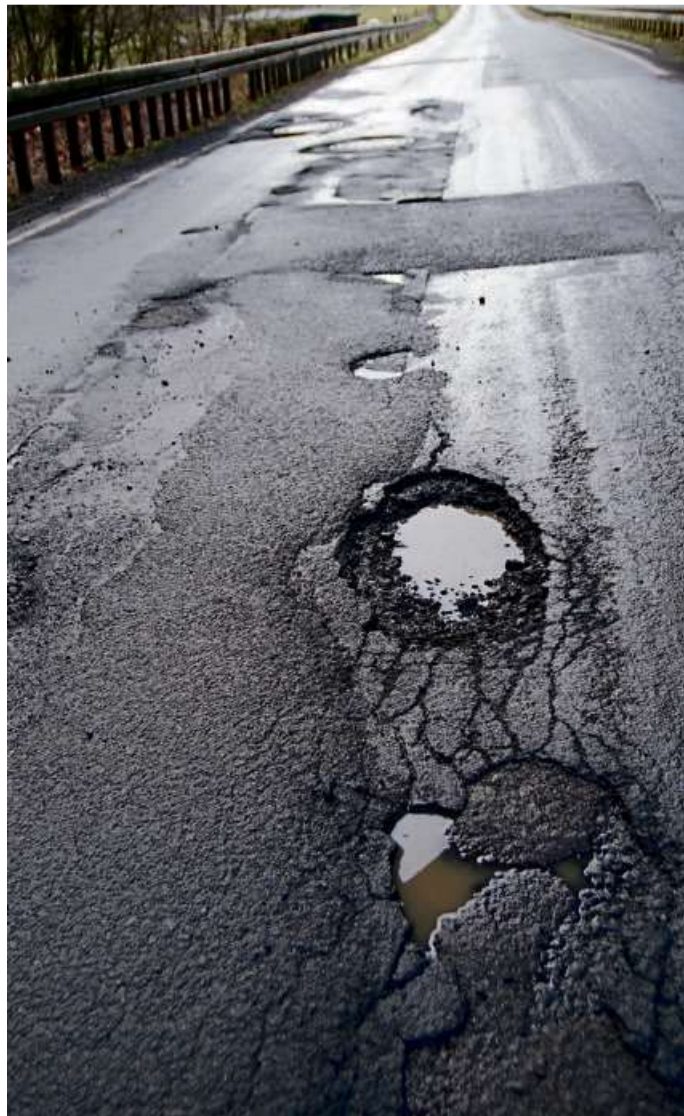
Die Schlaglöcher sollen bald der Vergangenheit angehören.

Eine Umleitung wird ausgeschildert und führt in beide Richtungen über die L 3044 und die L 3442 über Weidelbach. Das Lkw-Durchfahrtsverbot auf der L 3044 wird ab dem Abzweig nach