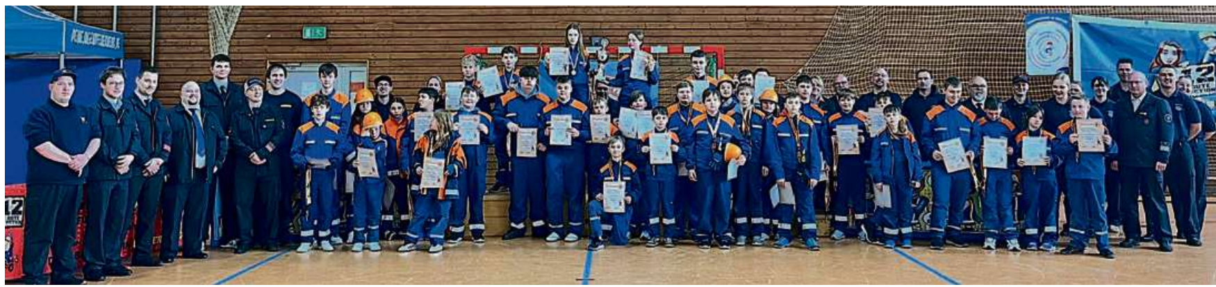
Mittlerweile fest im jährlichen Veranstaltungsprogramm der Haigerer Jugendfeuerwehren verankert: das traditionelle „Spiel ohne Grenzen“ in der Willi-Thielmann-Halle Sechshelden.