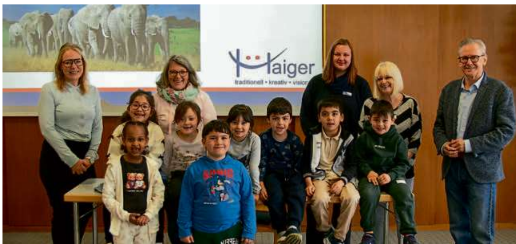
Acht Vorschulkinder der Kita Bahnhofstraße besuchten die Fotoausstellung „Kinderrechte“ und stellten Bürgermeister Mario Schramm Fragen.

HAIGER (öah/lea) – Egal, welche Hautfarbe, Religion oder Herkunft ein Kind hat – alle haben dieselben Rechte. Dem wichtigen Thema „Kinderrechte“ widmet sich die aktuelle Fotoausstellung im Rathaus der Stadt Haiger. Noch bis zum 15. Mai können die Bilder bestaunt werden: Sie setzen Kinderrechte auf kreative und liebevolle Weise in Szene. Vor Kurzem war die Kindertageseinrichtung Bahnhofstraße in Haiger zu Besuch, um den Bürgermeister kennenzulernen und die Ausstellung zu besichtigen.