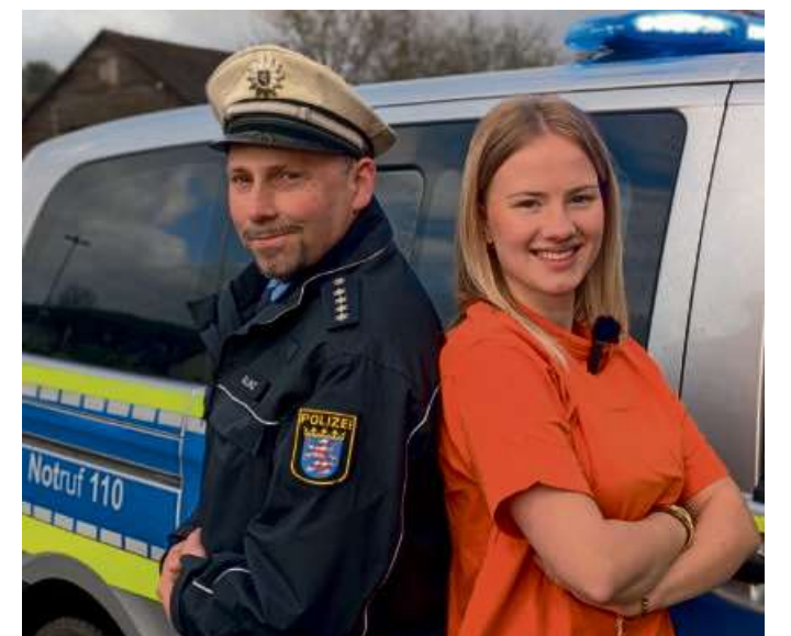
Die Polizei ist bei der diesjährigen Ferienpassaktion ebenfalls mit von der Partie.