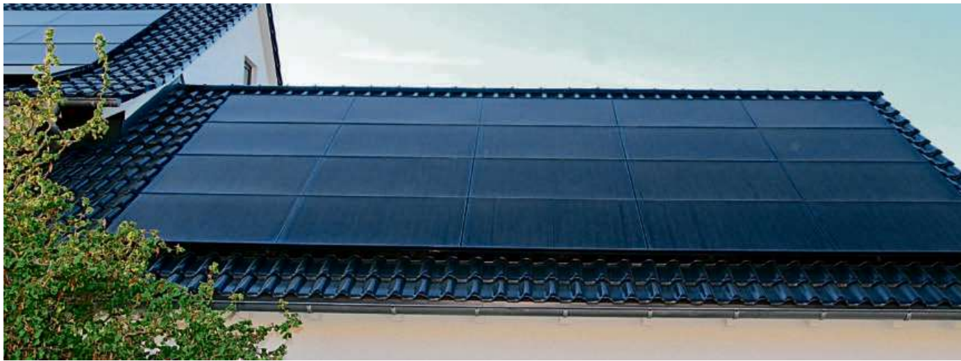
Nicht für alle Solaranlagen muss ein Bauantrag gestellt werden. Der „Quick-Check“, der jetzt auf der Haigerer Homepage zu finden ist, gibt eine erste rechtsunverbindliche Auskunft.

HAIGER (öah/rst) – Egal ob Carport, Solaranlage oder Gartenhaus – für viele Bürgerinnen und Bürger in Haiger stellt sich bei geringfügigen Bauvorhaben die Frage, ob eine Baugenehmigung oder Bauanzeige notwendig ist oder nicht. Um das künftig schnell und einfach zu ermitteln, hat das Hessische Ministerium für Wirtschaft, Energie, Verkehr, Wohnen und ländlichen Raum (HMWVW) gemeinsam mit Kommunen, Landkreisen und dem Unternehmen „effect data solutions“ den „Quick-Check Bauantrag“ entwickelt. Dieser kann seit wenigen Tagen auch über die Homepage der Stadt genutzt werden.