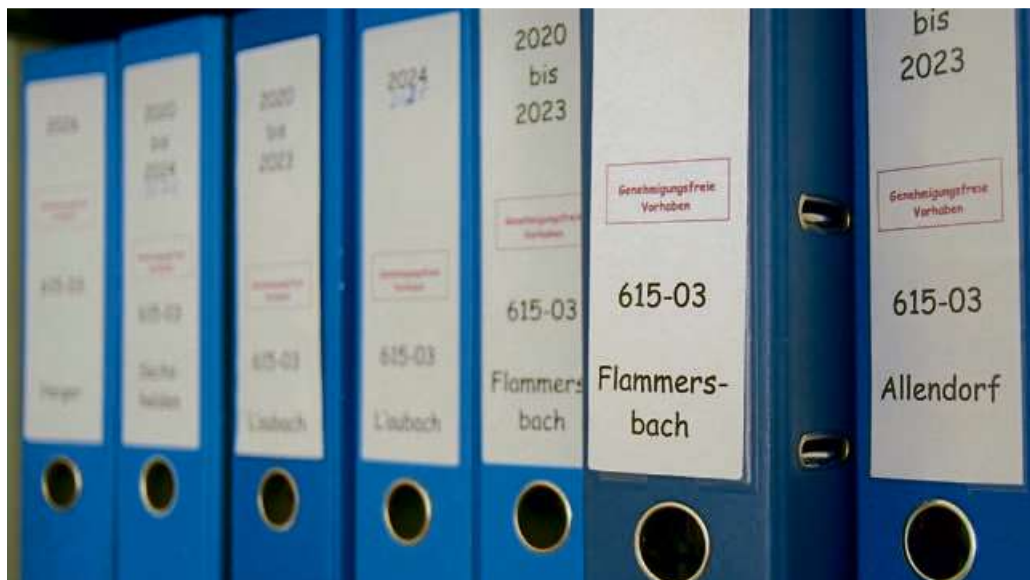
Für viele Bauvorhaben muss kein Antrag gestellt werden. Manche genehmigungsfreien Vorhaben müssen allerdings bei der Stadt angezeigt werden.

„Das ist ein weiterer Schritt von Bürokratieabbau. Wir sind überzeugt, dass diese Option vielen interessierten Bauherren helfen wird“, sagt Bürgermeister Mario Schramm und ruft dazu auf, die Möglichkeiten des „Schnell-Checks“ zu nutzen. Er ist unter https://www.haiger.de/rathaus-politik/baustadtentwicklung/ auf der städtischen Internetseite zu finden. Der Quick-Check Bauantrag ist