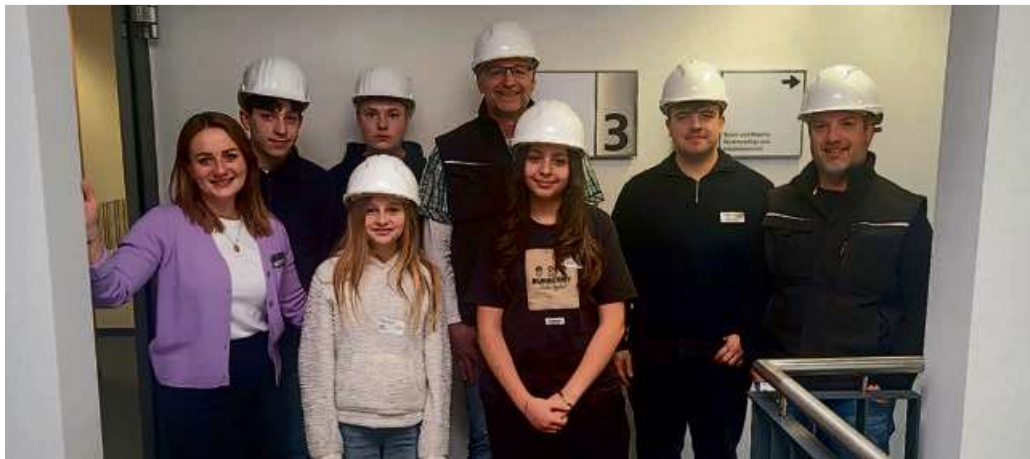
Unterwegs mit Baukontrolleuren erkundete eine Gruppe aus Jungen und Mädchen die Aufgaben in der Bauaufsicht.