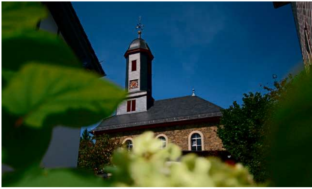
Evangelische Kirche Sechshelden.

Lighthouse Haiger Gottesdienste: Sonntag: Ankommen 10 Uhr, 10.30 Uhr Beginn, Stadion Haarwasen; Kinderkirche Freie ev. Gemeinde Haiger (FeG - Hickenweg 34): Sonntag: 10 Uhr Gottesdienst mit Kindergottesdienst. Mo: 17 Uhr Jungschar; 15.30-17 Uhr „Spielekiste“ (3-6 Jahre, 1. u. 3. im Mon.). Di: 19 Uhr Kreis junger Erwachsener. Mi: 15 Uhr Bibel im Gespräch. Donnerstag (Himmelfahrt): 10 Uhr Wandergottesdienst (Treffpunkt: Gemeindehaus) mit anschließendem Grillen