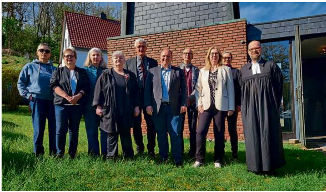
Den ökumenischen Gottesdienst in Langenaubach sowie die Veranstaltungen zur „Woche der Arbeit“ hatten die Gewerkschaften DGB, GEW, IG Metall und Ver.di zusammen mit dem Evangelischen Dekanat an der Dill, der Regionalen Diakonie Dillenburg-Limburg, der Katholischen Kirchengemeinde „Zum Guten Hirten“, der Arbeiterwohlfahrt (AWO), dem Johanneum Gymnasium und der Stadt Herborn vorbereitet.