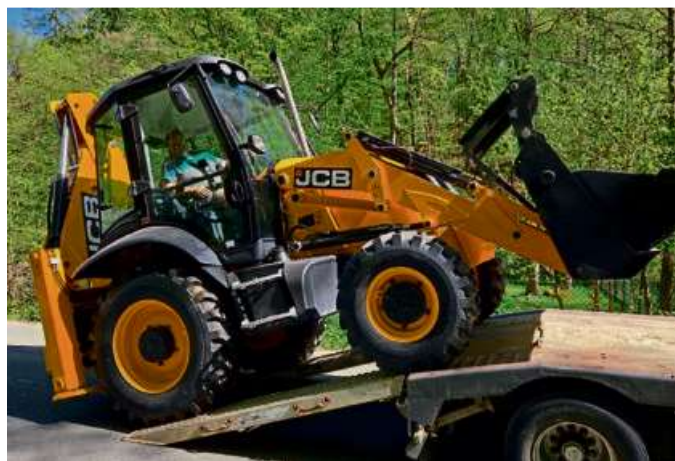
Der Multifunktionsradlader für den Wiederaufbau in der Ukraine.