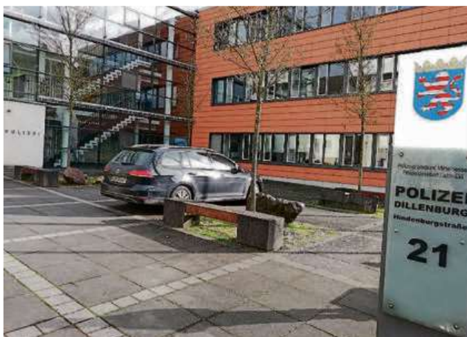
Für den 21. Mai steht ein Besuch der Polizeistation Dillenburg auf dem Programm.

Die Reihe „Betriebsbesuche“ der Evangelischen Kirche widmet sich dem Thema Sicherheit