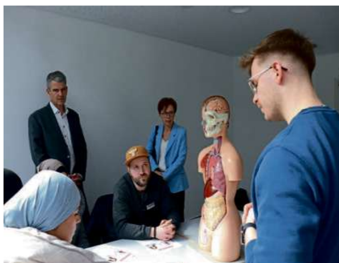
Im Bildungszentrum für Gesundheitsfachberufe in Wetzlar sowie in den Lahn-Dill-Kliniken lernten die Teilnehmenden Ausbildungswege im Gesundheitswesen kennen.