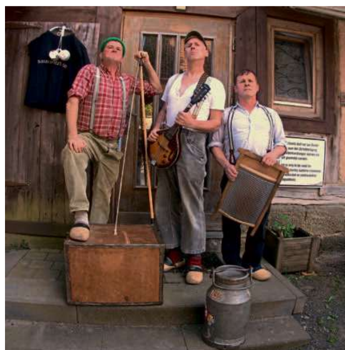
Am Rathaus-Brunnen spielen ab 13 Uhr „Die Rhöner Säuwäntzt“, die bereits bei den vorherigen Mundart-Festivals in Eschenburg zu begeistern wussten.

Weitere Informationen zu der Veranstaltung gibt es über die Seite www.mundart-hessen.de/festival im Internet.