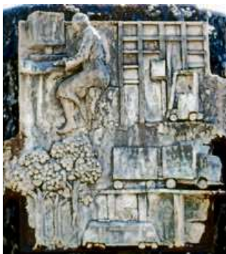
Die Platten des Marktplatzbrunnens bergen viele Geheimnisse.

HAIGER (red) – „Auf Entdeckungsreise mit dem QR-Code“ lautet das Motto einer Veranstaltung des Projekts HaiDigital. Am 20. Mai (Mittwoch, 15 Uhr) treffen sich alle Interessierten zu einer Entdeckungsreise durch Haiger - wobei sie von QR-Codes unterstützt und geleitet werden.