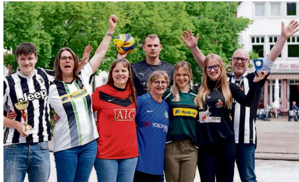
Am 13. Mai dürfen auch in den Büros Trikots getragen werden.

auf eine Mitarbeiterin oder einen Mitarbeiter trifft, der stolz sein Vereinstrikot präsentiert. Gemeinsam mit dem Landessportbund Hessen und dem Sportkreis Lahn-Dill ruft der Lahn-Dill-Kreis zum Mitmachen beim bundesweiten #Trikottag am Dienstag auf. „Wir laden an diesem Tag die über 100.000 Sportvereinsmitglieder im Lahn-Dill-Kreis dazu ein, Flagge für ihren Verein zu zeigen – ganz einfach, indem sie ihr Vereinstrikot, ihr Vereinsshirt oder ihre Trainingsjacke überstreifen und die Farben des eigenen Vereins stolz präsentieren“, sagt Landrat Carsten Braun und betont: „Sportvereine sind ein wertvoller Teil unserer Gesellschaft. Sie verbinden Menschen, fördern Gesundheit, vermitteln Werte und leisten einen wichtigen Beitrag zu Integration und Inklusion. Am Trikottag wollen wir ihre Arbeit feiern und sichtbar machen.“ Ziel ist, zu zeigen, wie vielfältig der Vereinssport ist, wie viele Menschen er erreicht und auch, welche wichtigen gesellschaftli-