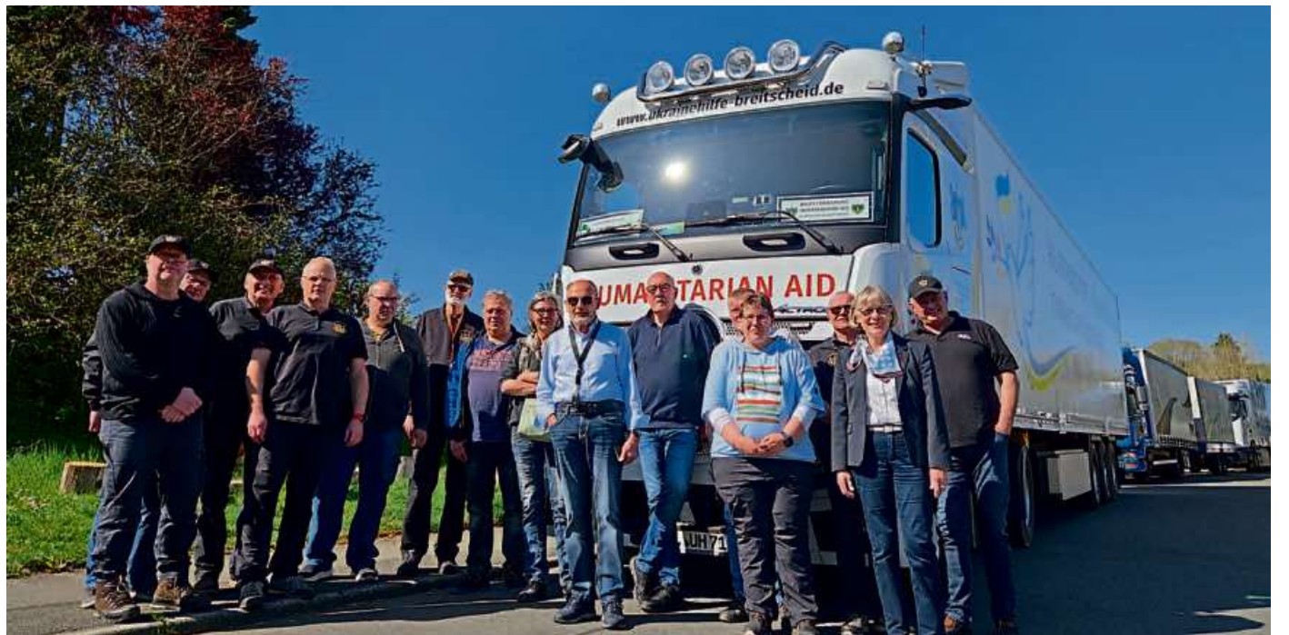
Den Transport übernahm die Ukrainehilfe Breitscheid, St. Laurentius Gemeinschaft.

Ziel ist es, die Zusammenarbeit zwischen deutschen und ukrainischen Kommunen zu stärken