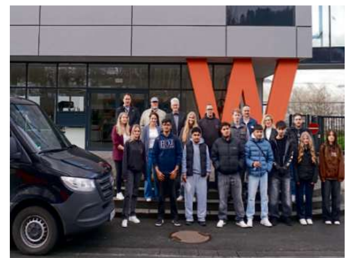
Rund 20 junge Erwachsene im Alter zwischen 17 und 25 Jahren aus dem Lahn-Dill-Kreis sammelten ihre Erfahrungen direkt vor Ort.

Im Bereich Industrie standen Besuche bei der Weber GmbH & Co. KG Kunststofftechnik, Formenbau sowie bei Klingspor