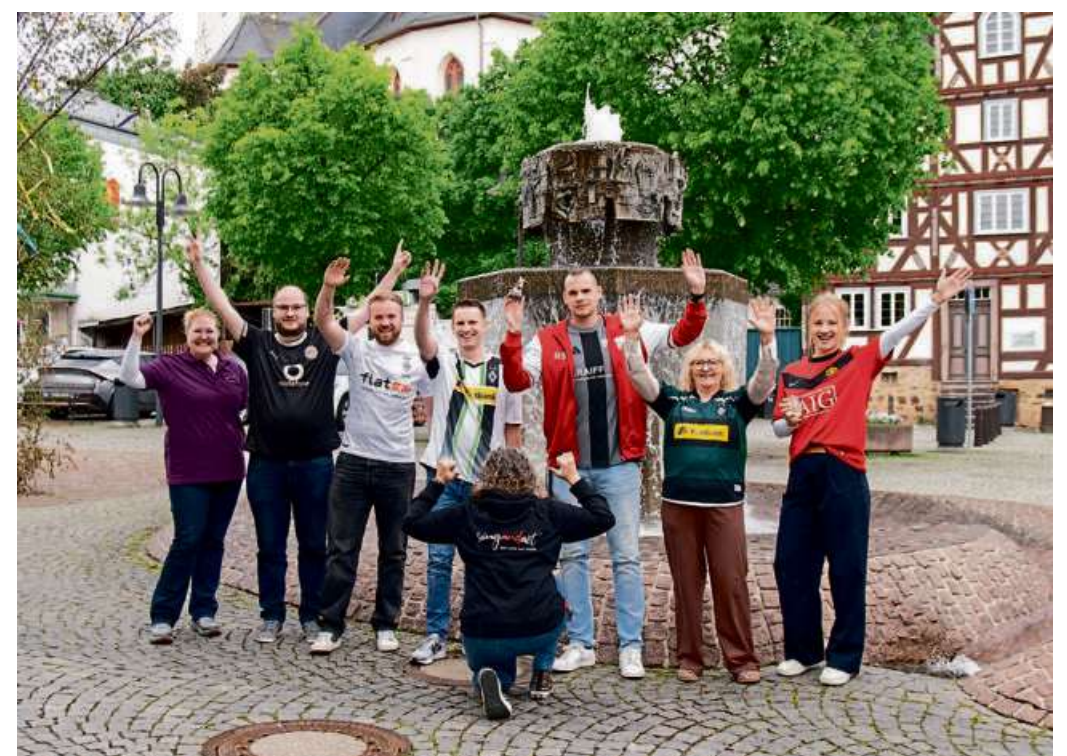
Mitarbeiter der Stadtverwaltung warben am Trikottag für „ihren“ Verein – ganz gleich ob Fußballclub oder Chor.