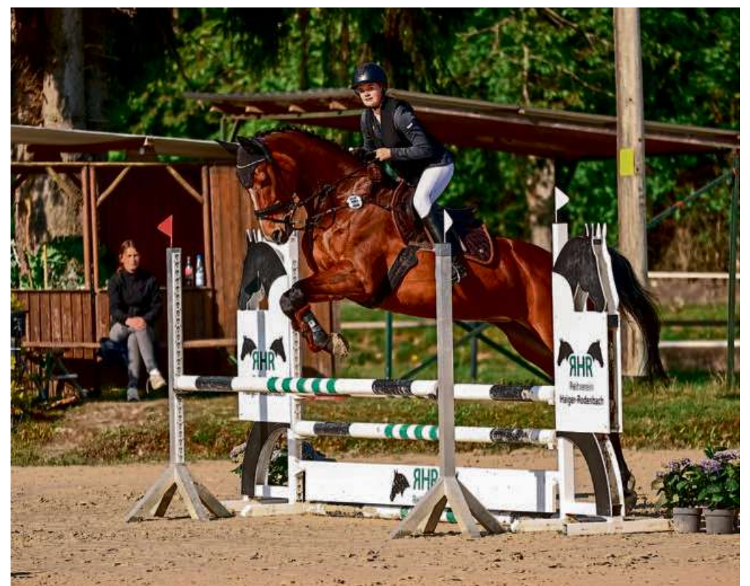
Die Springreiter fanden in Rodenbach hervorragende Bedingungen vor.