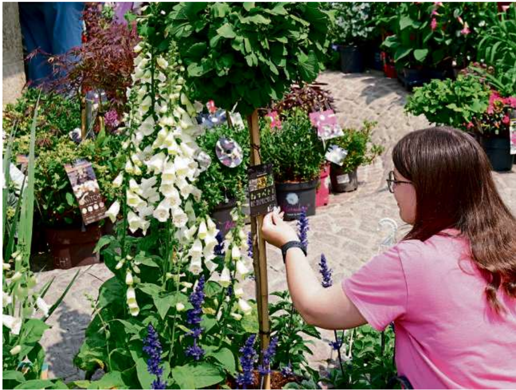
Der Haigerer Marktplatz wird am Pfingstmontag wieder blühen – die Organisatoren rechnen mit vielen hundert Besuchern zum Blumen- und Kräutermarkt.