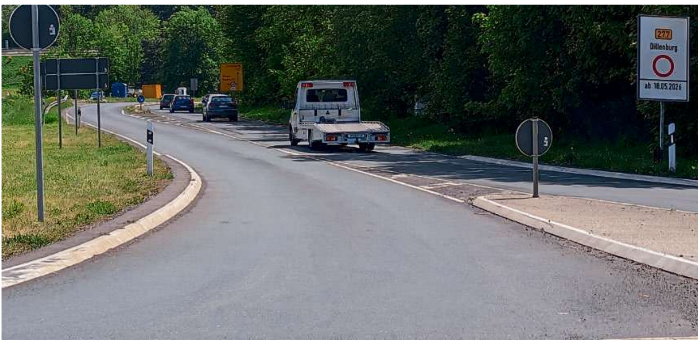
Die Sanierungsarbeiten auf der Bundesstraße 277 beginnen am Kreisverkehr in Höhe der Bäckerei Rothe.

Direkt im Anschluss folgt der zweite Bauabschnitt. In diesem wird die Fahrbahn von der Kreuzung K 43 bis zur Kreuzung Haiger-Allendorf zum Abzweig der L 1328/Burbach-Holzhausen erneuert. Zudem erneuert Hessen Mobil im Auftrag des Lahn-Dill-Kreises den Teil der K 43, der im Zuge der letzten Erneuerung in 2019 Richtung Haiger-Seelbach nicht erneuert wurde. Voraussichtlich Ende Juli soll der zweite Bauabschnitt abgeschlossen werden.