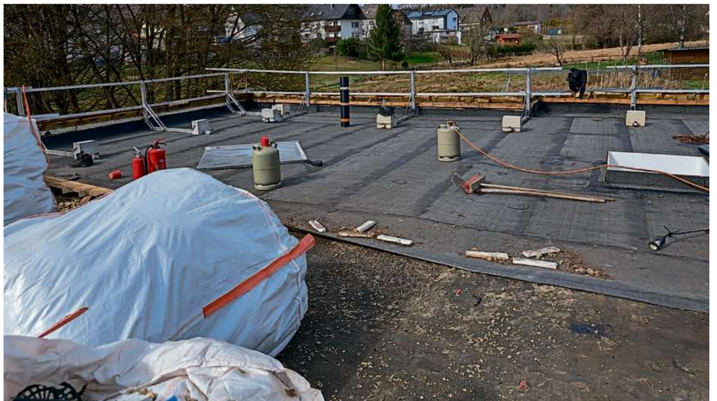
Die Arbeiten am Dach des Kindergartens in Weidelbach laufen seit einiger Zeit.