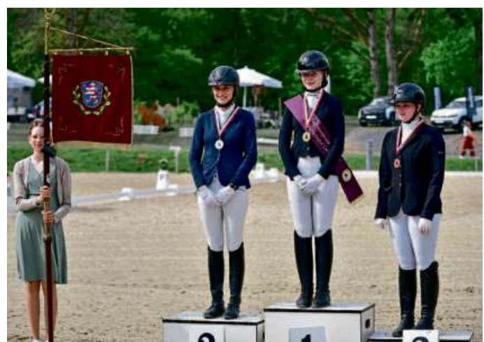
Siegerehrung in Rodenbach.

Mit der Meisterschaftskehrung des Bezirks Lahn-Dill fand die niveauvolle Veranstaltung auf dem schönen Turniergelände in Rodenbach ein gelungenes Ende.