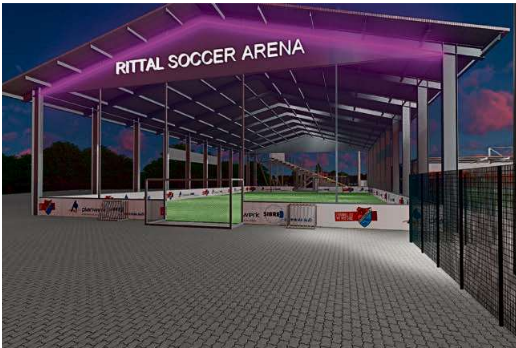
Die geplante Kleinfeld-Soccerhalle (40 x 21 Meter) soll noch in diesem Jahr gebaut werden und künftig vor allem den Jugendmannschaften des TSV Steinbach optimale Trainingsmöglichkeiten bieten. Aber auch Schüler dürfen die Anlage nutzen. Grafik: TSV Steinbach-Haiger

Darüber hinaus profitieren auch Haigerer Schulen von dem