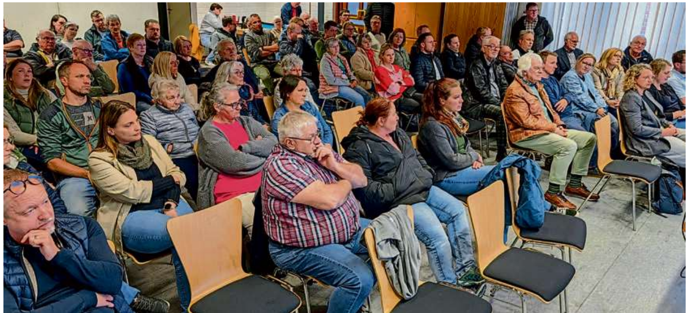
Die Infoveranstaltung zur Schule und dem Dillbrechter DGH war sehr gut besucht.

Für das Ganztagesprogramm ist eine Komplettsanierung des Schulhofs und des Spielplatzes vorgesehen, was sich der Kreis rund eine Million Euro kosten