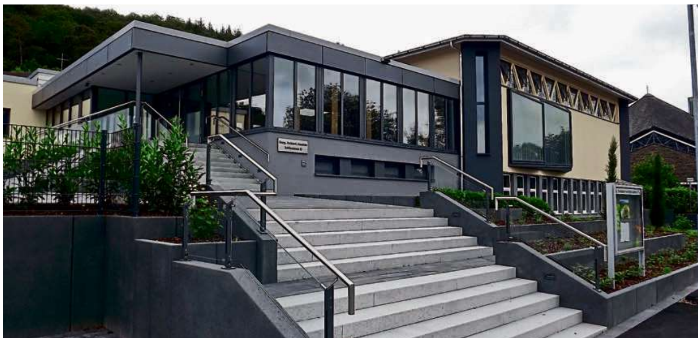
Die Evangelisch Freikirchliche Gemeinde Haiger (Schillerstraße).

Veranstaltungen der Kirchen und Gemeinden in Haiger und den Stadtteilen