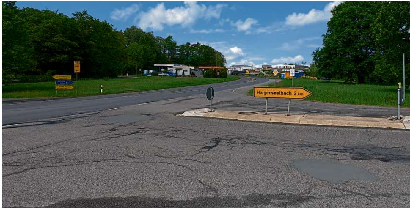
Im ersten Bauabschnitt enden die Arbeiten an der Kreisstraße K 43 (Abbiegung in Richtung Haigerseelbach). Die Zufahrt von der Kreisstraße zur Bundesstraße 277 in Fahrtrichtung Haiger bleibt zunächst offen.

Anschließend wird neuer Asphalt eingebaut. Zudem wird eine neue Linksabbiegespur angelegt für den zukünftigen Campus Kalteiche. Die Friedhelm Loh Group plant hier nach eigenen Angaben den neuen Sitz der Tochtergesellschaft Rittal Deutschland, ein „Innovation Center“ für Kunden und ein Hotel.