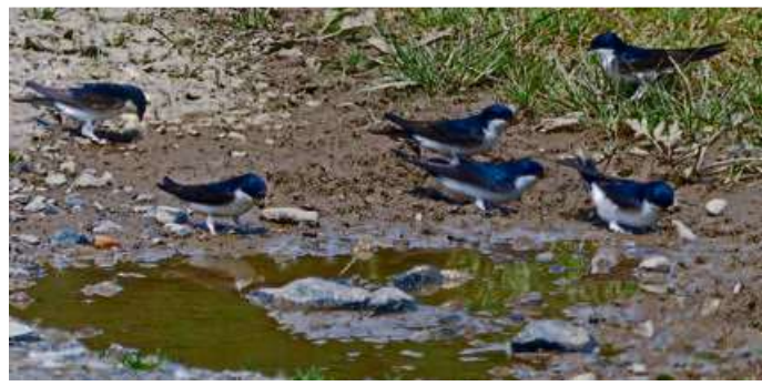
Reger Besuch von Mehlschwalben an dieser Lehmputze.

Lahn-Dill-Kreis stellt Ideen für Dillbrechter DGH vor – Neue Räume für die Schüler