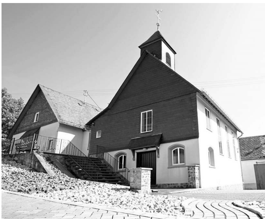
Die evangelische Kirche in Steinbach.