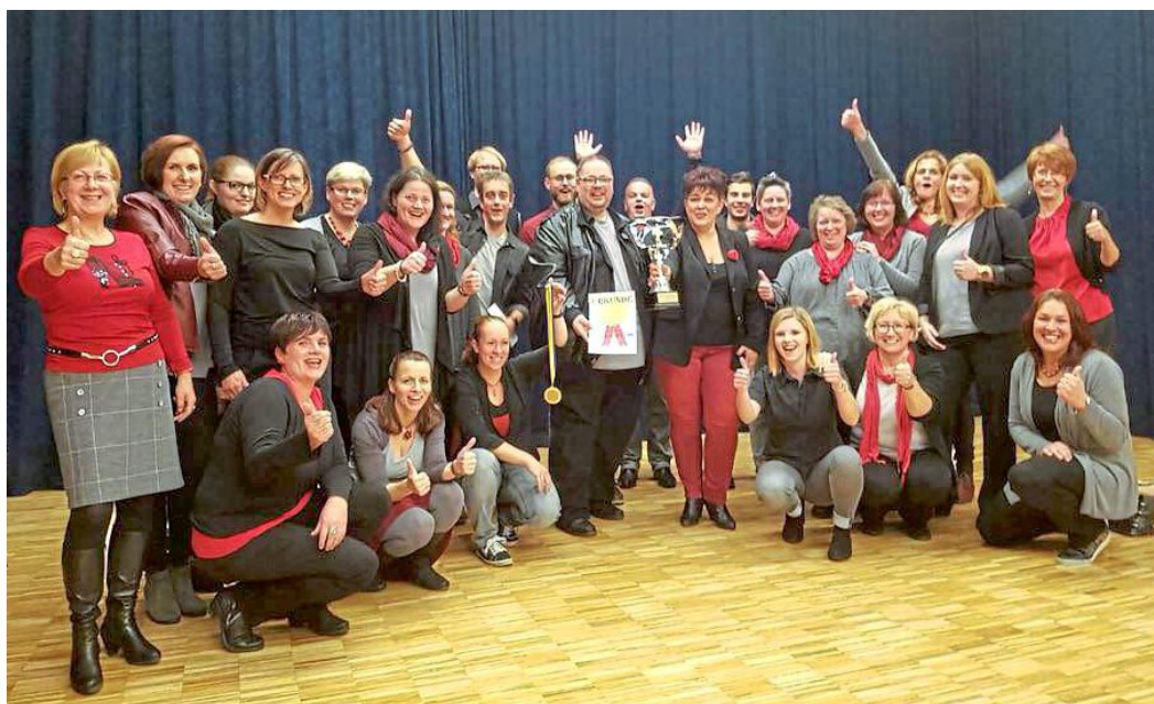
Der Haigerer Chor „Sing & Act“ hofft auf Unterstützung der Bevölkerung, um Haiger beim Hessentag in Korbach musikalisch vertreten zu dürfen.