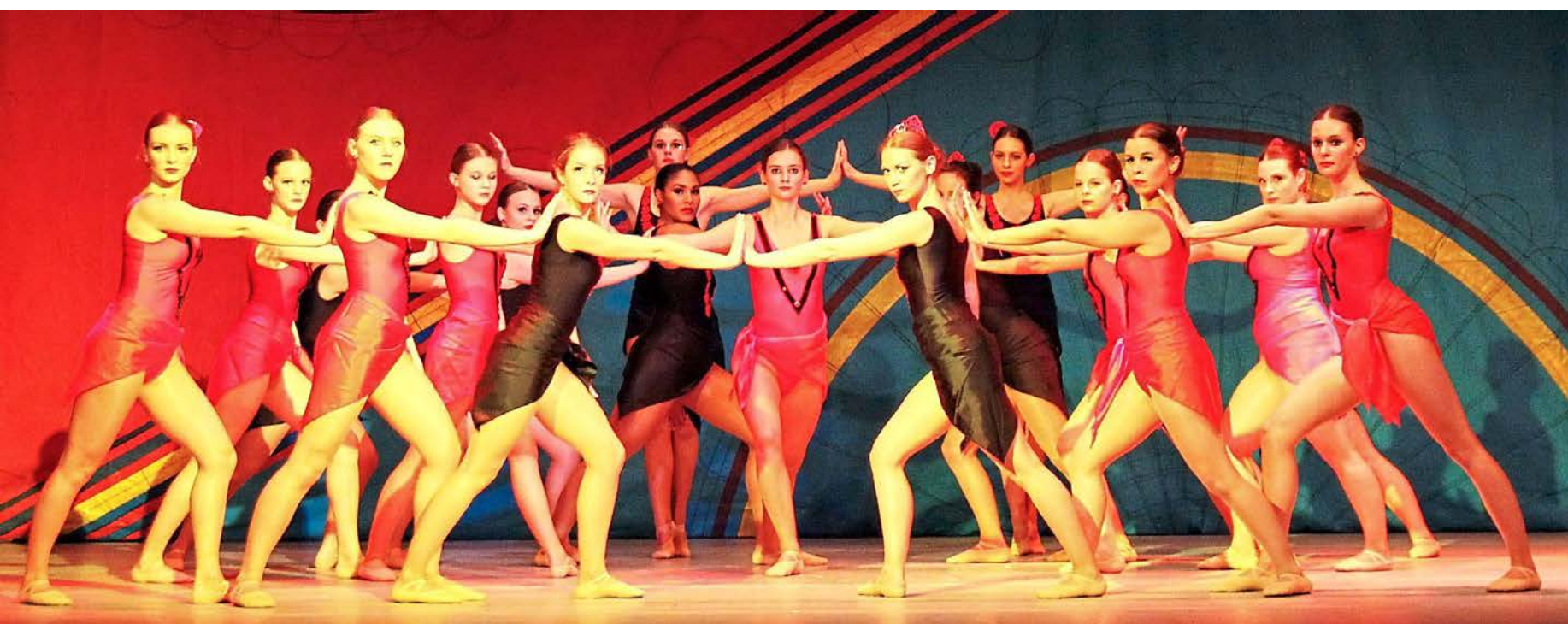
Bei den Ballettaufführungen in der Haigerer Stadthalle sind rund 50 Tänzerinnen im Alter zwischen 6 und 28 Jahren im Einsatz.