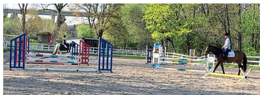
Auf der Reitanlage an der Schmidthütte können die Besucher viel über Pferde erfahren.

eine Metzgerei, um Kaffee und Kuchen kümmern sich das Team der Reitschule Haiger und die Eltern der Reitschulkinder.