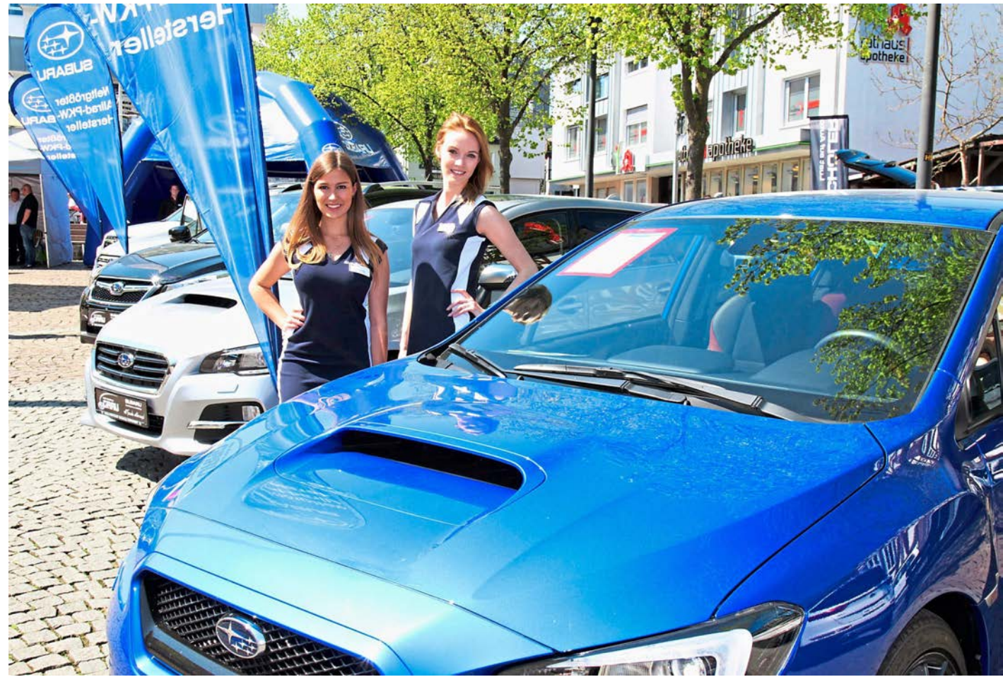
Frühlingszeit ist Autozeit. 21 Marken stellen ihre aktuellen Fahrzeuge vor.