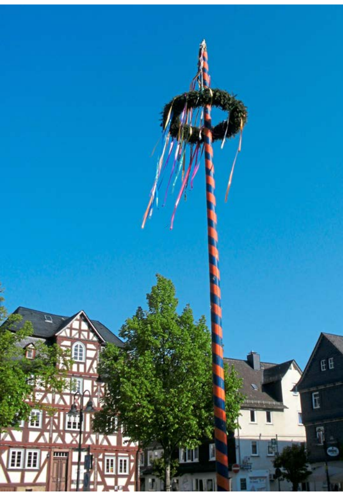
Der Maikranz wird ab Dienstag wieder über dem Haigerer Marktplatz wehen.