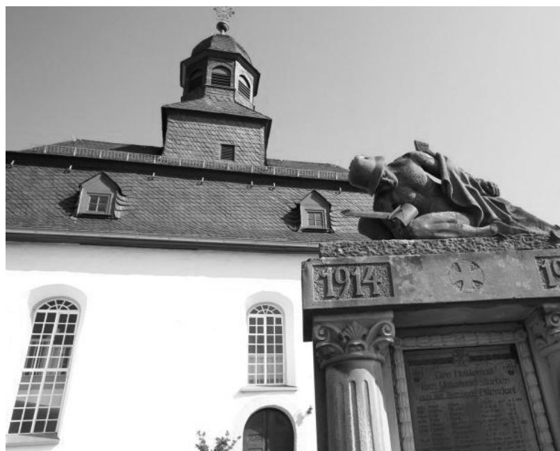
Die evangelische Kirche in Allendorf.

Niederroßbach: Sonntag, 29.07., 18 Uhr, Gottesdienst.