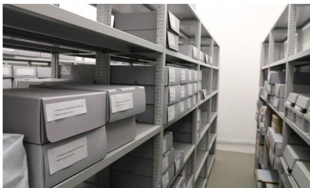
Mehrere hundert Regalmeter stehen dem Archiv zur Verfügung.

Wenn die Akten „aufbereitet“ sind, kann mit ihnen ge-