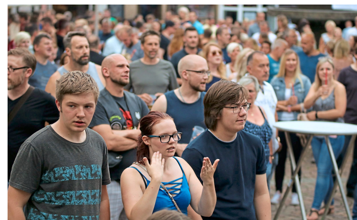
Schon zum Auftakt des Konzertes war der Marktplatz gut gefüllt.

In den nächsten Wochen folgen fünf weitere Bands: 3. August: Online; 10. August: „Open doors“; 17. August: Nightlife; 24. August: Jim Buttons. (öah/ke)