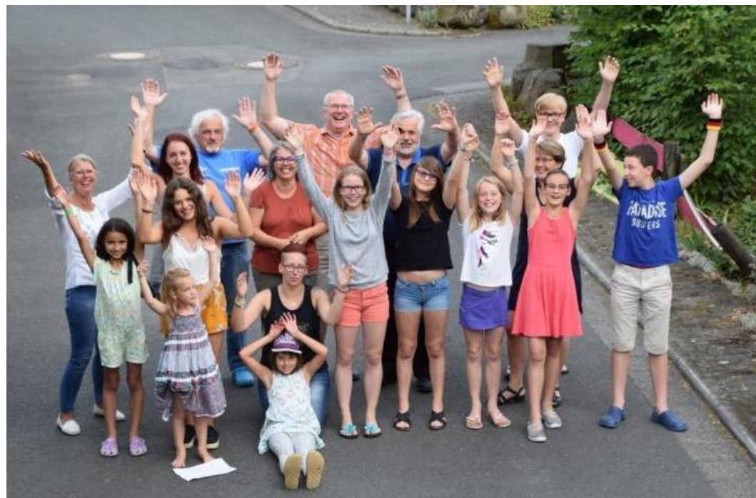
Jugend- und Kinderaustausch mit den Gästen aus der Partnergemeinde Plombières-les-Dijon.

Die Kinder lernten Sechshelden durch ein Geocache-Spiel mit mehreren Stationen an zentralen Punkten kennen. Auf dem Programm standen des Weiteren ein Besuch des Opel-Zoos in Kronberg / Ts., ein Tagesausflug in das Erlebnisbad „Aqua-Maris“ in Plettenberg/Sauerland, sowie das „Mathematikum“ in Gießen, in dem eine zweisprachige Einführung auf deutsch und französisch