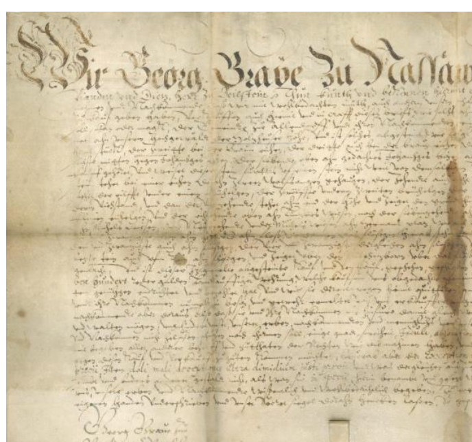
Aus dem Jahr 1607 stammt die älteste Urkunde im Haigerer Stadtarchiv. Damit wurde ein Landverkauf zwischen der damaligen Gemeinde Allendorf und dem Grafen von Nassau-Katzenellnbogen beurkundet.