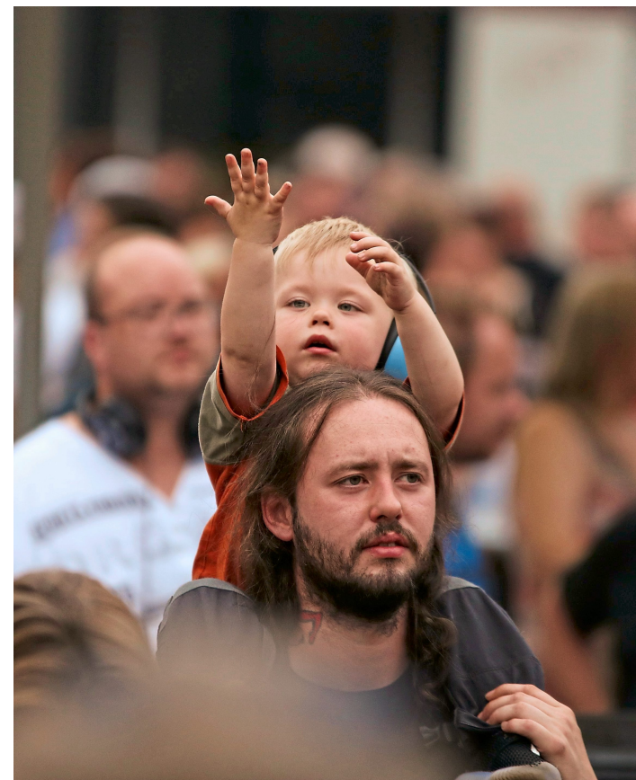
Das Konzert begeisterte Jung und Alt.