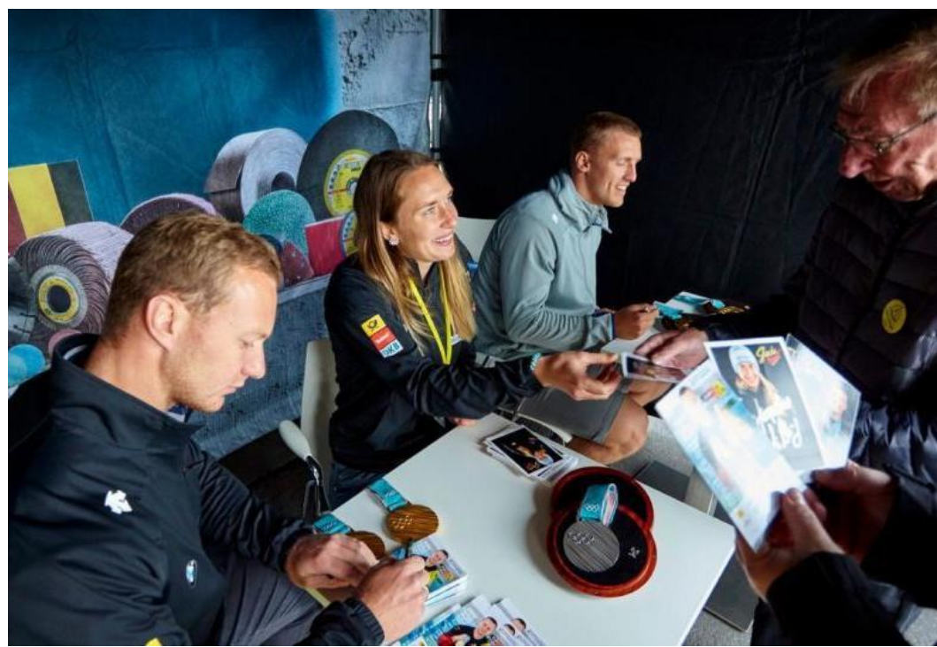
Hochkarätiger Besuch: Die Welt- und Europameister und Olympiasieger Francesco Friedrich, Jacqueline Lölling und Thorsten Margis (v.l.n.r.) verteilten fleißig Autogramme und präsentierten ihre Medaillen.

Ein Höhepunkt des Tages war der Stand des Bob- und Schlittenverbands für Deutschland (BSD), einem Kooperationspartner von Klingspor. Dort standen die Welt- und Europameister sowie Olympiasieger Francesco Friedrich, Thorsten Margis und Jacqueline Lölling für Autogramme zur Verfügung.