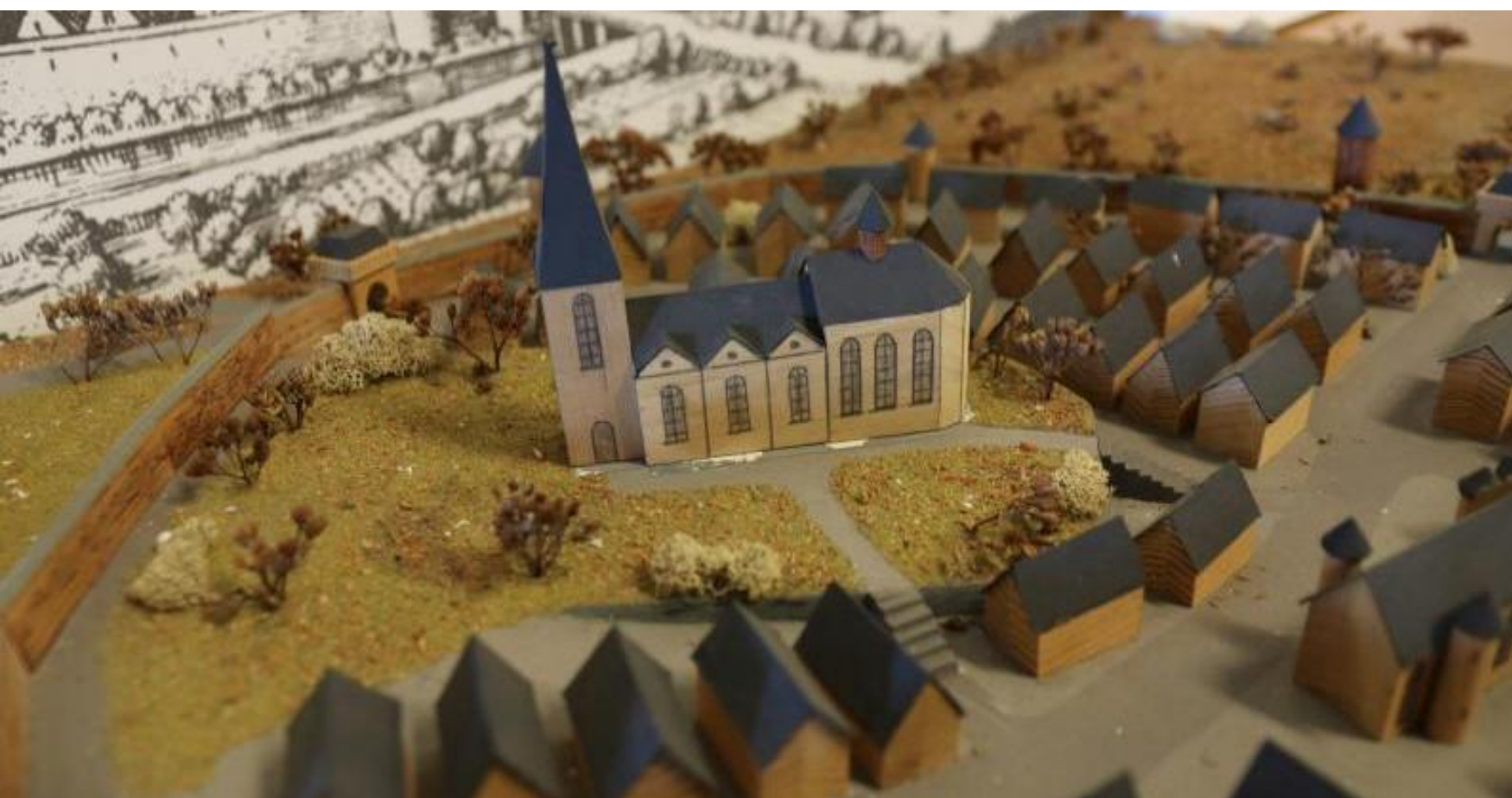
Ein Modell der Stadt Haiger mit Stadtmauer und Kirche gehört zu den interessantesten Bestandteilen des Archivs.