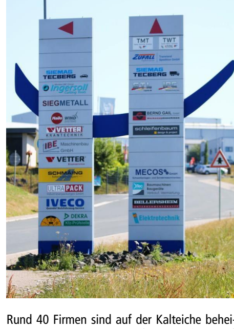
Rund 40 Firmen sind auf der Kalteiche beheimatet.