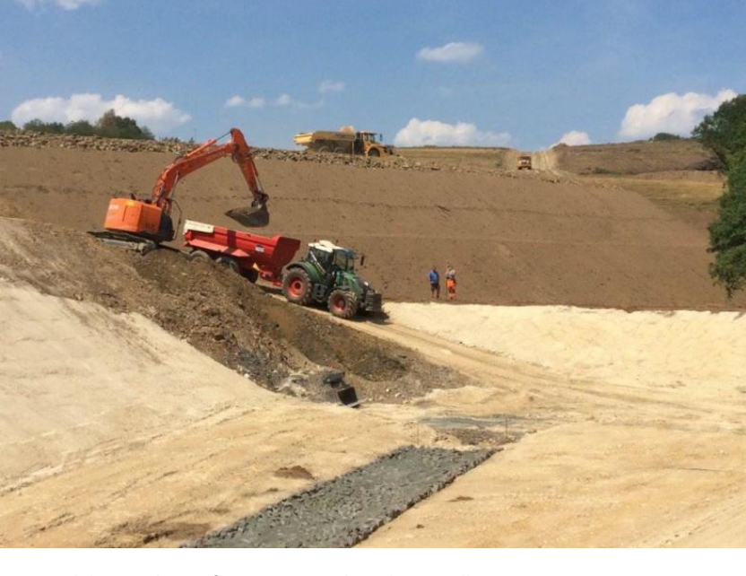
Am Rand der Bundesstraße 54/B277 sind mächtige Erdbewegungen im Gange.