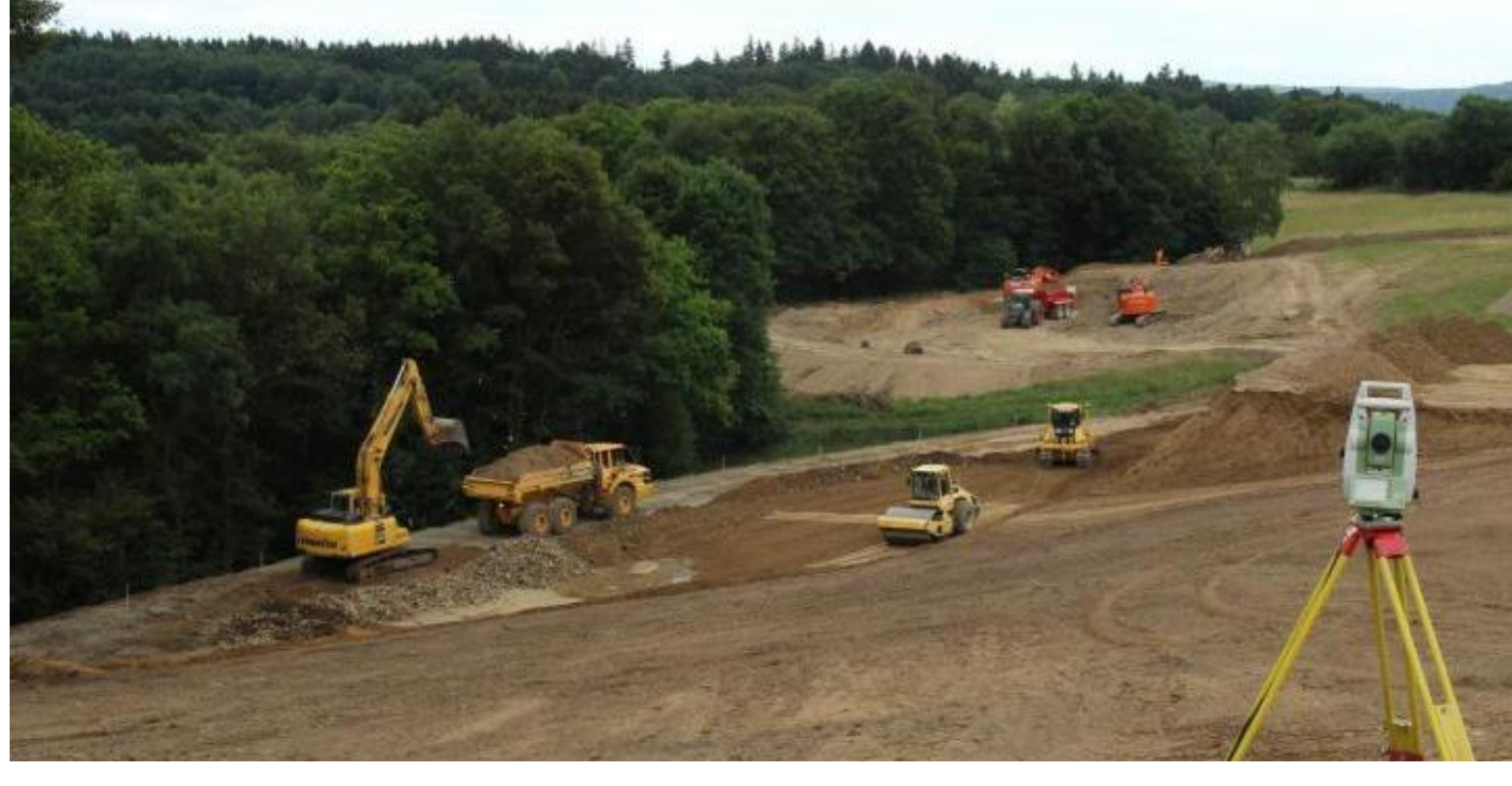
Viele tausend Kubikmeter Erde wurden in den vergangenen Wochen bewegt.

Die Haigerer Stadtverordnetenversammlung hat beschlossen, einen dritten Bauabschnitt zu entwickeln, dessen Erschließung derzeit läuft. „Die Arbeiten schreiten sehr zügig voran“, freut sich der Bauamts-