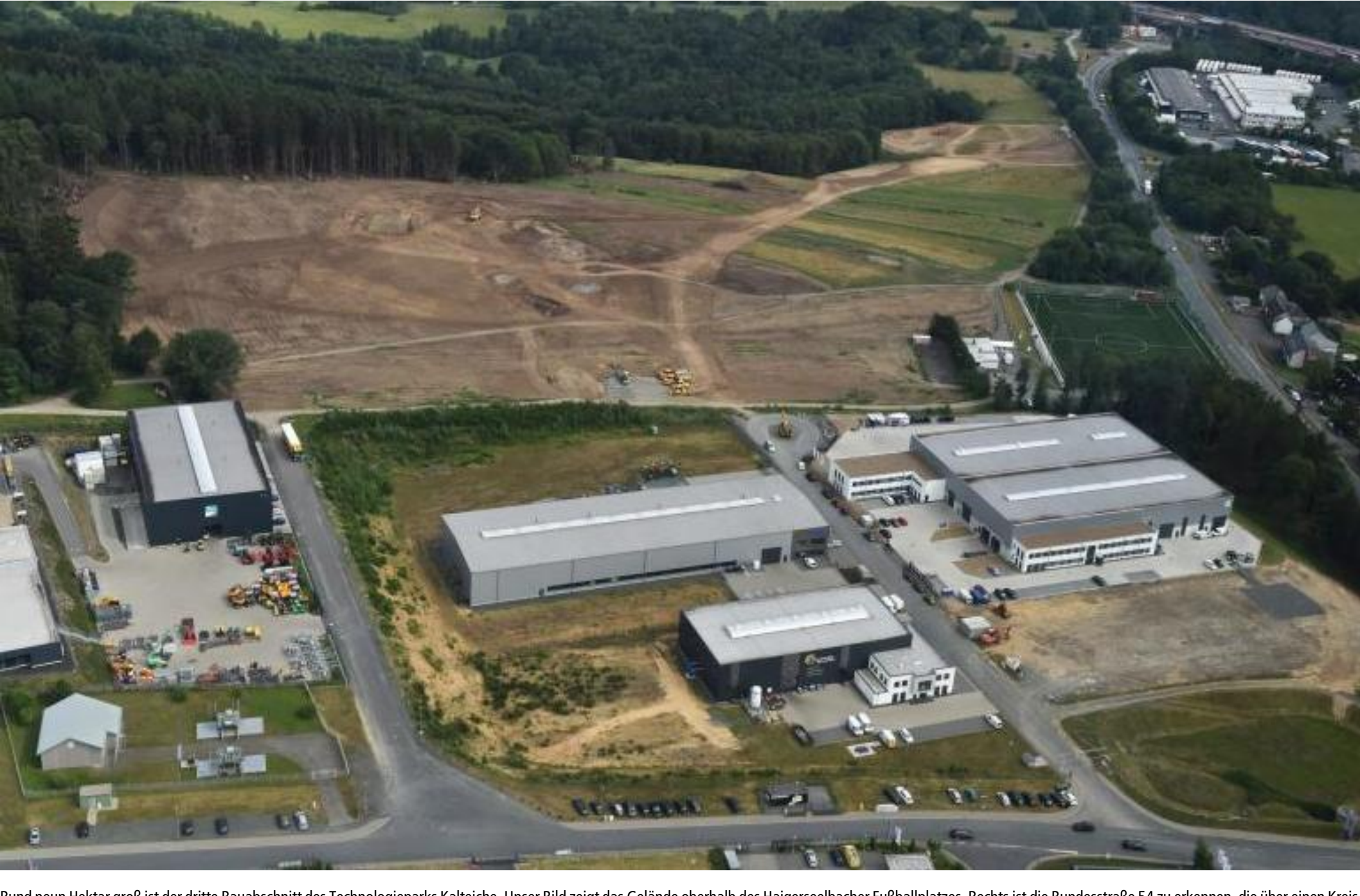
Rund neun Hektar groß ist der dritte Bauabschnitt des Technologieparks Kalteiche. Unser Bild zeigt das Gelände oberhalb des Haigerseelbacher Fußballplatzes. Rechts ist die Bundesstraße 54 zu erkennen, die über einen Kreisverkehr direkt mit dem Technologiepark verbunden wird.