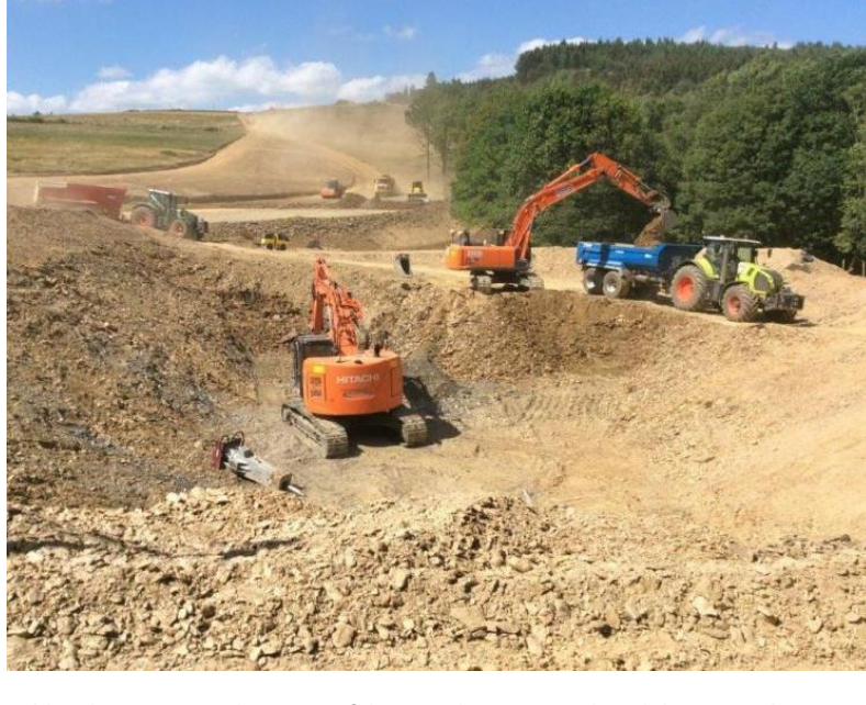
Zahlreiche Bagger und Transportfahrzeuge bewegen viele Kubikmeter Erde.