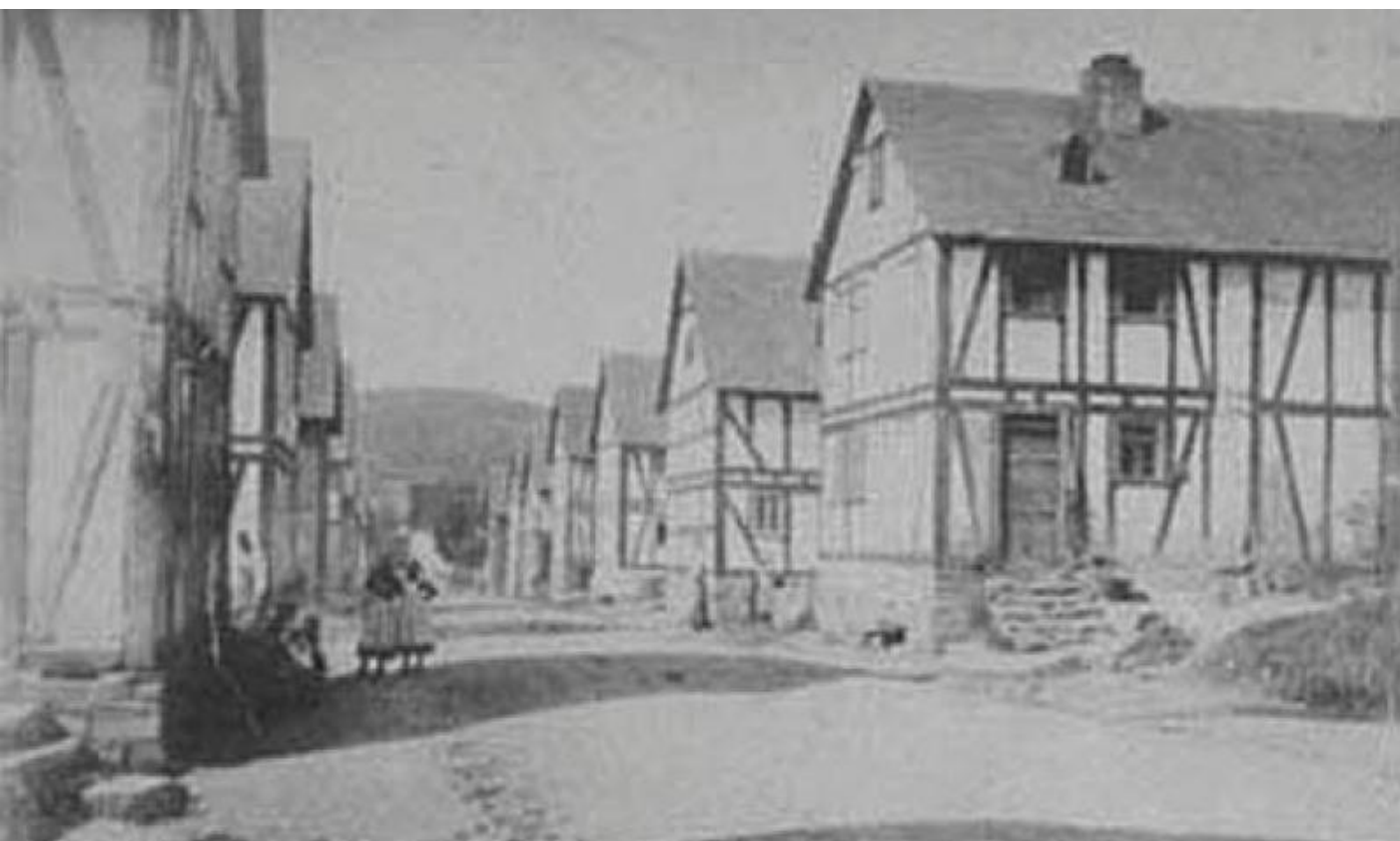
So sah die „Naue Straße“ etwa 60 Jahre nach dem verheerenden Feuer aus.