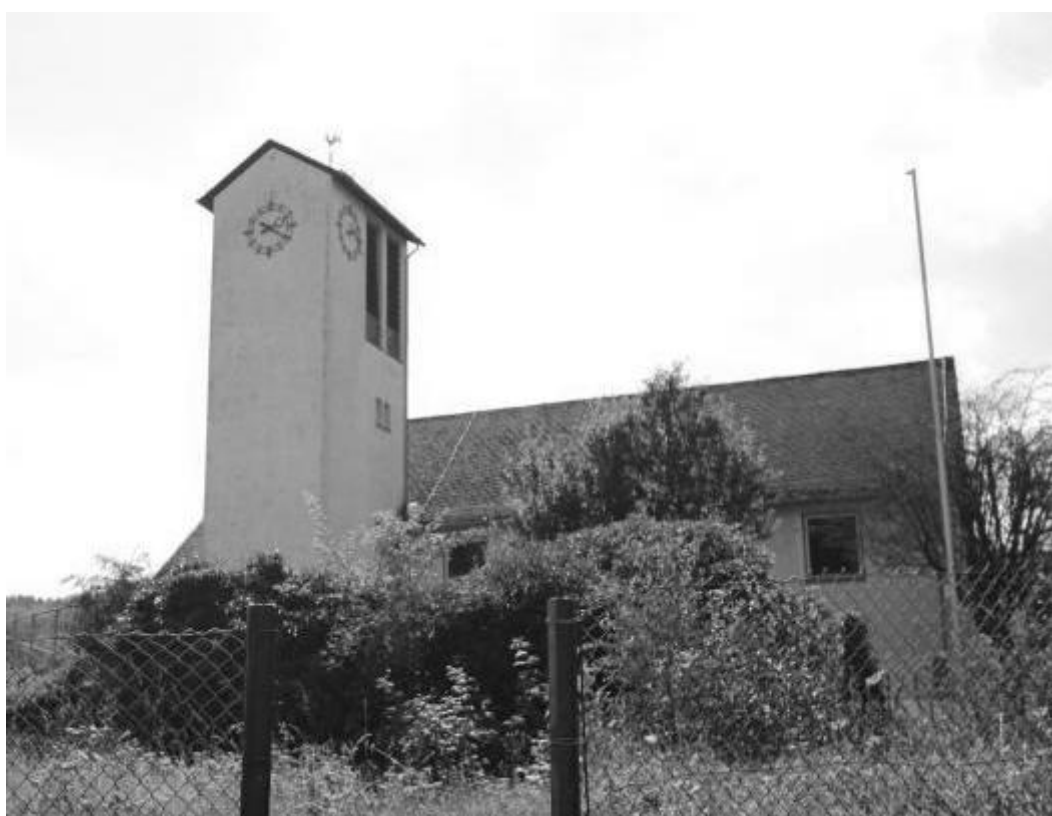
Die evangelische Kirche in Flammersbach.

Ev. Gemeinschaft und CVJM Langenaubach: Sonntags: 10.45 Uhr, Gottesdienst. Woche: Montags: 17.30 bis 18.45 Uhr, Jungschlar; 19 Uhr, Teenkreis; 19.30 Uhr,