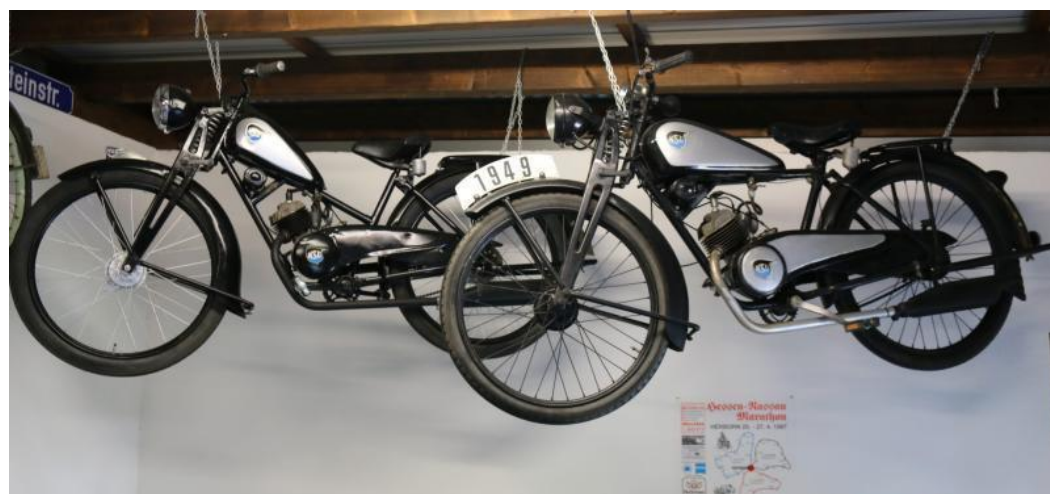
Unterm Dach hängen einträchtig nebeneinander: Eine Damen- und eine Herren-Quickly.