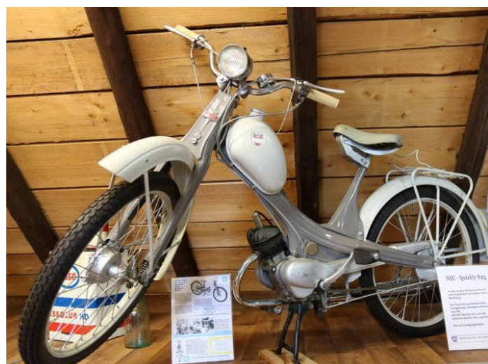
Das Motorrad des kleinen Mannes: Die „Quickly“ wurde rund 1,5 Millionen Mal gebaut.

er ausreichend Geld gespart hat, dann wird die Sammlung vergrößert. Und dafür fährt er schon mal nach Bayern oder nach Holland. Und wenn er in Urlaub ist, erkundigt er sich sofort, ob in der Gegend vielleicht früher mal ein NSU-Händler existierte. Wenn er diesen gefunden hat, kauft er oft im großen Stil alles, was der einstige Händler noch im Keller hat.