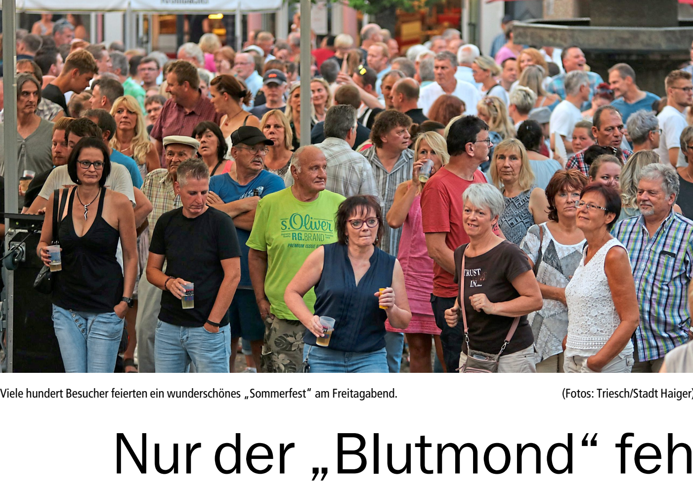
Viele hundert Besucher feierten ein wunderschönes „Sommerfest“ am Freitagabend.