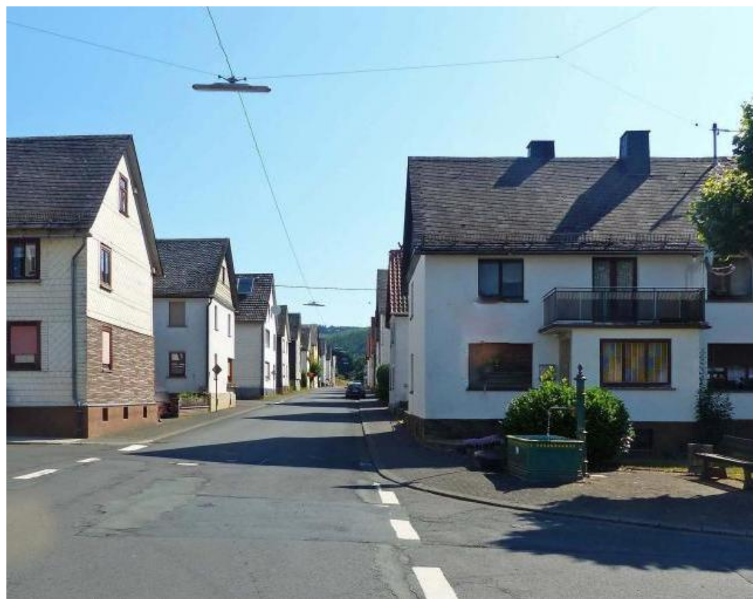
So sieht die „Neue Straße“ heute aus. Der Laufbrunnen wurde nach dem Brand errichtet.