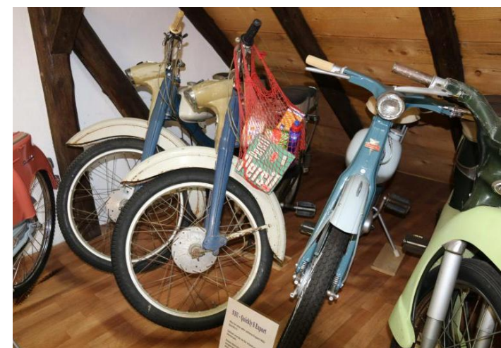
Die „Quicklys“ sind zum Teil mit Waren aus den 50er Jahren dekoriert.

„Diese Ausstellung müssen alle Fans von Kraftfahrzeugen gesehen haben.“