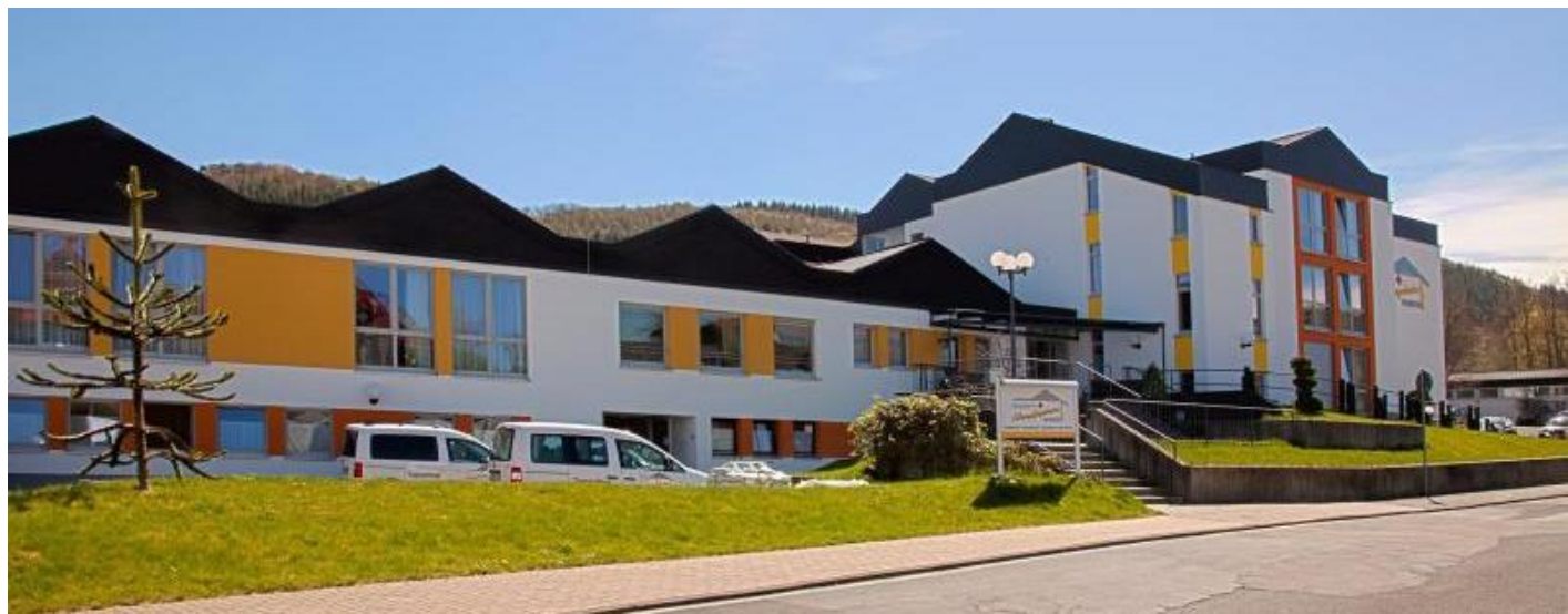
Das DRK-Altenpflegeheim Haiger feiert sein 40-jähriges Bestehen mit einem großen „Tag der offenen Tür“.

Ursprünglich als Einrichtung mit 40 Altenheimplätzen und 15 Pflegeplätzen gebaut, verfügt das Haus heute, nach mehreren Umbauten und Renovierungen, über 60 Plätze für vollstationäre Dauer- oder Kurzzeitpflege. Außerdem werden acht Plätze für Tagespflege-Gäste vorgehalten, die werktags von 8 bis 16 Uhr in der Schlesischen Straße „Zuhause“ sind, also betreut und versorgt werden.