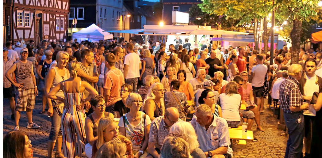
Wenn es dunkel wird, herrscht eine tolle Atmosphäre rund um den Marktplatz. Zahlreiche Gäste nutzen die Gelegenheit, sich zu treffen und bei guter Musik zu unterhalten.