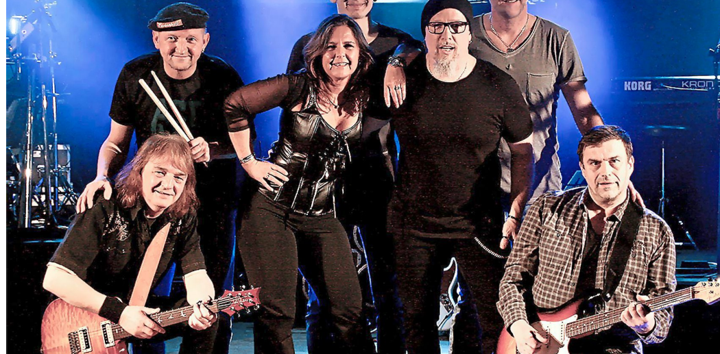
Die Band „ON LINE“ aus Herborn freut sich auf den Auftritt am Haigerer Marktplatz.

Los geht es um 18 Uhr auf dem Marktplatz, die Musik spielt ab 19 Uhr. Natürlich behalten die Festivalbecher, die bisher gekauft wurden, ihre Gültigkeit. In den nächsten Wochen folgen vier weitere Bands: On-line; 10. August: „Open doors“; 17. August: Nightlife; 24. August: Jim Buttons. (öah)