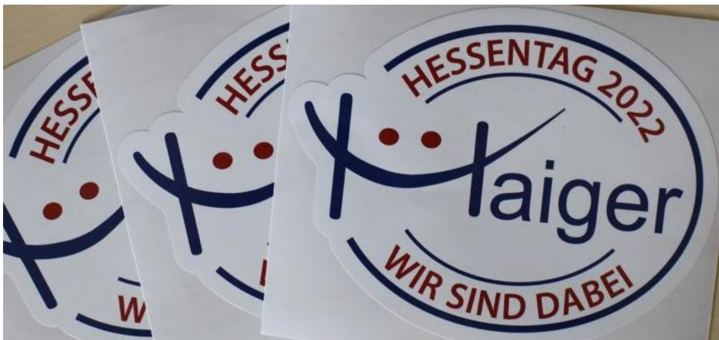
Der Aufkleber zum Hessentag 2022 orientiert sich an dem „lachenden H“, das seit Jahren für die Stadt Haiger wirbt.

Die ersten Haigerer, die einen Aufkleber erhielten, waren die über 100 Bürger, die sich im September 2017 bei der Übergabe der Hessentags-Bewerbung auf dem Rittal-Gelände als interessierte Mit-