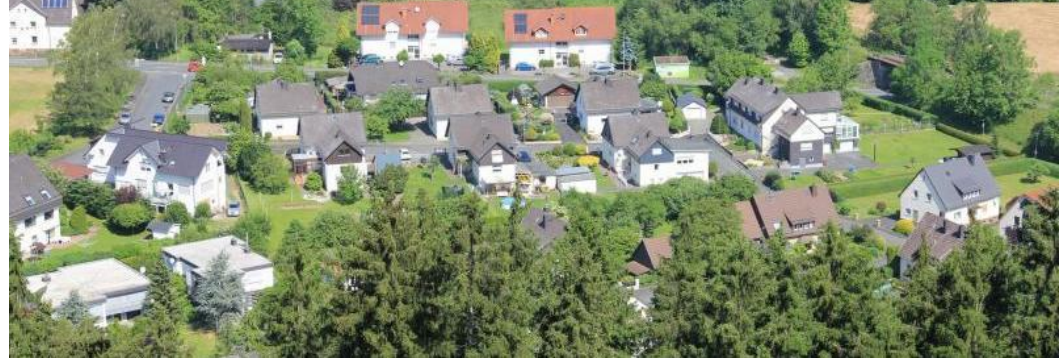
Das Wohngebiet „Reiffenberger“ aus der Vogelperspektive.

Bei guter Stimmung schwebten die Erinnerungen natürlich auch in die Vergangenheit: Viele Heimatvertriebene hatten nach dem Krieg in Haiger eine neue Bleibe gefunden. Im Jahr 1953 bestand für sie die Möglichkeit, vom Land Hessen - über die Stadt Haiger