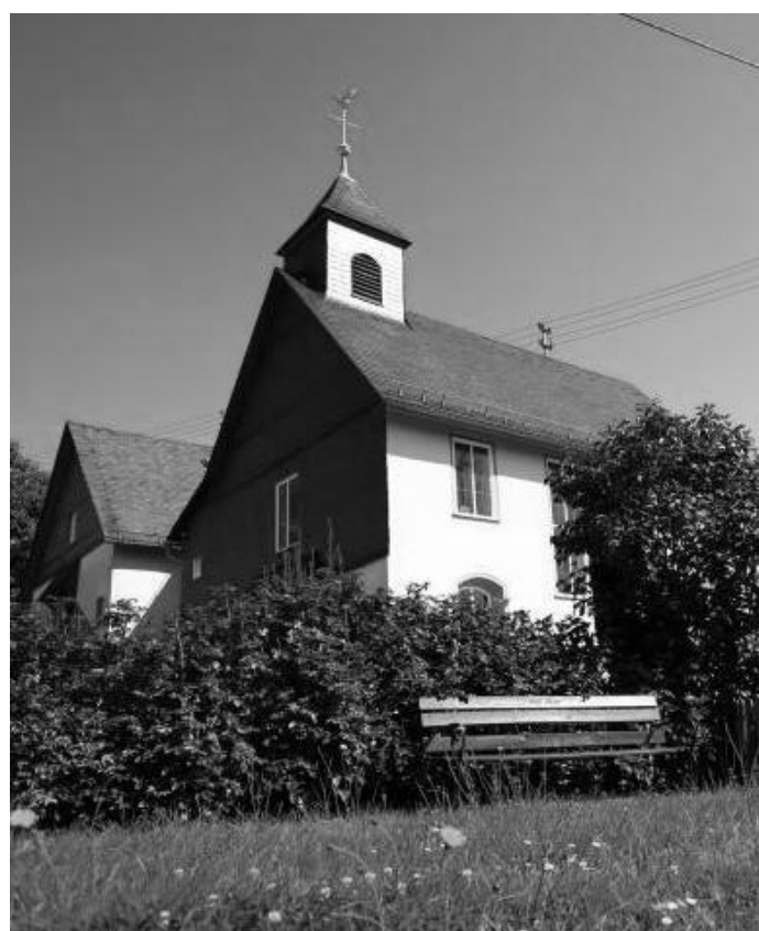
Die evangelische Kirche in Steinbach.