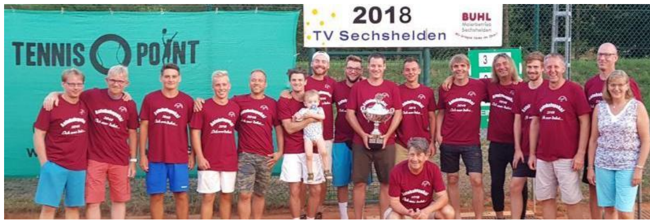
Sieger und Platzierte des Autobahn-Pokalturniers in Sechshelden.

Die Gruppen ersten standen direkt im Finale, die Zweitplatzierten im Spiel um Platz drei. Viele ausgeglichene, lange und enge Spiele in der Gruppe 1 wirbelten den Zeitplan ganz schön durcheinander. So war es nicht verwunderlich, dass am Ende genau gerech-