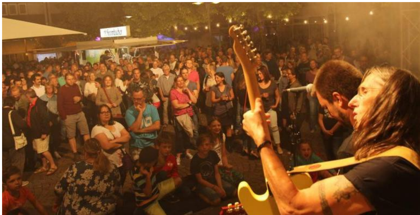
Die „Open doors“ sorgten auf dem Haigerer Marktplatz für eine prächtige Stimmung.

Berichte, Bildergalerien und Videos der Konzerte „freitags live in Haiger“ sind auf der städtischen Facebookseite „Haiger - immer ein Lächeln voraus“ zu finden.