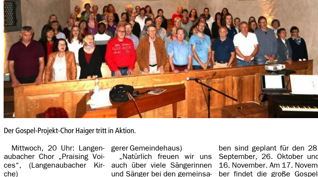
Der Gospel-Projekt-Chor Haiger tritt in Aktion.

Dienstag, 19.30 Uhr: Haigerer Kirchenchor (Ort: Haigerer Gemeindehaus)