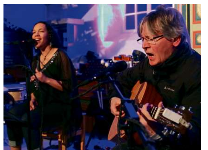
Erstmals auf der Bühne in der Altstadt: Das Paul-Simpson-Project.