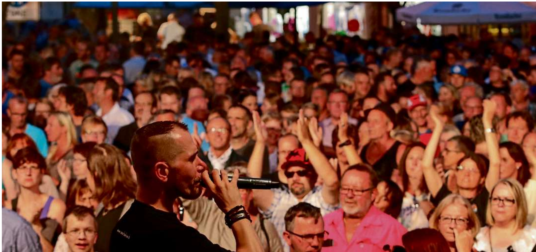
Viele tausend Besucher werden zum traditionellen Haigerer Altstadtfest erwartet.