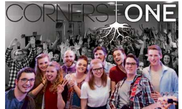
Die Band Cornerstone spielt am Samstagabend mit mehreren weiteren Formationen auf der Bühne am Haarwasen.

Der organisierende Verein „Aufbruch Hessentag Haiger“