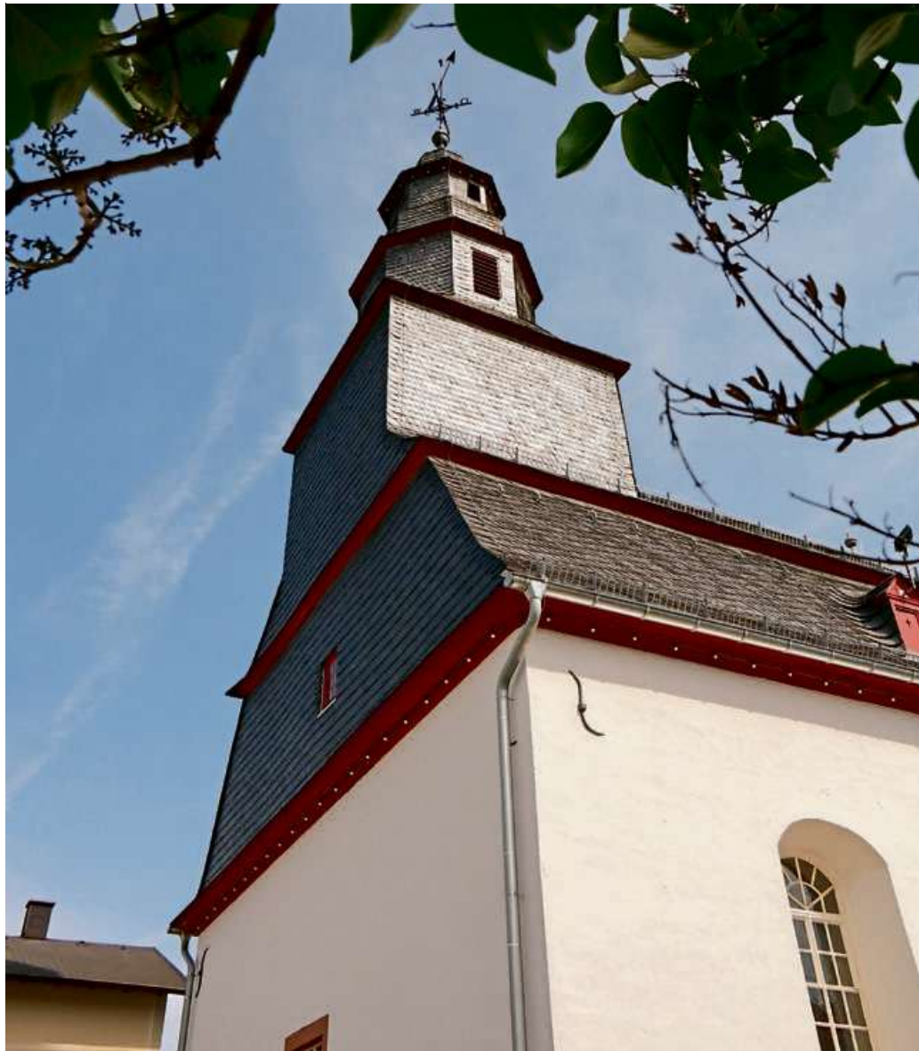
Die evangelische Kirche in Oberroßbach.

Ev. Kirchengemeinde Langenaubach und Flammersbach: Langenaubach, ev. Kirche: So.: 9.30 Uhr, Gottesdienst. Mo.: (Aus)Zeit mit Gott (jd. 1. Mo. im Monat im Vereinshaus, jd. 3. Mo. im Monat in der Kirche). Di.: 19.30 Uhr,