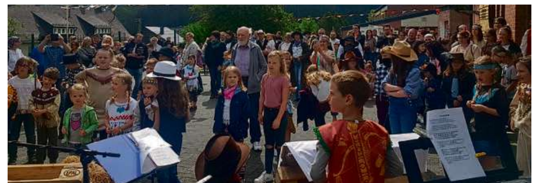
Die Mittelpunkt-Grundschule in Dillbrecht ließ den Wilden Westen aufleben.

Schulfest stand ganz im Zeichen von Cowboys und Indianern