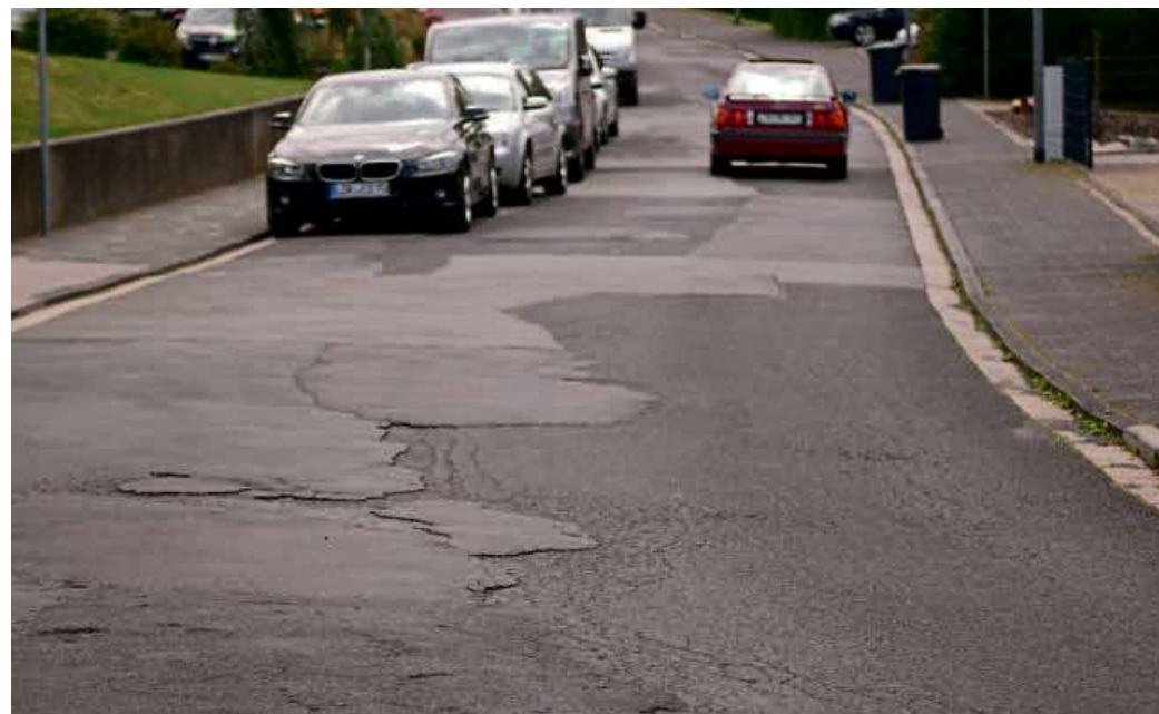
Die Schlesische Straße wird zwischen dem Friedhofsweg und der Straße „Vogelsgesang“ grundhaft erneuert.

Die Arbeiten in der Schlesischen Straße werden etwa sechs Monate dauern