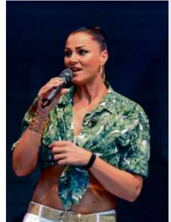
Die Sängerin der SuperPhonix - gern gesehener Gast auf Haigerer Altstadtfest-Bühnen.

Name Programm. Die fünf Bandmitglieder kennen die Wurzeln des Rock und Blues aus dem „Effe“ und ergänzen ihr Programm durch selbstgeschriebene Stücke.