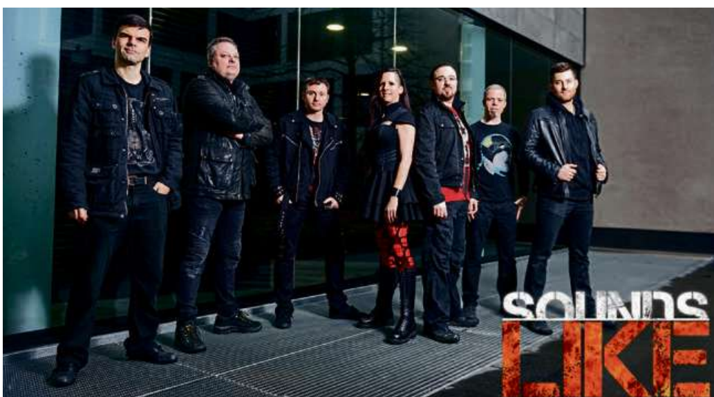
Die Band „Soundslike“ freut sich auf ihre Premiere in Haiger.

„Hintern Graben“ (ehem. B 277 / SSV Langenaubach); Oberer Parkplatz Isabellenstraße (Lions Club Haiger)