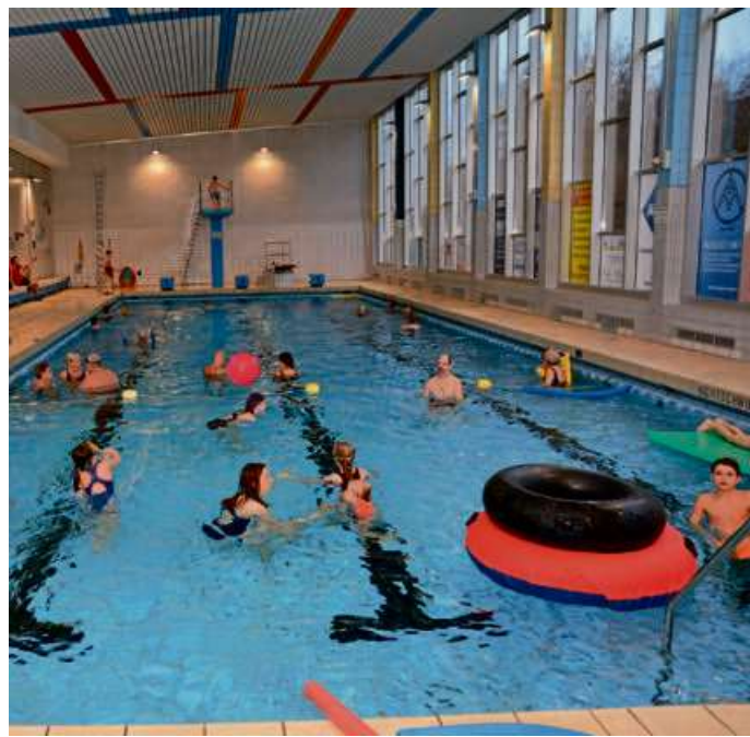
Im Hallenbad spielen

Stadt weist auf Berechnung der Niederschlagswassergebühr hin