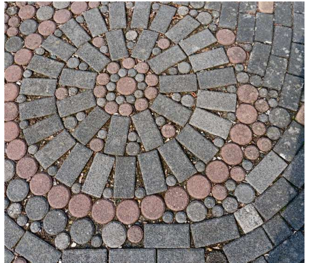
Wer Flächen pflastert, muss dies der Stadtverwaltung mitteilen.

Kontakt: Bauamt der Stadt Haiger, Fachdienst Abwasser, Tel. 02773/811-0 oder per Email: abwasser@haiger.de