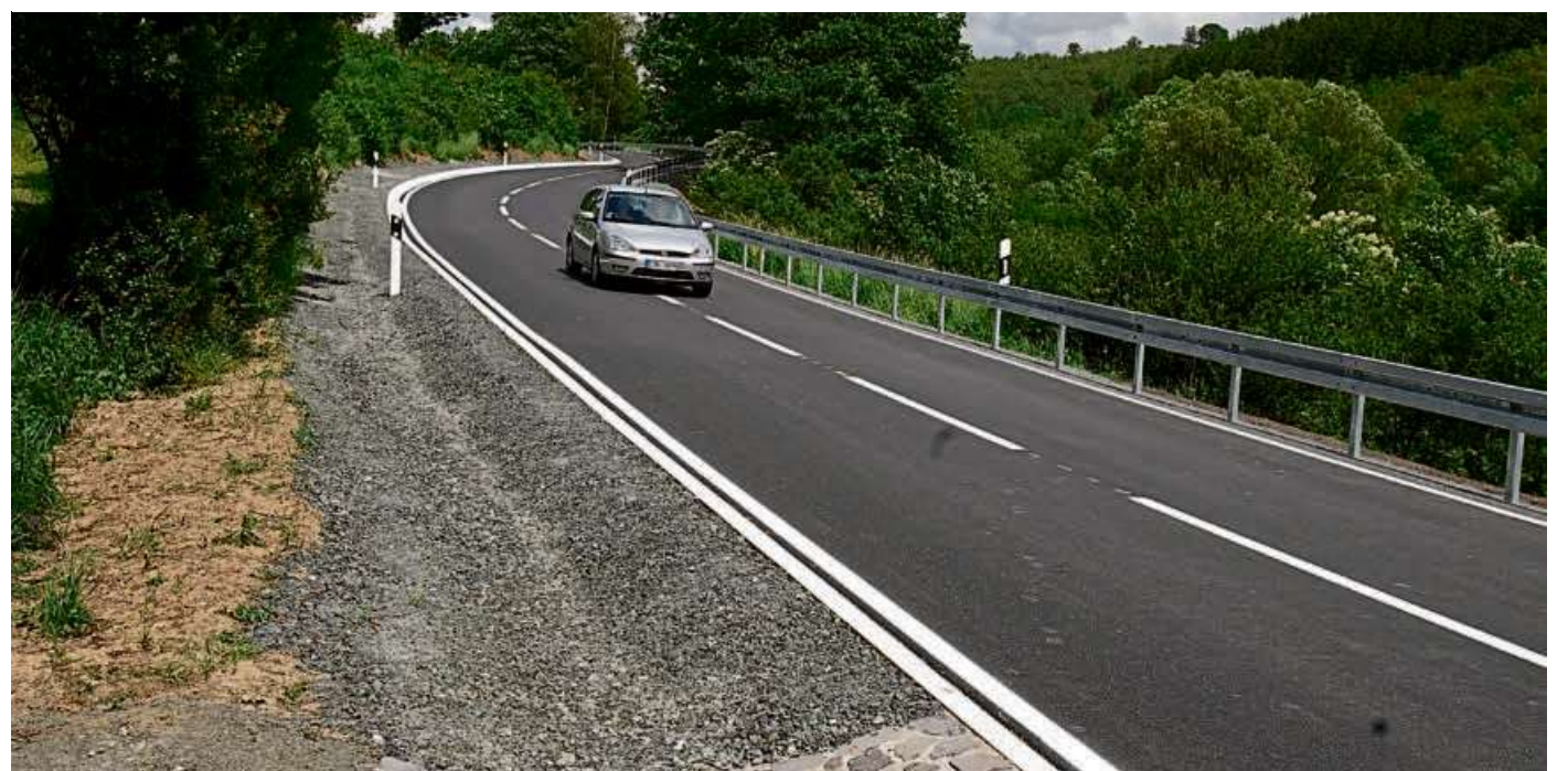
Auf der L 3044 kann der Verkehr wieder fließen.

Zweiter Bauabschnitt der Sanierung zwischen Oberroßbach und Weidelbach abgeschlossen