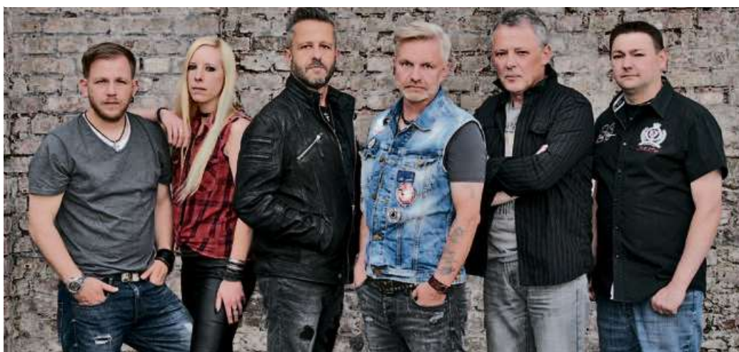
Stammgäste in Haiger: Die Deutschrocker von „Hörgerät“ aus Siegen.

„Wir haben wieder eine sehr gute musikalische Mischung und