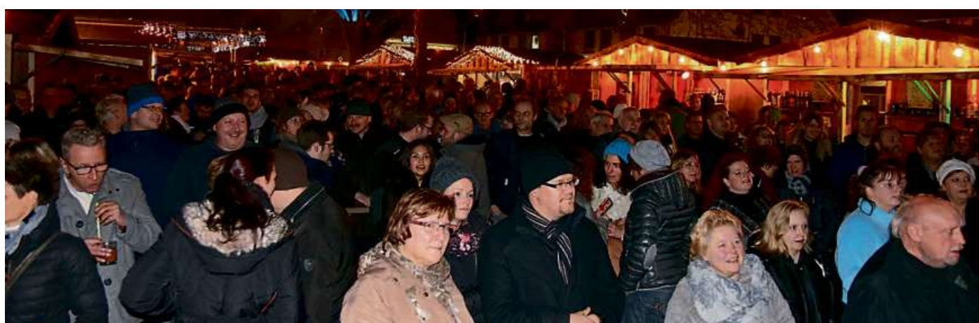
Viele Gäste lieben die tolle Atmosphäre des Haigerer Winterzaubers. Wenn die Musik spielt, ist der Platz regelmäßig prall gefüllt.