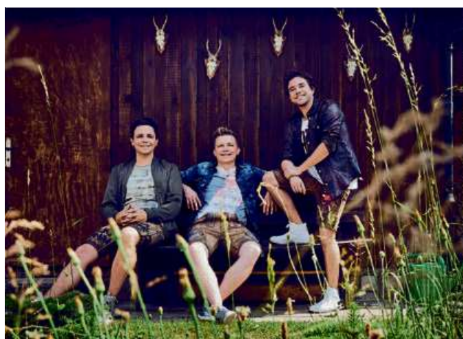
Die Dorfröcker kommen im Mai 2020 zum SSV Haigerseelbach.

Am Freitag (22. Mai) hat der SSV die aus Mallorca bekannten „Remmi-Demmi-Boys“ zu Gast. Unter dem Motto „Wir feiern nicht, wir eskalieren“ sorgen die Kölner europaweit mit Party-schlagern für gute Stimmung. Im