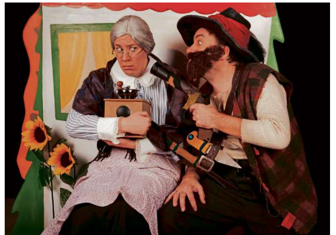
Der Räuber Hotzenplotz wird in der Haigerer Stadthalle aufgeführt.

Kasper und Seppel beschließen, den Dieb zu suchen und ihm eine Falle zu stellen, um die wertvolle Kaffeemühle zurückzubekommen. Allerdings werden sie stattdessen von Hotzenplotz gefangen. Kasper soll in der Räuberhöhle schufteln und Seppel wird an den bösen Zauberer Petrosilius Zwackelmann verkauft. Alle Kinder und Junggebliebenen erwartet ein echtes Abenteuer.