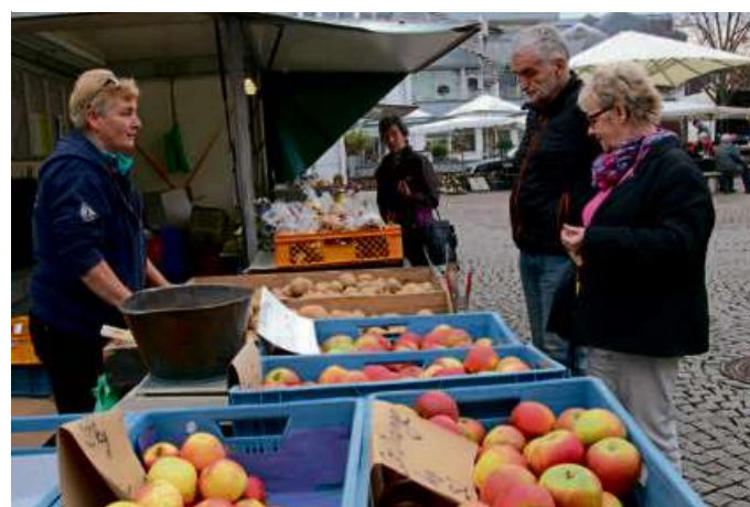
Der Wochenmarkt findet auch in der Weihnachtszeit statt. Einige Stände erhalten allerdings einen neuen Standort.

Aufgrund der Weihnachtsfeiertage findet in der Woche vom 23. bis zum 27. Dezember kein Wochenmarkt statt. Der letzte