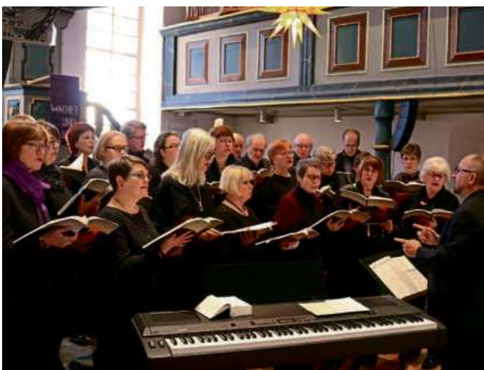
Der Kirchenchor aus Allendorf.

Der Eintritt ist frei. Es wird jedoch um eine Spende gebeten für den Verein lebensWERT, der sich seit einigen Jahren in Haiger karitativ um Menschen kümmert.