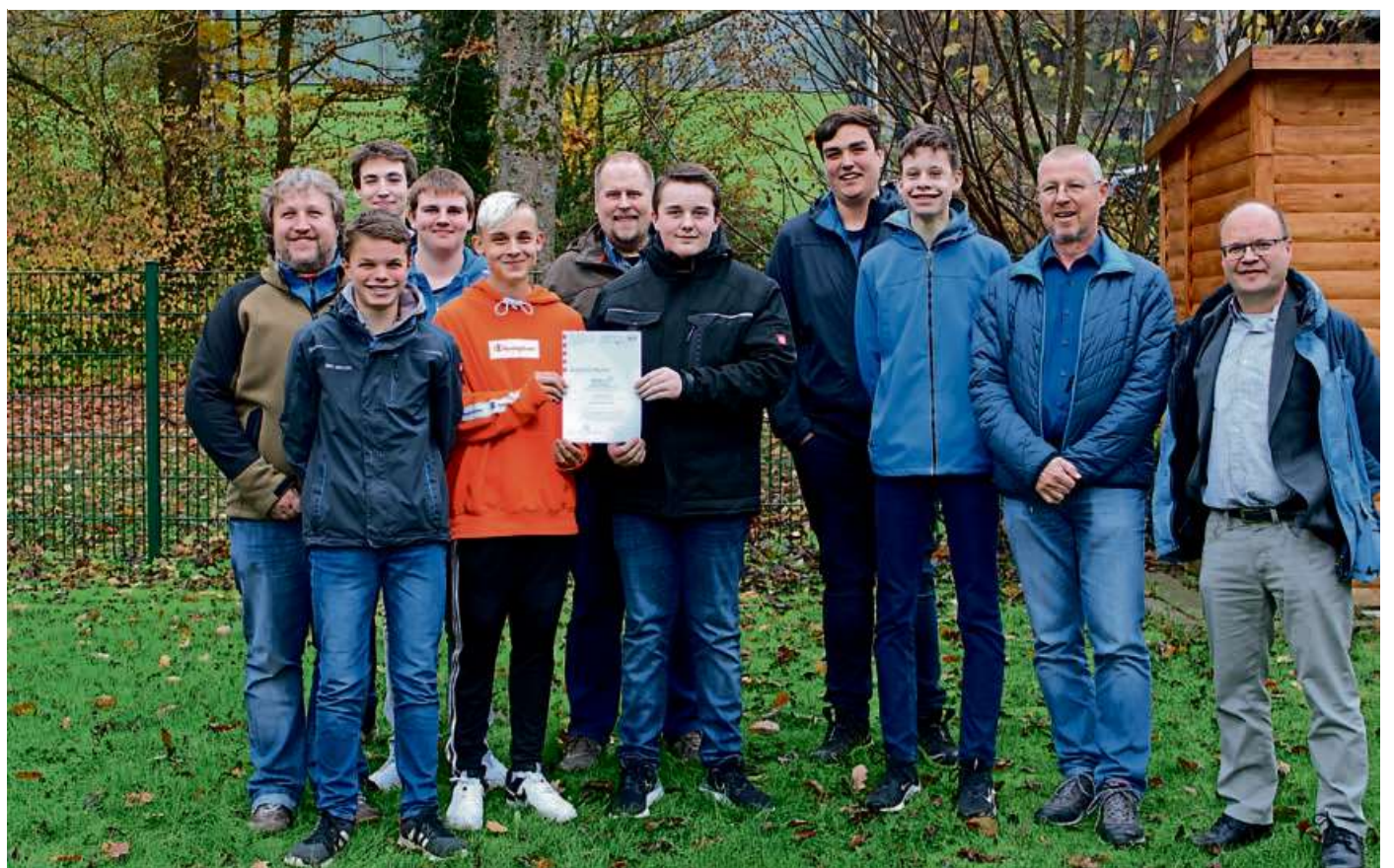
Die Haigerer Johann-Textor-Schule freut sich über das Siegel „Hessische Umweltschule“.