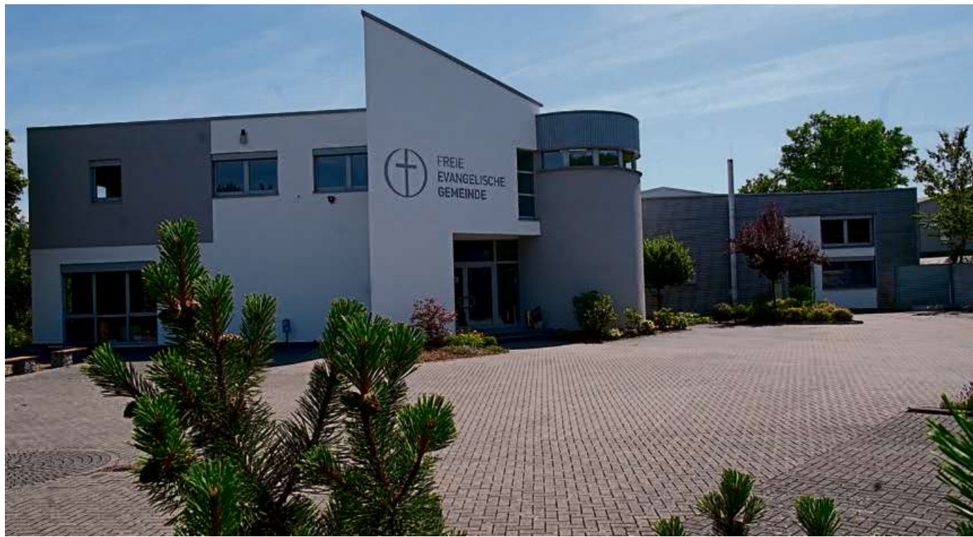
Die Freie evangelische Gemeinde Rodenbach.

Offdilln: Sa.: 15 Uhr Kindergottesdienst (einmal im Monat). Mo.: 19.30 Uhr Chorstunde. Di.: 20 Uhr Bibel-