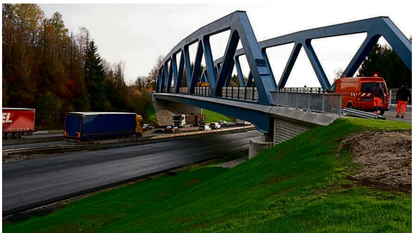
Auch die südliche Brücke über die A45 ist fertig.