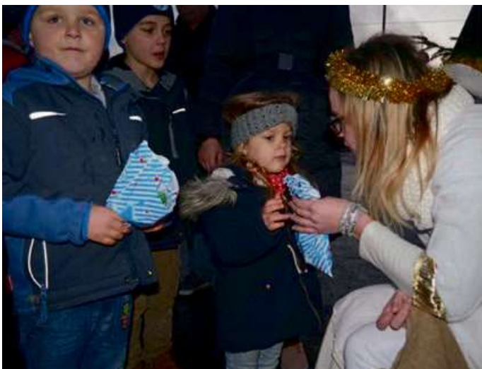
Auch das Christkind kommt zum Weihnachtsmarkt nach Offdilln.

Das Christkind bringt wieder Geschenke für die Kleinsten im Dorf. Der Heimatverein freut sich auf viele Besucher.