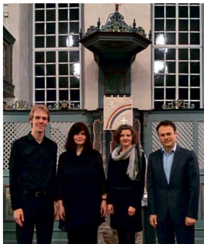
Ein Vokalensemble ist in Offdilln zu Gast.

Beginn ist um 20 Uhr, der Eintritt ist frei.