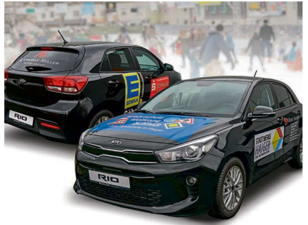
Dieser Kia Rio ist in Haiger zu gewinnen.