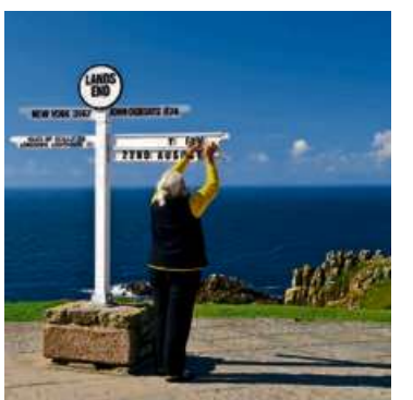
Georg Krumm porträtiert die schönsten Ecken von Cornwall.

HAIGER (red) – Cornwall ist für viele Deutsche hauptsächlich „Rosamunde-Pilcher-Country“: Die immer noch zahlreichen Fans ihrer Romanen pilgern unermüdet in den äußersten Südwesten Englands, um die Originalschauplätze der Romanzen zu besichtigen. Die kennt man aus zahllosen Filmen, in denen der Atlantik schicksalsschwer braust und die Klippen schroff wie menschliche Abgründe stürzen. Tolle Impressionen im Süden Englands: Zwischen saftigen Wiesen und sanften Hügeln stehen versteckt kleine, romantische, blumenbewachsene Cottages. Die schönsten Ecken von Pilcher Verfilmungen werden im Diavortrag von Georg Krumm vorgestellt. Dieser wird am Dienstag (3. Dezember, 20 Uhr) in der Stadthalle, Haiger gehalten. Karten gibt es in Haiger bei: Buchhandlung Krenzer und Foto-Trend Gillmann. Oder online unter www.georg-krumm.de .