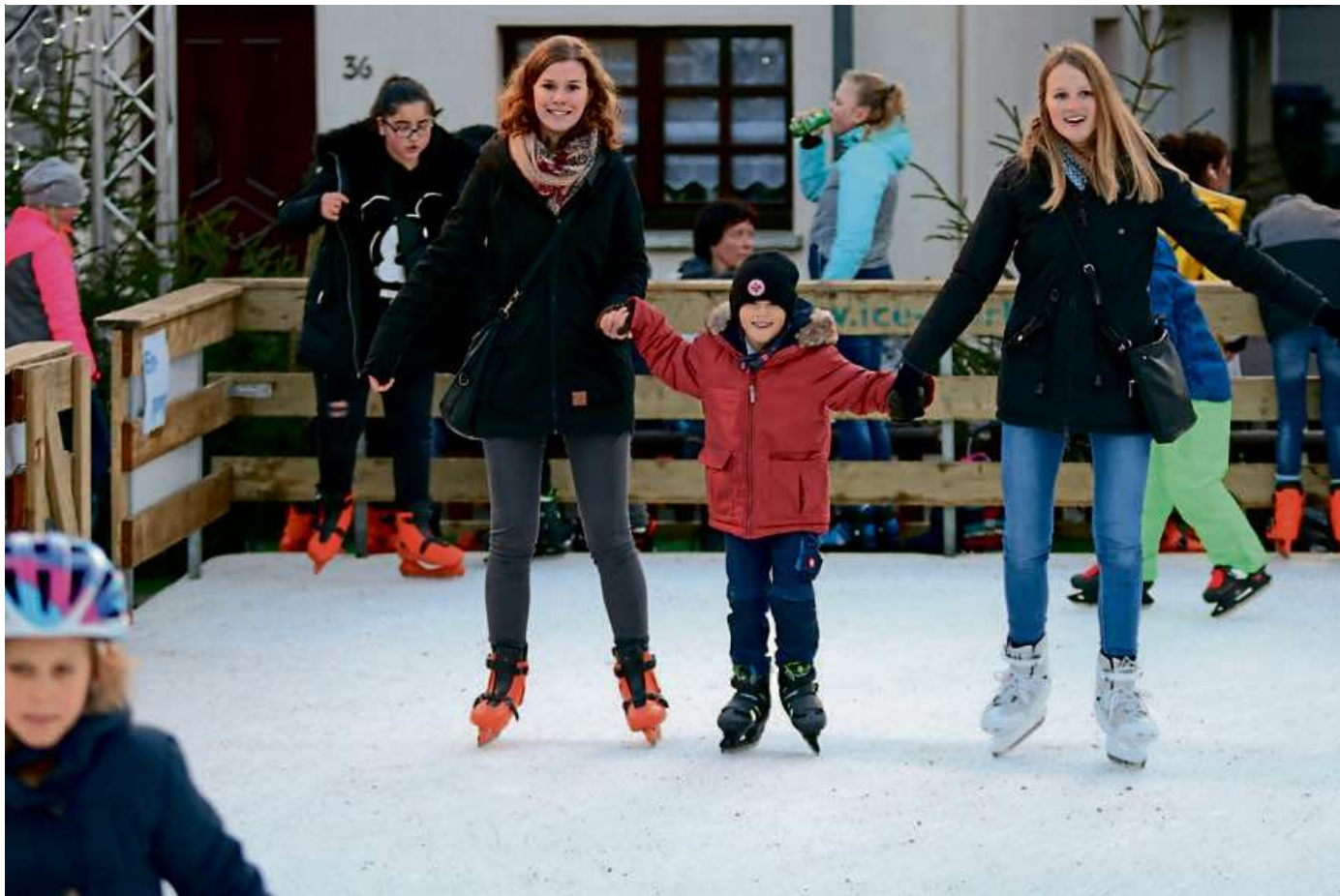
Zahlreiche große und kleine Wintersportfreunde freuen sich bereits auf die Eröffnung der Eislauf-Arena.