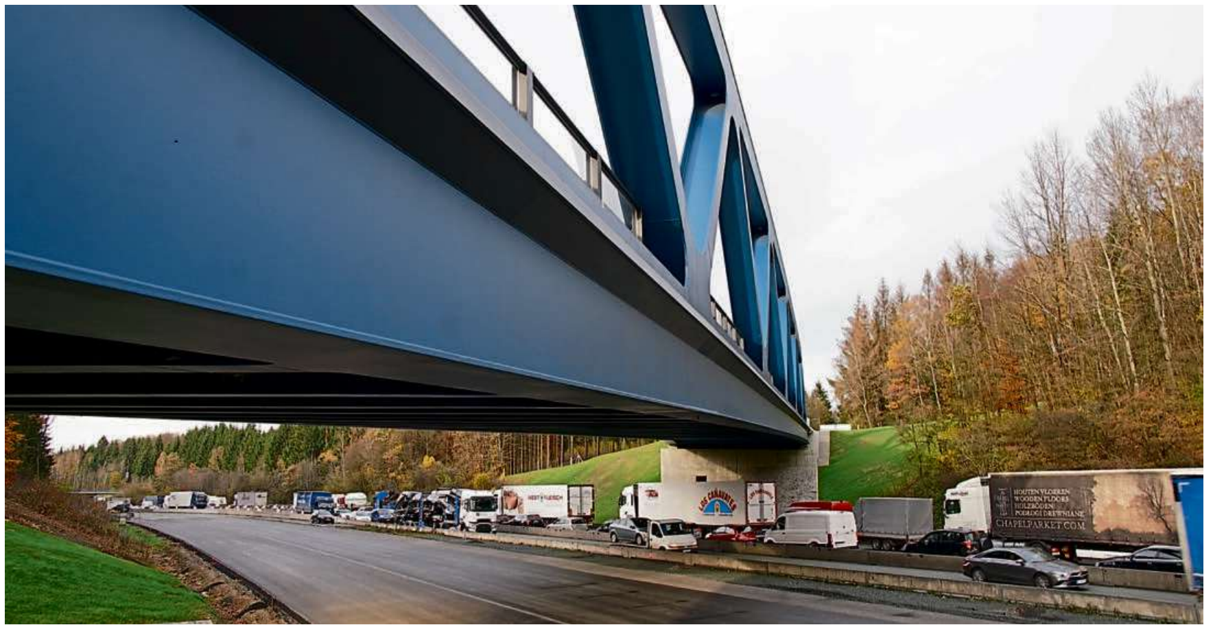
Die nördliche B54-Brücke überspannt ebenfalls die Autobahn A45.