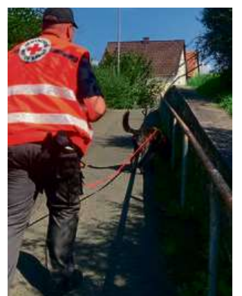
Ein Mantrailer folgt einer Geruchspur.

Die Prüfung beginnt um 8 Uhr in den Räumlichkeiten der DRK-Bereitschaft Haiger.