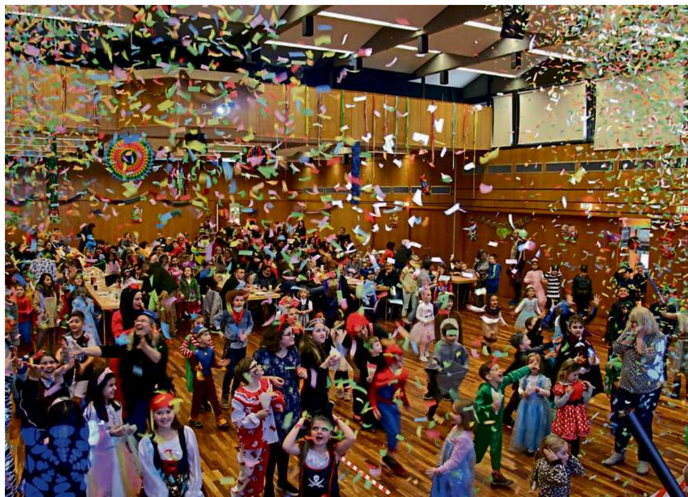
„Volle Hütte“ beim Kinderkarneval in der Haigerer Stadthalle

Oberroßbach, 19 Uhr, Ev. Kirche, Lehmkaute, im Anschluss im Gemeindehaus