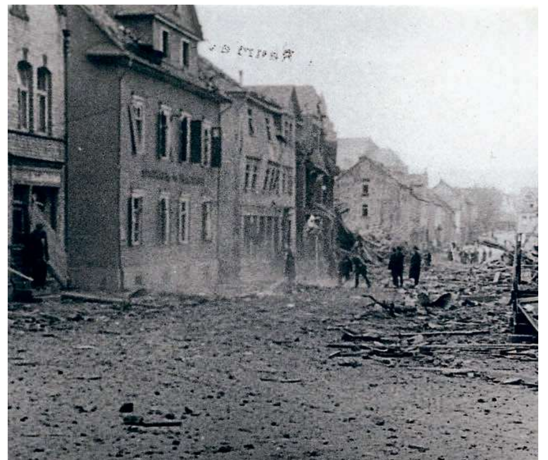
So sah es in Haiger im März 1945 aus. In einer Gedenkveranstaltung wird an die Bombardierung der Stadt erinnert.