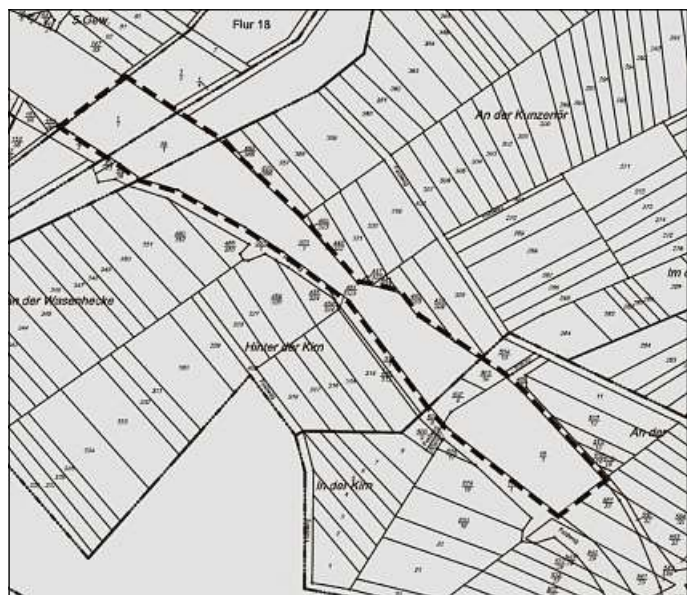
Abbildung 2: Externe Maßnahmenfläche F2, ohne Maßstab

Die Aufstellung des Bebauungsplanes erfolgt im beschleunigten Verfahren gem. § 13a BauGB ohne Durchführung einer Umweltprüfung gem. § 2 (4) BauGB.