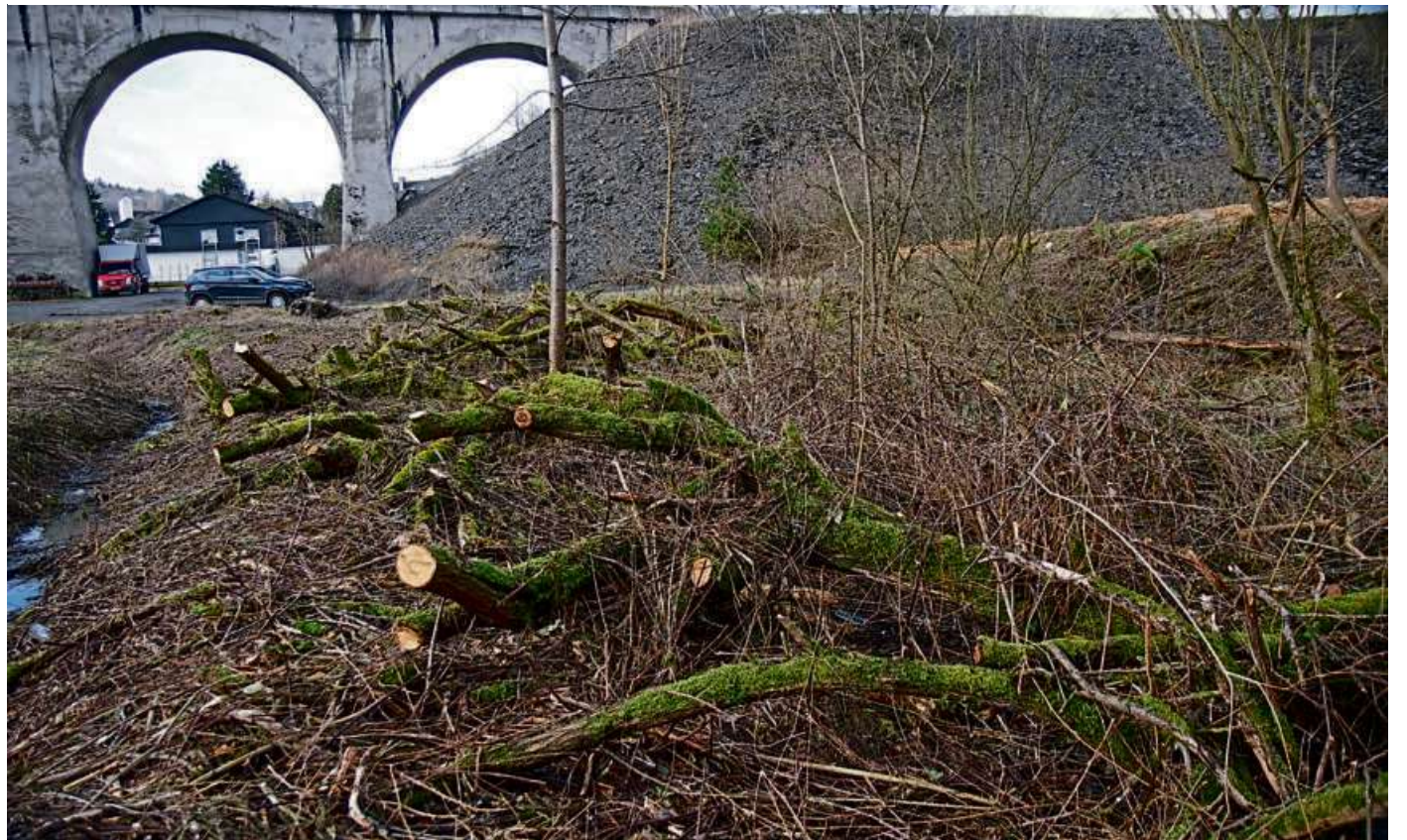
Der Gehölzrückschnitt in Flammersbach. Die Äste bleiben bewusst liegen, um den dort vorkommenden Tierarten eine Versteckmöglichkeit zu bieten.

„Durch den Rückschnitt der Gehölze in Flammersbach wird