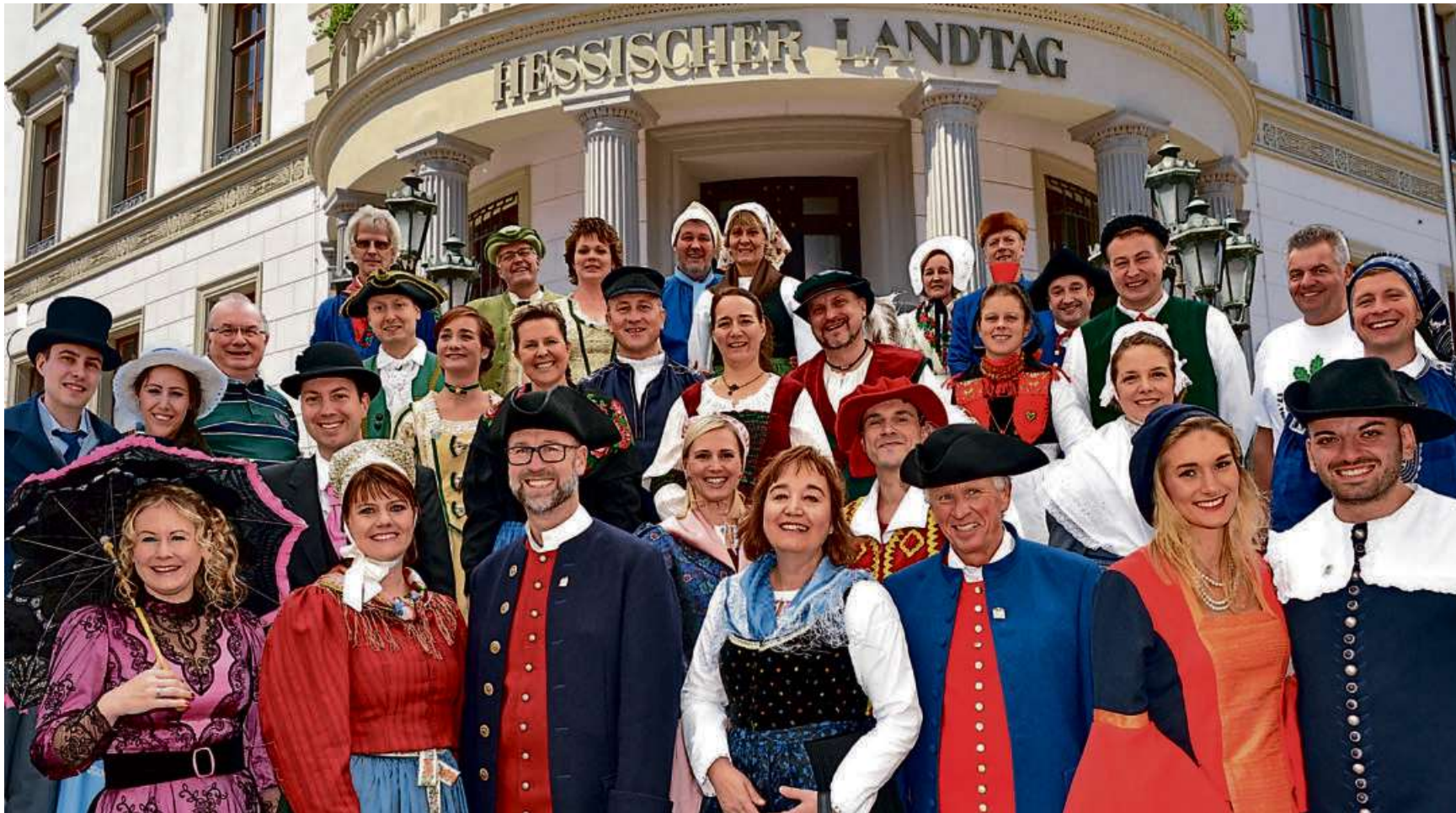
Die Hessentagspaare der vergangenen Gastgeberstädte versammelten sich vor dem Wiesbadener Landtag zum Gruppenfoto.