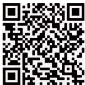
QR-Code zur Homepage.

Magistrat der Stadt Haiger, Hessentagsbeauftragte, Marktplatz 7, 35708 Haiger.