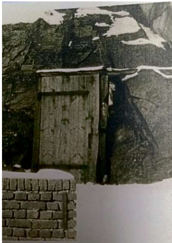
In diesem Felsenkeller im Flammersbacher Ortskern suchten die Bürger Schutz.

Die Landbevölkerung war etwas besser, aber auch schlimm genug aus diesem Vernichtungskrieg herausgekommen. Das eigentliche Kriegsende wurde auf den 8. Mai 1945 festgesetzt. Schwere Bombenangriffe auf Haiger, die ich miterlebt habe, werde ich nicht vergessen. Auch Flammersbach hat einiges abbekommen. Die Talbrücke wurde von Jabos („Lightnings“, doppelrumpfige Jagdbomber) angegriffen und beschädigt.