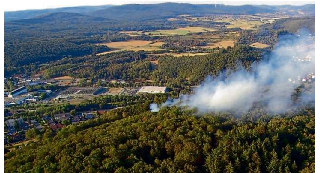
Wer einen Waldbrand bemerkt, wird gebeten, unverzüglich die Feuerwehr (Notruf 112) zu informieren.

Um ein schnelles Reagieren der Feuerwehr im Falle eines Brandes sicherzustellen, sollten Waldbesucher mit ihren Fahrzeugen nicht die Zufahrtswege in die Wälder blockieren. Zudem dürfen Pkws nur auf den ausge-