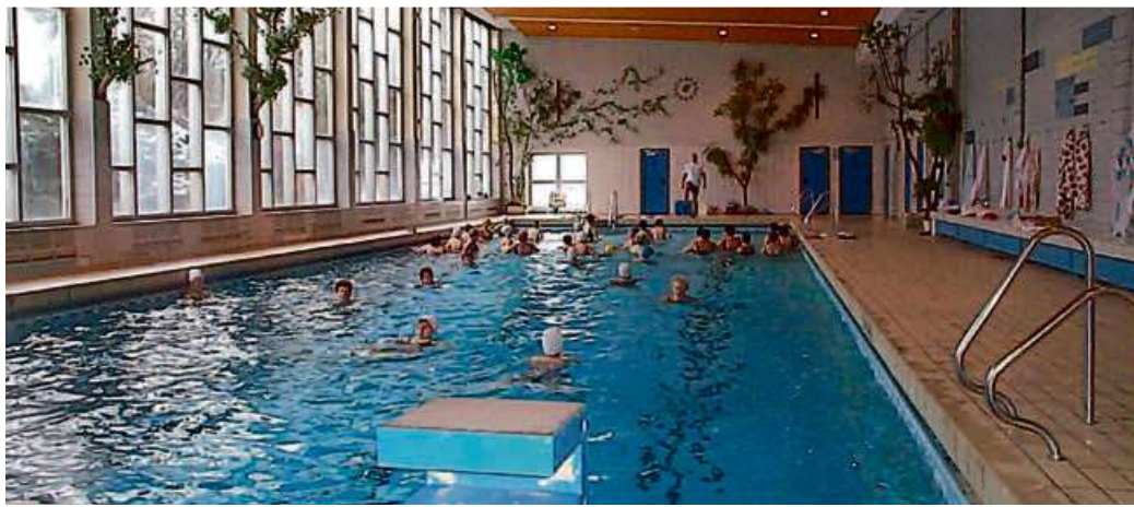
Im Haigerer Hallenbad finden derzeit lediglich Kurse mit angemeldeten Teilnehmern statt.