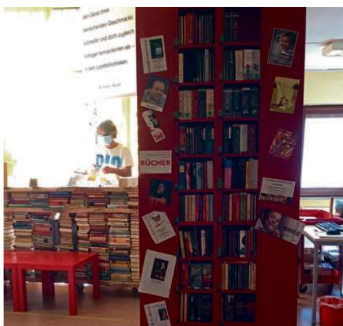
Rund 11 500 Medien hat die Stadtbücherei im Angebot.

Am 2. September, dem Jubiläumstag, werden aus den Einsendungen drei Gewinner ausgelost (pro Zielgruppe „Kinder, Jugendliche, Erwachsene“ jeweils ein Gewinner).