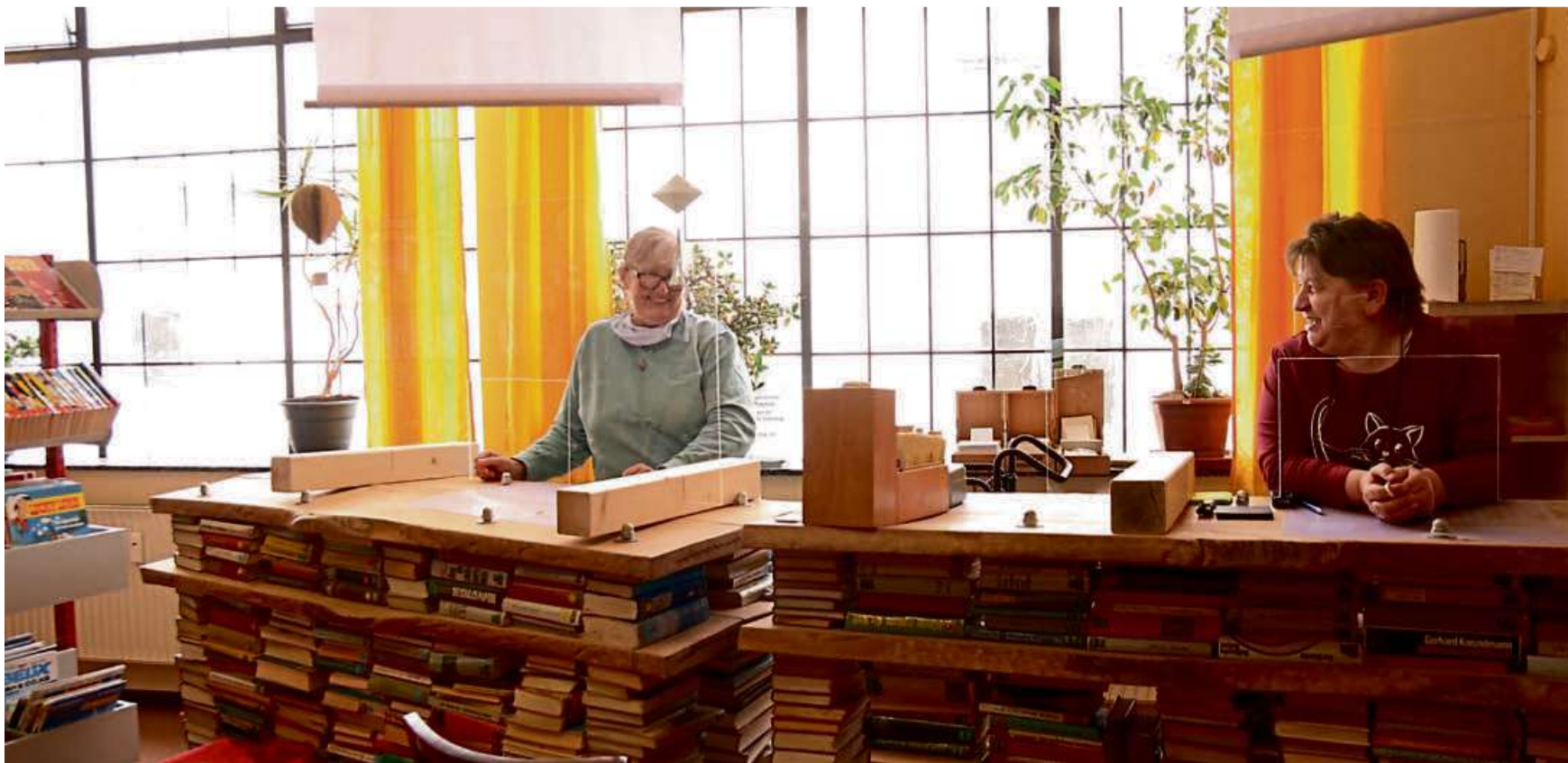
Bis zum 31. August können Bürger aus Haiger und den dreizehn Stadtteilen eine Beschreibung ihres Lieblingsbuches der Stadtbücherei zukommen lassen und auf den Gewinn eines Büchergutscheins hoffen.