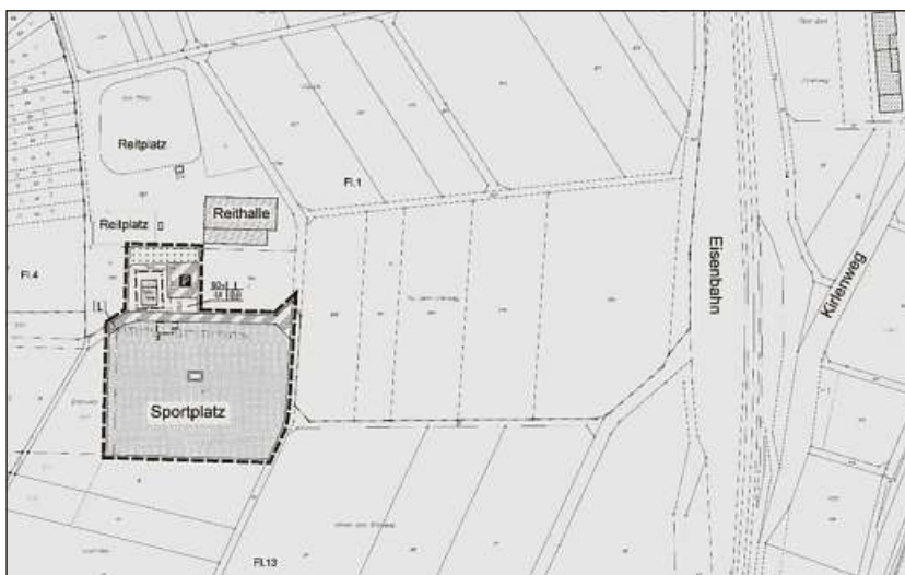
Abb.: Geltungsbereich des Bebauungsplanes

Die Stadtverordnetenversammlung der Stadt Haiger hat in ihrer Sitzung am 22.07.2015 den o. g. Bebauungsplan mit dem aus nachfolgender Abbildung ersichtlichen Geltungsbereich als Satzung beschlossen.