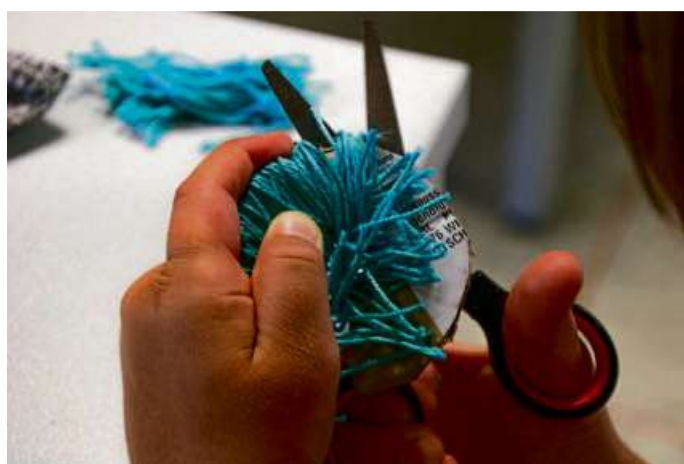
So entsteht eine Bommel.

Mit Themen wie „Rund um die Kamera“, „Basteln mit Wolle“, „Waldtiere“, „Bauen mit Lego“ oder „Outdoor-Experimente“