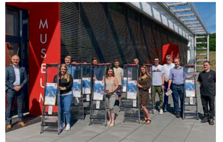
Zum erfolgreichen Ausbildungsabschluss gab es Glückwünsche und die „HAILO-Karriereleiter“ für jeden Absolventen.

Ende 1948 kam er mit einer linksseitigen Lähmung nach Hause. Mit der Familie, in der er gelebt und gearbeitet hatte, bestand noch jahrelang ein guter Kontakt. Für mich war mein Vater ein fremder Mann, da ich ihn nur vom Bild kannte. Kurz nach meiner Geburt musste er in den Krieg ziehen. So haben es manche Kinder erlebt. Aber wir freuen uns, dass unsere Väter wieder zu Hause waren und nicht