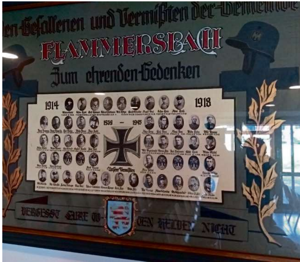
Dieses Bild hängt in der Flammersbacher Friedhofskapelle und erinnert mit Bildern an die Gefallenen der beiden Weltkriege.