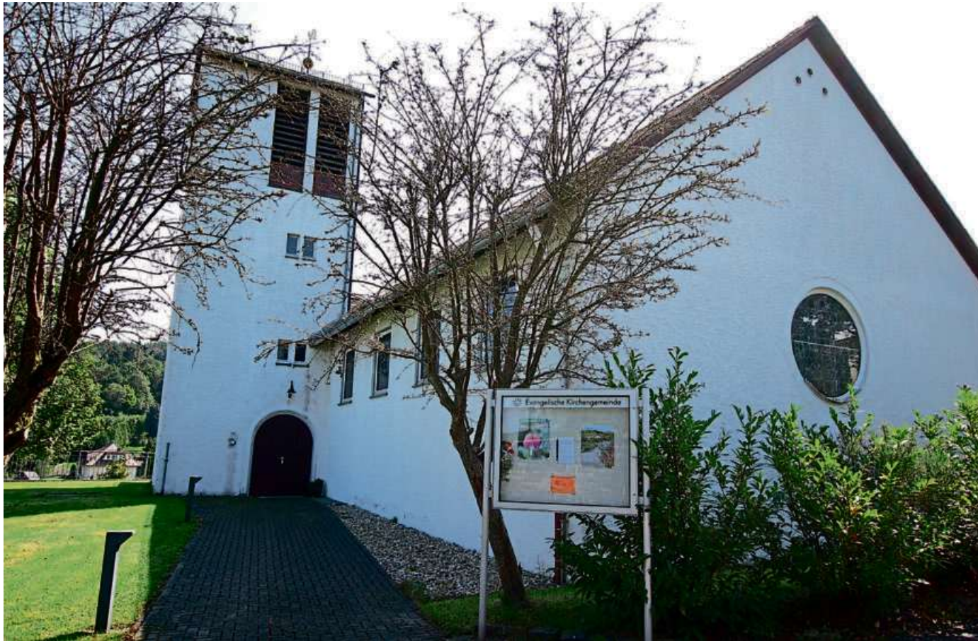
Die evangelische Kirche in Flammersbach.

Ev. Kirche Langenaubach und Flammersbach: Langenaubach, ev. Kirche: So.: 9.30 Uhr, Gottesdienst. (27 Plätze), derzeit fraglich. Mo.: (Aus)Zeit mit Gott (jd. 1. Mo. im Monat im Vereinshaus, jd. 3. Mo. im Monat in der Kirche). Di.: 19.30 Uhr, Frauentreff (jd. 3.); 19 Uhr, Frauenkreises/ Mütterkreis (jd. 1.). Mi.: 20 Uhr, Projektchor. Do.: 14.30 Uhr, Frauenhilfe (jd. 2. Do.). Do.: 14.30 Uhr, Frauenhilfe (jd. 2. Do.). Do.: 19 Uhr). Flammersbach,