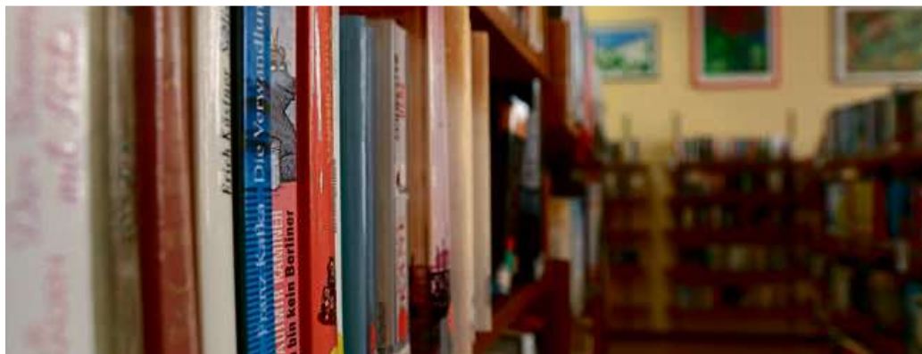
Seit 52 Jahren existiert der beliebte Kulturort und feiert am 2. September das 10-jährige Jubiläum der Kooperation von Lebenshilfe Dillenburg und Stadt Haiger.

HAIGER (öah/lea) – Ein Ort zum Wohlfühlen; Altes ehren und Neues entdecken; Lese- und Hörerlebnis; wertvolle, neue Bekanntschaften – Beschreibungen wie diese charakterisieren die Stadtbücherei am Obertor in Haiger treffend. Seit 52 Jahren existiert der beliebte Kulturort und feiert am 2. September das zehnjährige Jubiläum der Kooperation zwischen der Lebenshilfe Dillenburg und der Stadt Haiger. Zur Feier des Tages wird ein Literaturwettbewerb veranstaltet. Einsendeschluss dafür ist am 31. August.