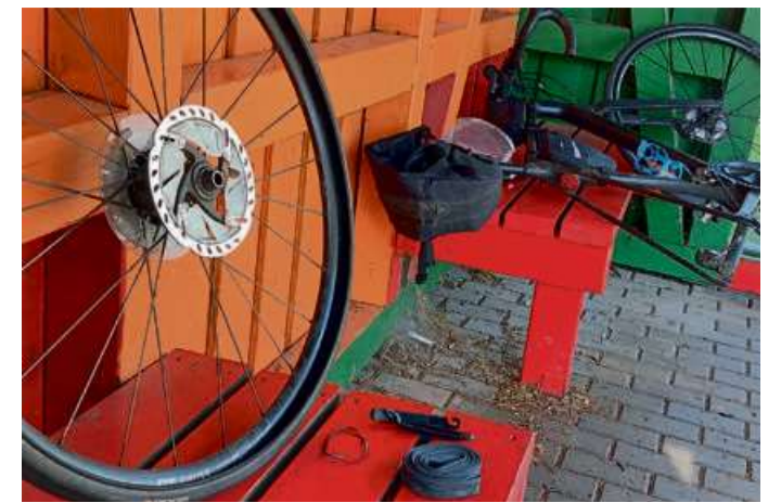
Leider blieben auch Pannen nicht aus.