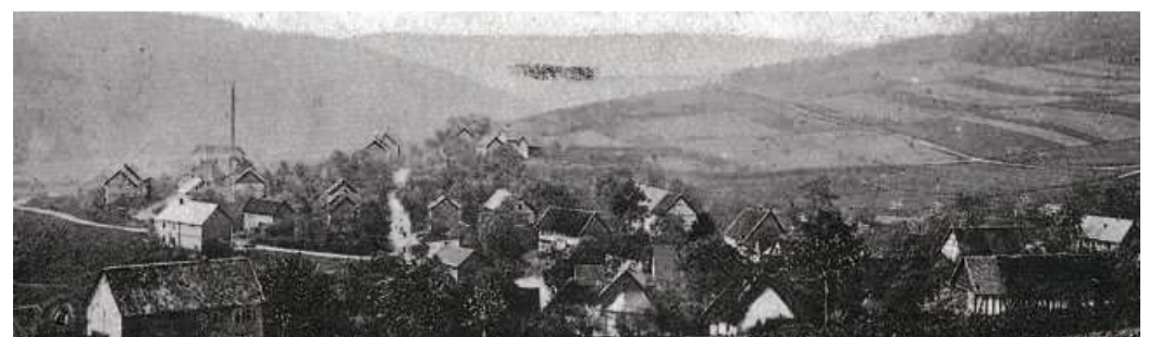
Steinbach ca. 1926. Im Hintergrund der Schornstein der Freudenzee.