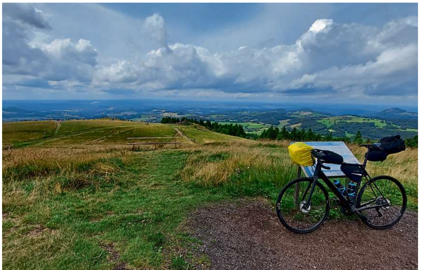
Auf der Wasserkuppe ergab sich ein faszinierender Ausblick.