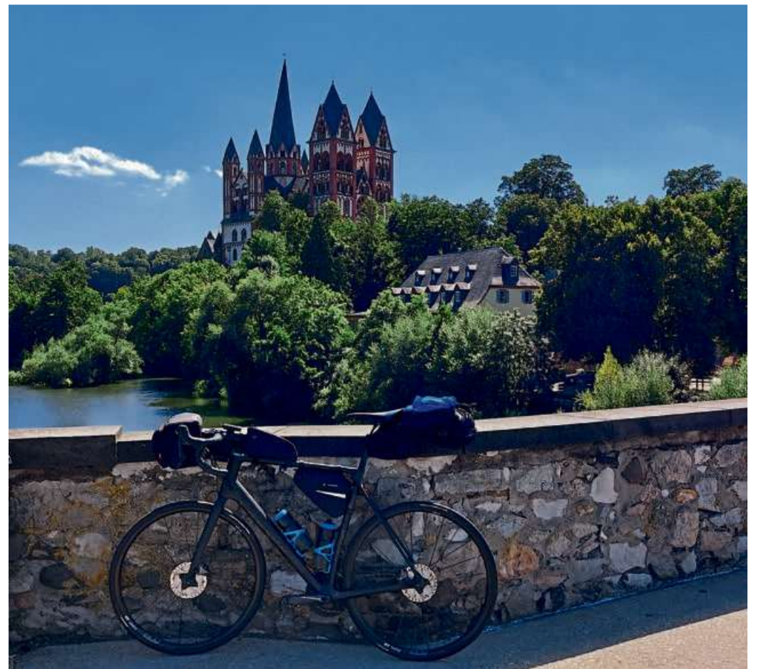
Das Rennrad vor der malerischen Kulisse von Limburg.