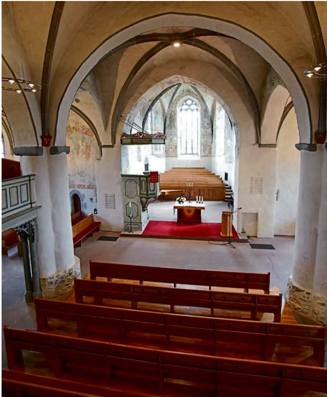
Die evangelische Stadtkirche Haiger.

Freie ev. Gem. Offdilln: So.: 9.30 Uhr, Gottesdienst. Mo.: 9 Uhr, Frauen-Gebetskreis; 20 Uhr, Jugend.