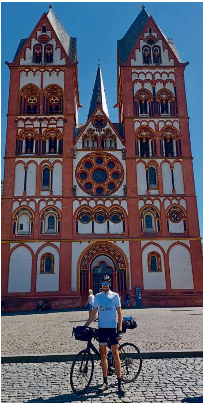
Vor dem Limburger Dom.