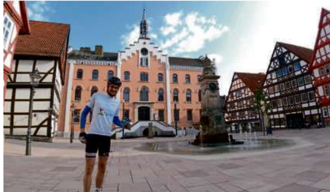
Malerische Kulisse in Hofgeismar.

Wir veröffentlichen die schönsten Fotos des 23-jährigen Sportstudenten. Weitere Fotos des Langenaubachers sind auf der städtischen Facebookseite „Haiger - immer ein Lächeln voraus“ sowie auf Instagram (hessentag-haiger2022) zu finden.