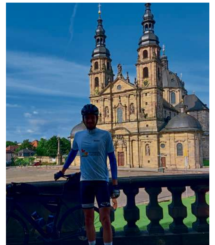
Vor dem Dom in Fulda.