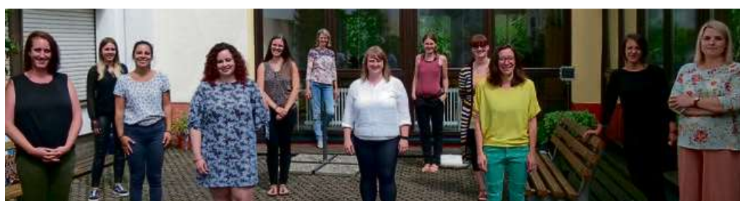
Gemeinsam mit der Prüfungskommission stellten sich die neuen Kindertagespflegepersonen des Lahn-Dill-Kreises und der Stadt Wetzlar dem Fotografen.

Tätigkeitsvorbereitende Ausbildung mit 160 Unterrichtseinheiten erfolgreich absolviert