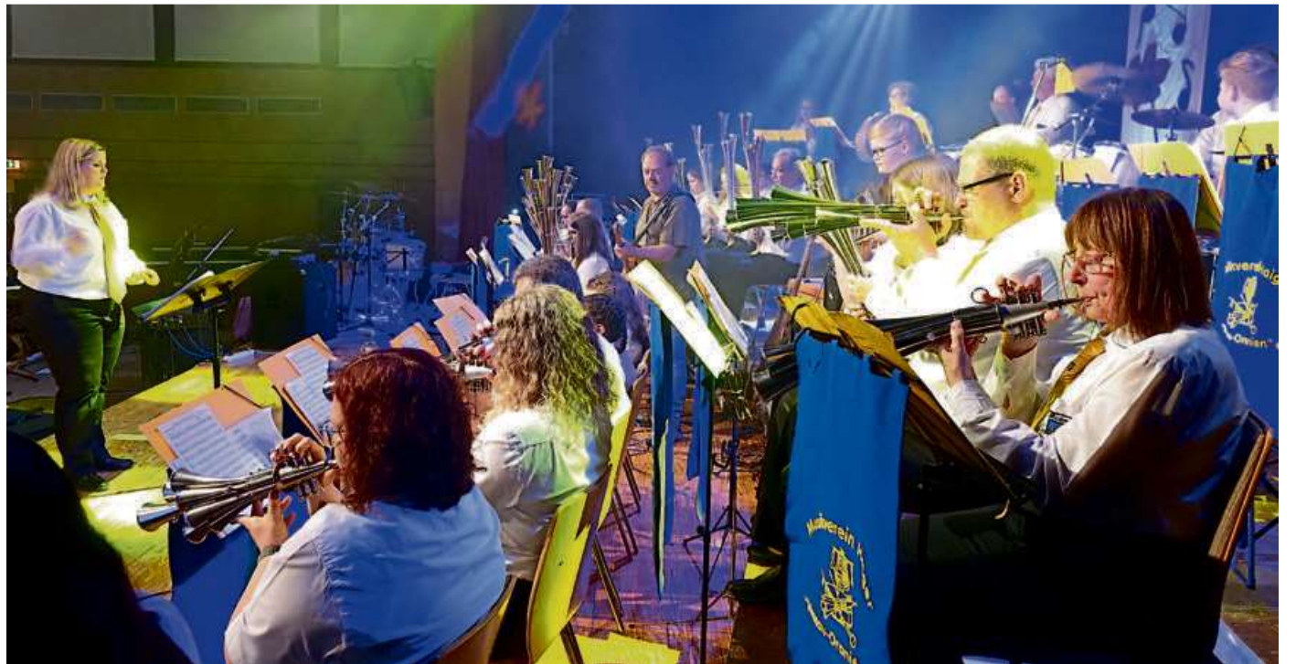
Der Musikverein Nassau-Oranien lädt zum Benefiz-Konzert.

Musikverein „Nassau Oranien“ organisiert Benefizkonzert auf dem Marktplatz