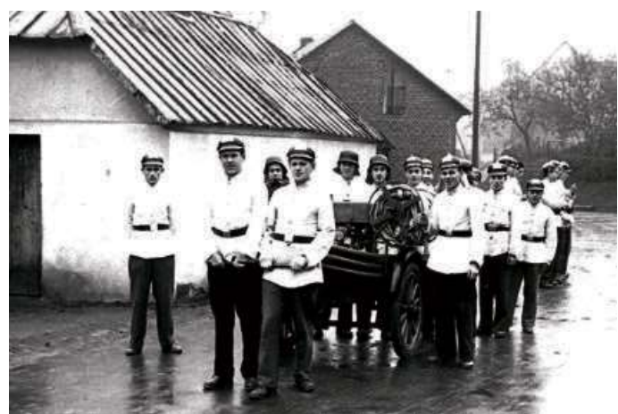
Feuerwehrrübung Ende der 1960er Jahre. Im Hintergrund das Backes und das alte Vereinshaus.

Für die beiden Vorträge in der FeG und die „historischen Führungen“ sind Anmeldungen erforderlich. Diese können direkt auf dem Dorffest, per Telefon unter der Nummer 02773/6970 oder per Email unter gelebte.gemeinschaft@web.de erfolgen. Die Teilnahme an den Angeboten ist kostenlos. Bei allen Veranstaltungen gelten die Corona-Hygienebestimmungen des Lahn-Dillkreises.