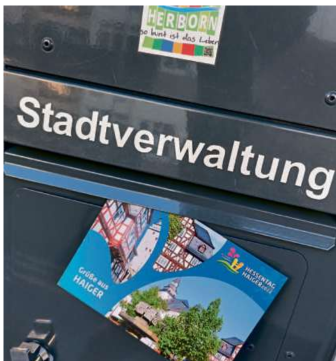
Zahlreiche Grußkarten mit Einladungen wurden in ehemaligen und kommenden Hessentags-Städten verteilt.

Eine Bildergalerie mit den schönsten Fotos der Hessentags-Rad-Rundreise finden Sie auf Seite 5.