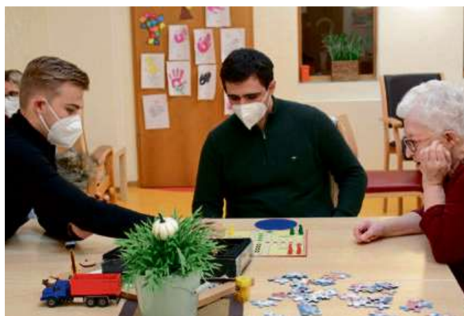
In den Wohnheimen spielen die Gäste mit den Bewohnerinnen und Bewohnern und backen gemeinsam Waffeln.