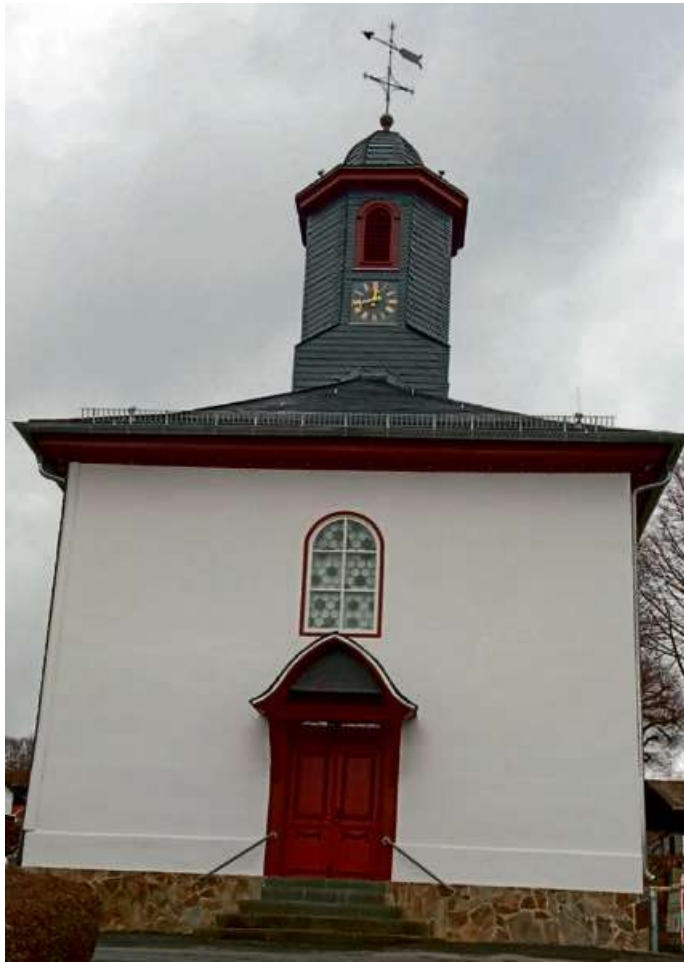
Die evangelische Kirche in Weidelbach.

Mo.: 9 Uhr, Frauen-Gebetskreis; 20 Uhr, Jugend. Di.: 18 Uhr, Jungeschär; 19.30 Uhr, Teenkreis.