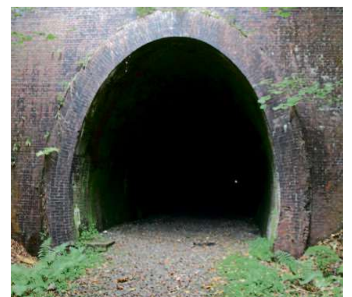
Der Tunnelleingang von der Langenaubacher Seite aus. Hier werden in Kürze die Bauarbeiten beginnen.

Auf den Internetseiten der Abfallwirtschaft Lahn-Dill (www.awld.de) sowie in der AWLD-App sind die Abfuhrtermine für das Jahr 2022 bereits jetzt abrufbar. Wie üblich sind auch Terminerinnerungen per E-Mail oder direkt auf das Smartphone möglich.