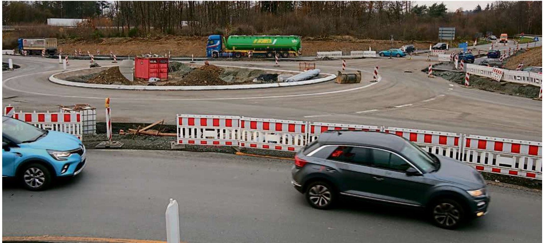
Der Kreisverkehr an der Bundesstraße 54 in Höhe der Kalteiche wird „am offenen Herzen“ umgebaut. Vollsperrungen hat es nicht gegeben. Die Arbeiten werden voraussichtlich noch vor Weihnachten abgeschlossen sein.