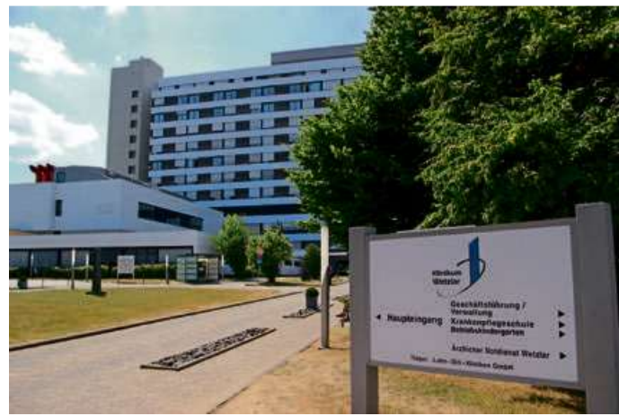
Für Besuche in den Lahn-Dill-Kliniken gilt jetzt die 2G-Plus-Regel.