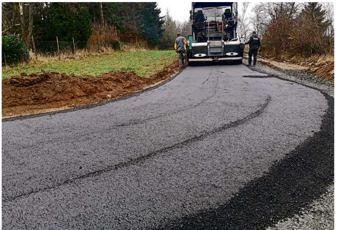
Der Panorama-Rundweg am „Haarwasen“ kann schon jetzt genutzt werden. Er wurde in der vergangenen Woche asphaltiert. Restarbeiten finden noch statt.

In der Westerwaldstraße ist die Asphaltdecke des ersten Bauabschnitts fertig, die Freigabe sollte planmäßig am Mittwoch dieser Woche stattfinden (Redaktionschluss dieser Ausgabe war am Montag). In der Berliner Straße finden vorbereitende Arbeiten für den zweiten Bauabschnitt statt, der ab dem 17. Januar 2022 zwischen Berliner Straße und Reiffenberger geplant ist.