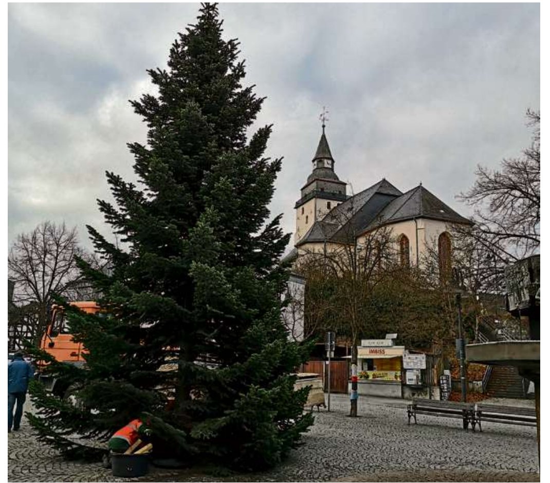
Nach kurzer Anreise wurde die Douglasie auf dem Marktplatz aufgestellt.

Wie die Stadtverwaltung in diesem Zusammenhang mitteilte, kann in Allendorf in diesem Jahr kein Weihnachtsbaum aufgestellt werden. Aufgrund der Erweiterungsarbeiten an der evangelischen Kirche fehlt für den Christbaum der Platz.