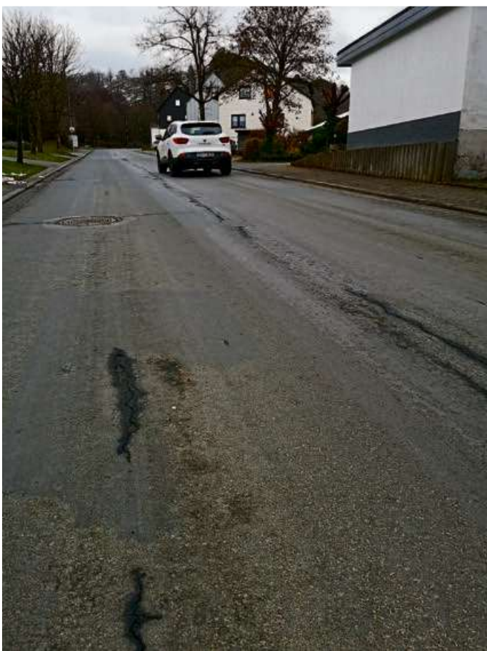
Die Ortsdurchfahrt in Weidelbach muss saniert werden. Die Arbeiten sollen nach dem Hesttag 2022 beginnen.