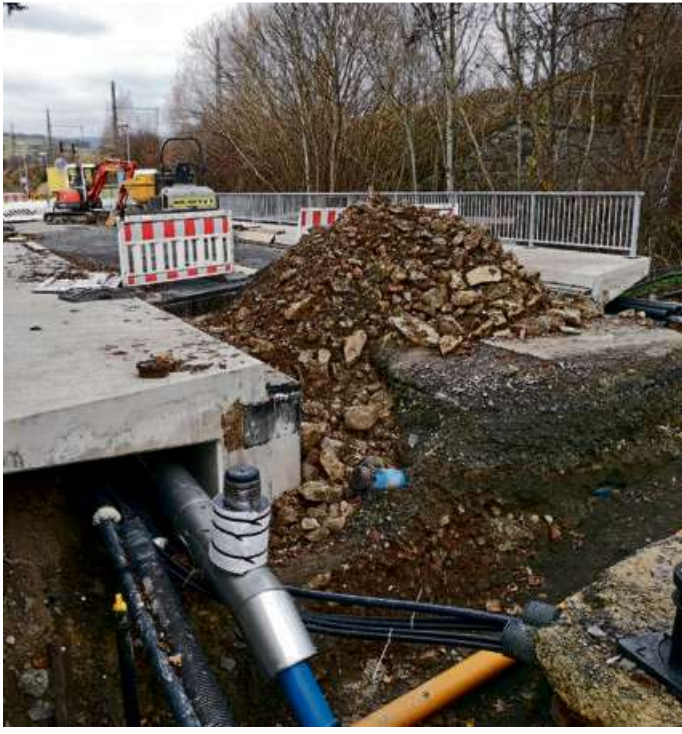
Die Arbeiten an der Brücke in der Reiherstraße waren sehr umfangreich, weil auch zahlreiche Leitungen zu beachten waren. In Kürze soll die Strecke wieder für den Verkehr freigegeben werden.