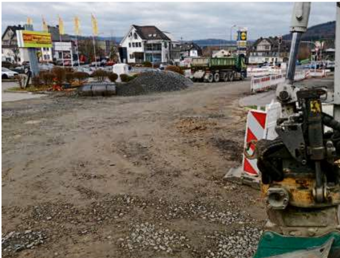
In der Carl-Cloos-Straße soll die Asphalttragschicht - wenn die Witterung dies zulässt - noch vor der Winterpause eingebaut werden.