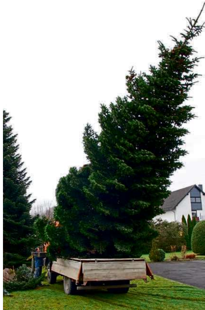
In der Bitzenstraße wurde der Baum von den Mitarbeitern des Bauhofes abgeholt.

In einem Garten in der Bitzenstraße konnten drei Weihnachtsbäume „geerntet“ werden