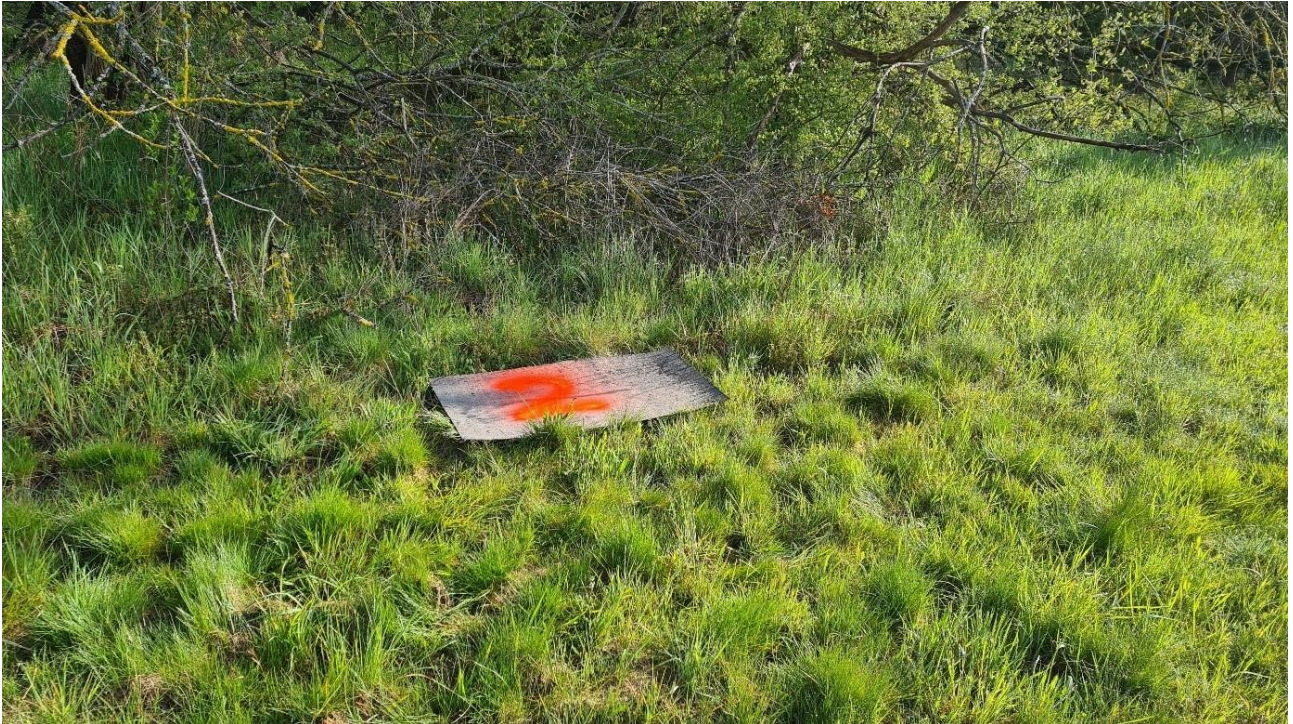
Abb. 7: Künstliches Versteck/Reptilienmatte

Beobachtung in ihren Verstecken verschwinden konnten. Anschließend wurden die geeigneten Teilbereichsräume flächendeckend abgesucht, wobei festes Auftreten vermieden wurde und die Gehgeschwindigkeit bei < 0,5 km/h lag.