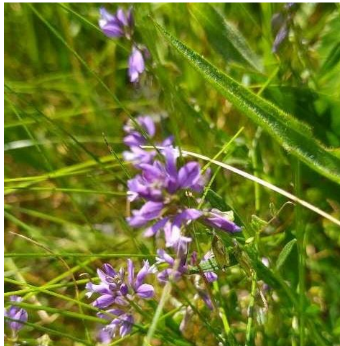
Abb. 6: Gewöhnliche Kreuzblume ( Polygala vulgaris )

Die Gewöhnliche Kreuzblume ( Polygala vulgaris ) wird ebenfalls auf der Vorwarnliste der Roten Liste der BRD geführt (METZING et al. 2018). In Hessen ist die Art aktuell nicht gefährdet (HLNUG 2019-1).