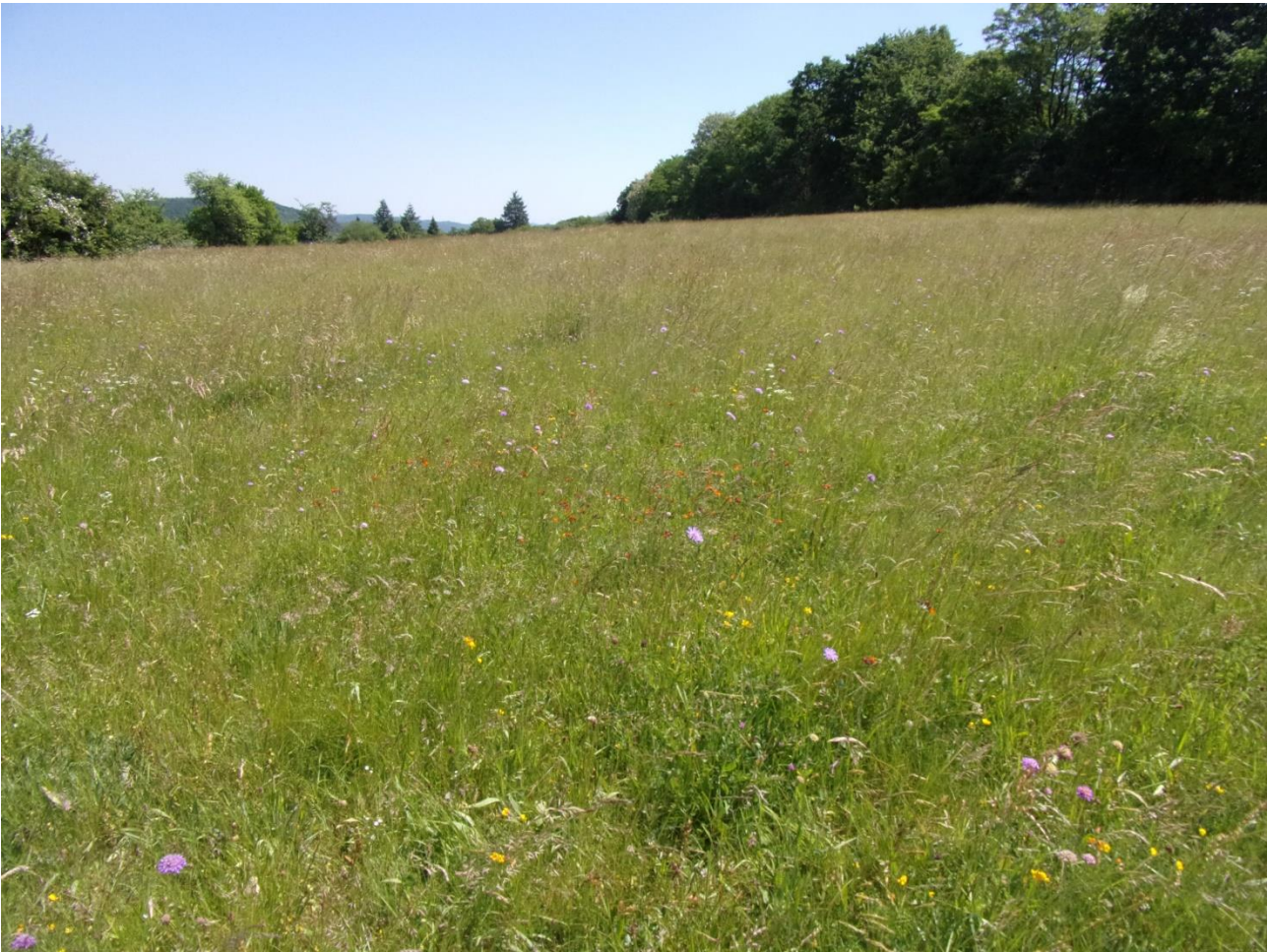
Abb. 3: Blütenreiche Extensivwiese (FFH-LRT 6510) im Süden des Untersuchungsraumes

Etwas weniger als die Hälfte des Grünlandbestandes erfüllt die o.g. Kriterien zur Einordnung als FFH-LRT nicht, weshalb diese Flächen dem Nutzungstyp „Sonstige extensiv genutzte Mähwiese“ (KV-Nr. 06.330) zugeordnet wurden.