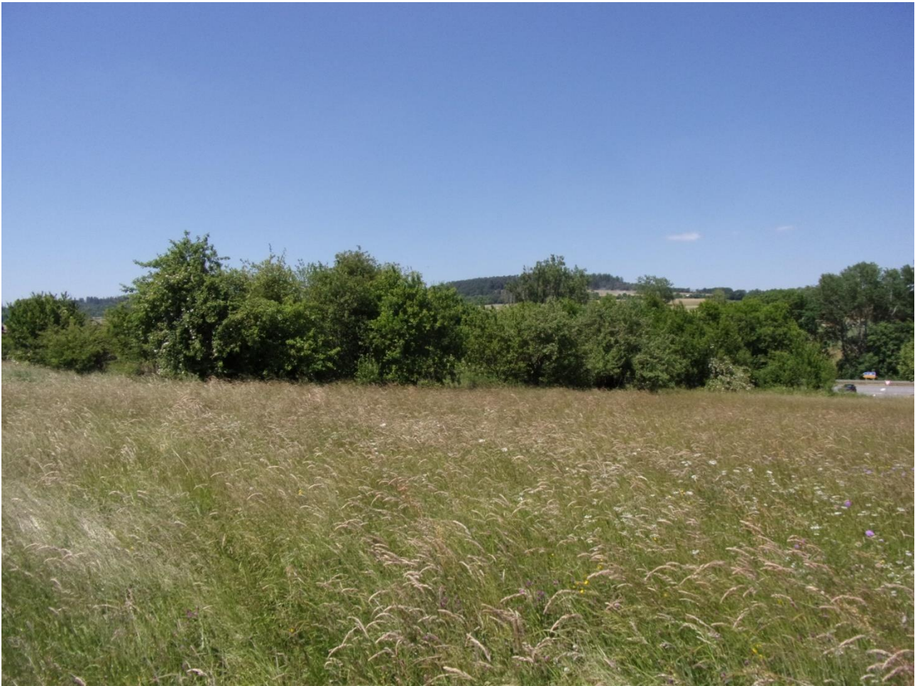
Abb. 2: Verbrachter und verbuschter Streuobstbestand im Norden des Untersuchungsraumes

Der Gehölzbestand am südöstlichen Rand des UR stellt sich als großflächig zusammenhängend dar und wird daher dem Nutzungstyp „Feldgehölz“ (KV-Nr. 04.600) zugeordnet.