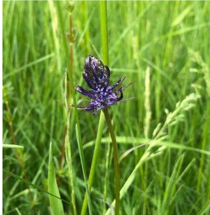
Abb. 5: Schwarze Teufelskralle ( Phyteuma nigrum )

Die Schwarze Teufelskralle ( Phyteuma nigrum ) befindet sich ebenfalls auf der Vorwarnliste der Roten Liste der BRD. Zudem besteht eine besonders hohe Verantwortung Deutschlands für diese Art, da das Aussterben in Deutschland gravierende Folgen für die Gesamtpopulation hätte (METZING et al. 2018). In Hessen ist die Art aktuell nicht gefährdet (HLNUG 2019-1).