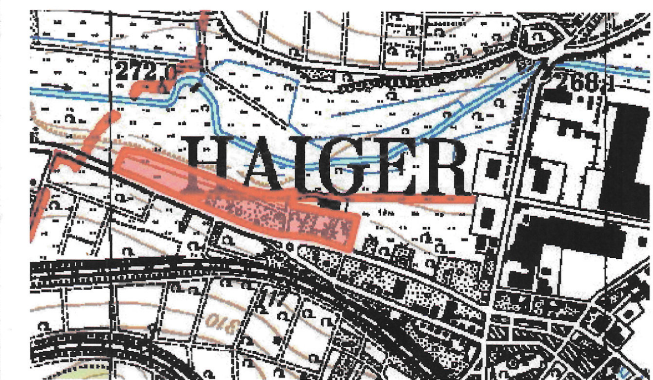
Übersichtsplan ohne Maßstab

Haiger, 06. JUNI 2012 [Signature] (Bürgermeister)